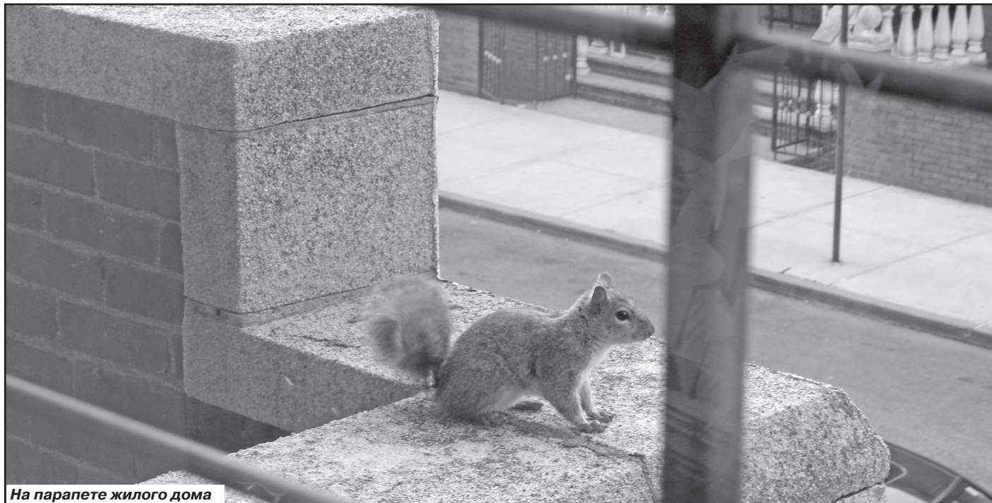
На парапете жилого дома