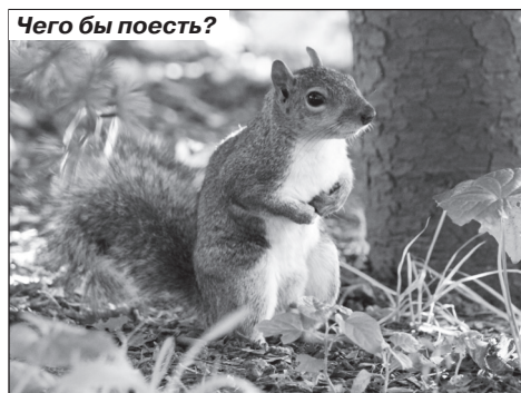
Чего бы поесть?