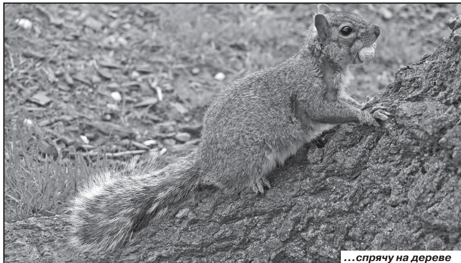
...спрячу на дереве