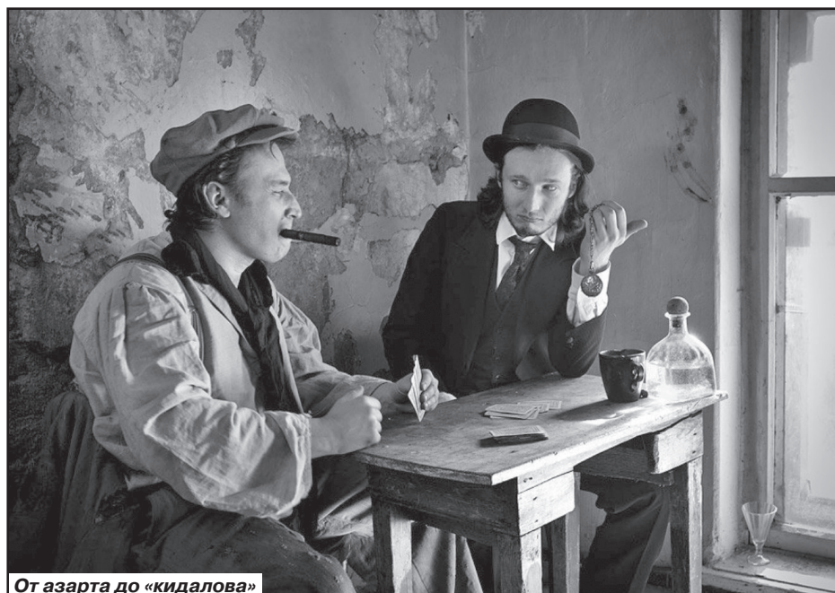
От азарта до «кидалова»

Ученик оказался способным: уже перед выходом на свободу он обыграл и свое-