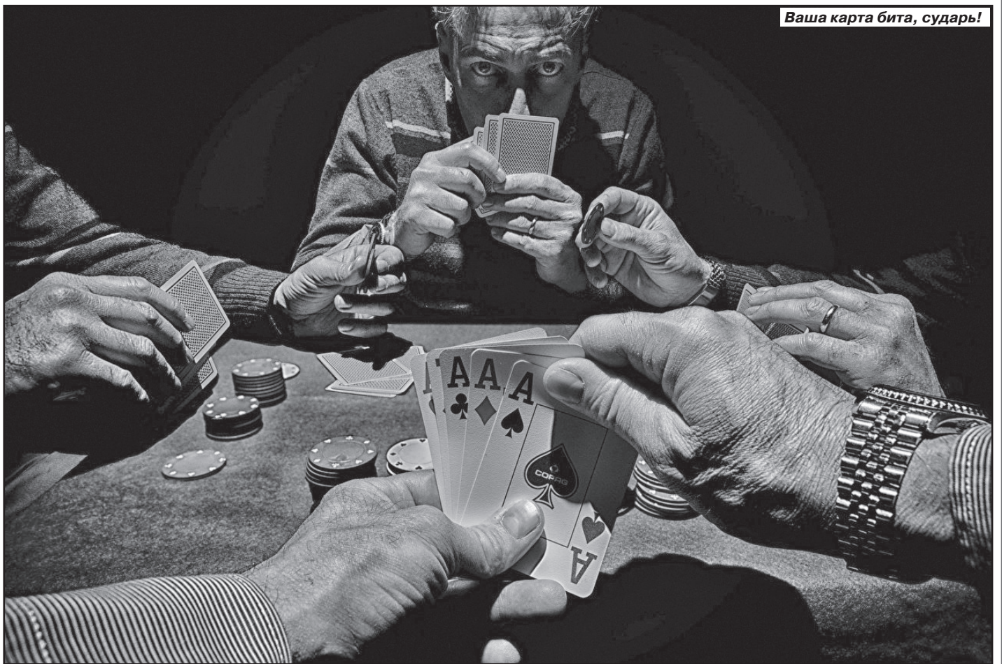
Ваша карта бита, сударь!