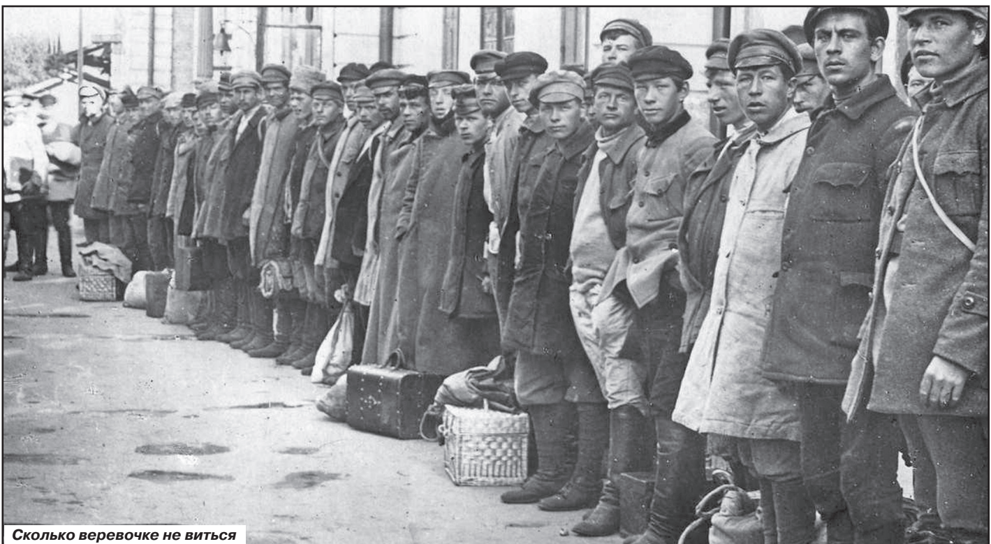
Сколько веревочке не виться

Влюбленный в «графиню» Шенкель помог аферистам документально оформить в долгосрочную концессию более тридцати российских приисков, которые Трубецкой-Трахтенберг впоследствии умудрился втюхать французскому правительству!