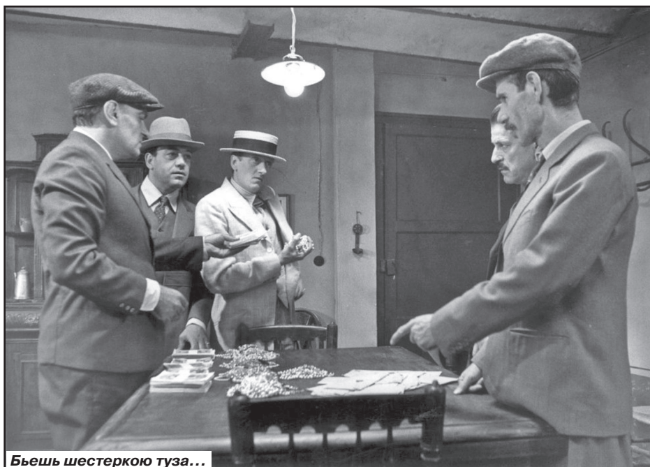
Бьешь шестеркою туза...

го учителя, и одного из охранников на приличную сумму и «откинулся» на волю вновь состоятельным гражданином.