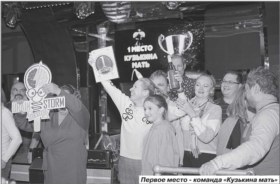
Первое место - команда «Кузькина мать»