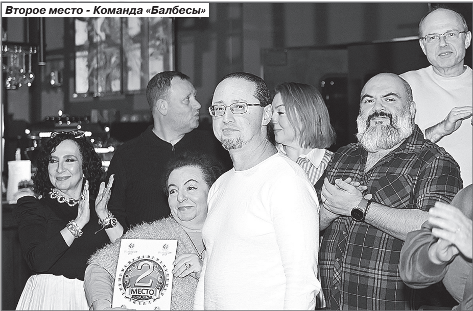
Второе место - Команда «Балбесы»