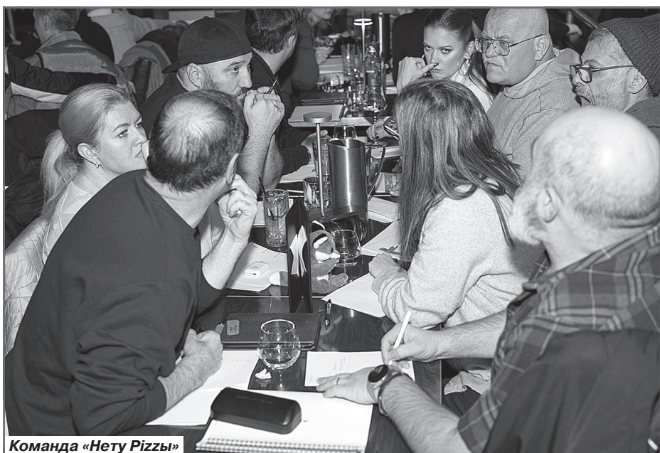
Команда «Нету Пиззы»