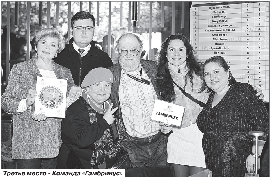
Третье место - Команда «Гамбринус»

Впереди заключительная игра 2025 года! Всем удачи!