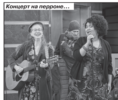
Концерт на перроне...