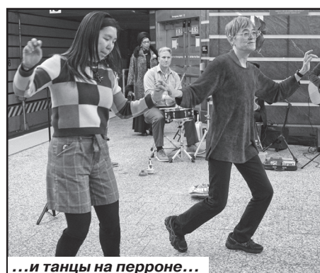
...и танцы на перроне...