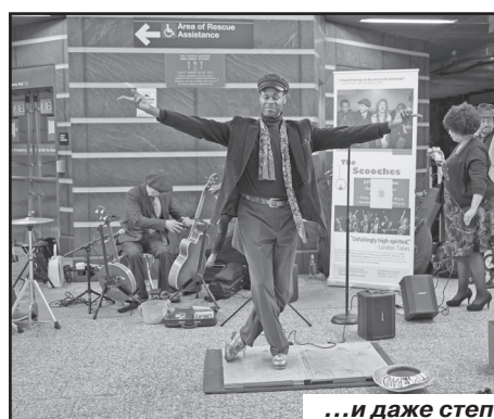
...и даже степ