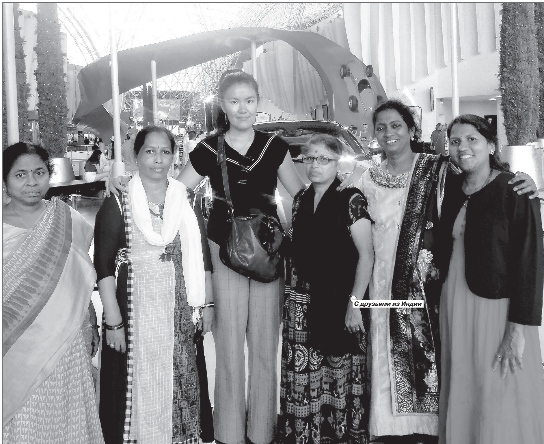
С друзьями из Индии