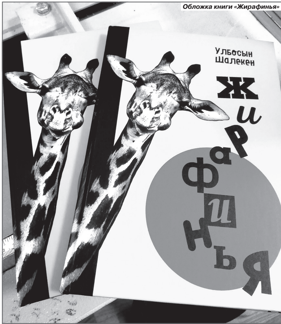
Обложка книги «Жирафья»

Так что творчество - это постоянное путешествие, у него нет конца. Мы все в нашей семье пытаемся жить дисциплинированно и по плану. Результативно. И главное тут не лениться.