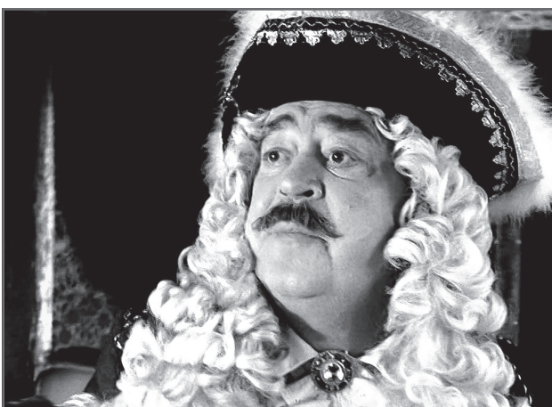
В фильме «Тайны дворцовых переворотов. Россия, век XVIII»