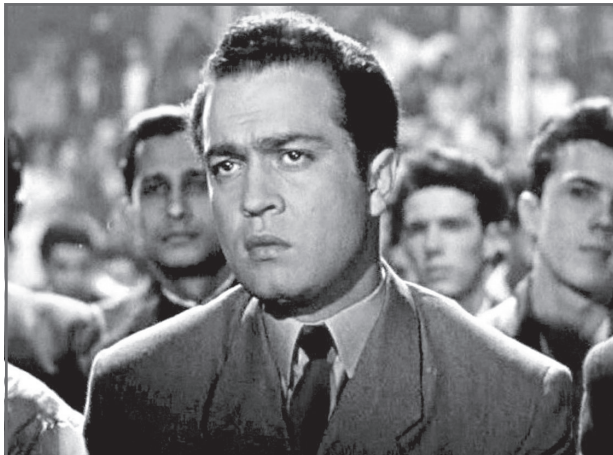
В фильме «Матрос с «Кометы»»