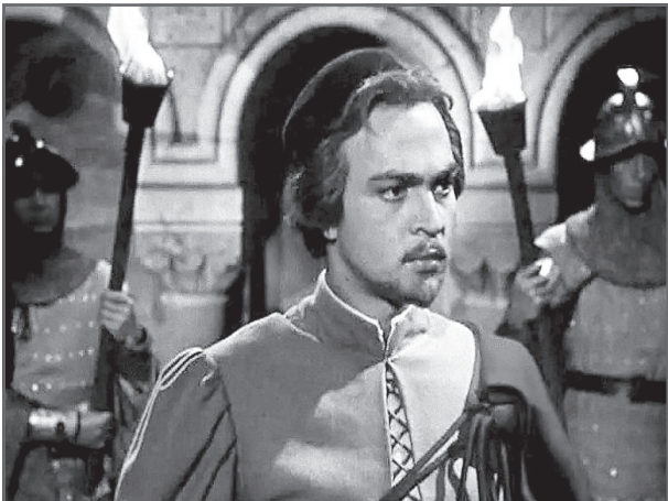
В фильме «Отелло»