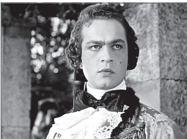
В фильме «Михайло Ломоносов»