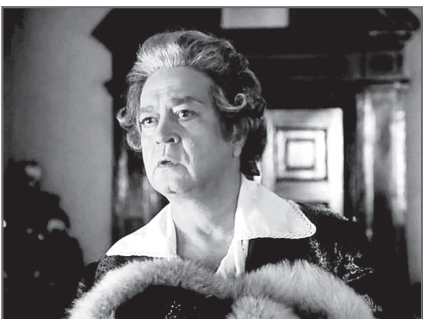
В фильме «Виват, гардемарины!»