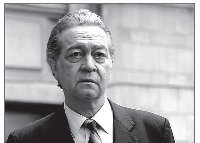
В фильме «Грех. История страсти»