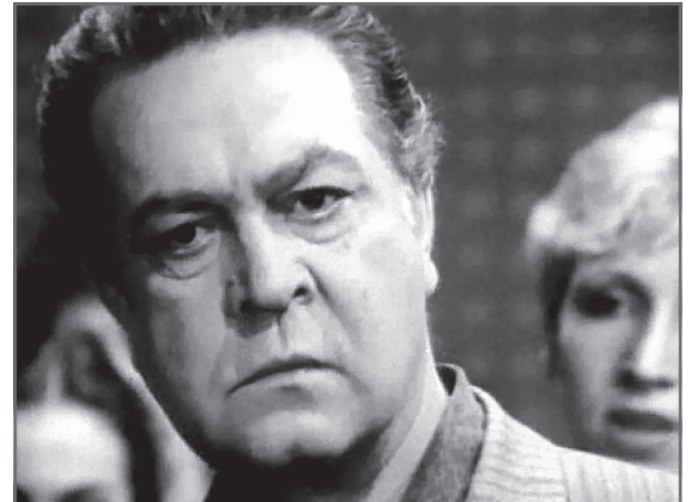
В фильме «Где бы ни работать»