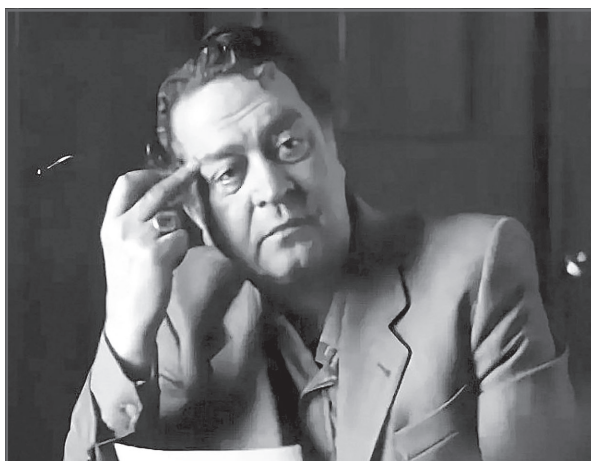
В фильме «Колье Шарлотты»