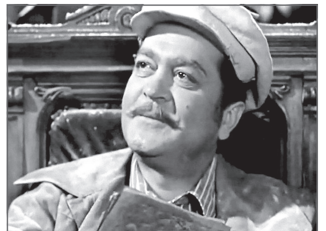
В фильме «Талант»