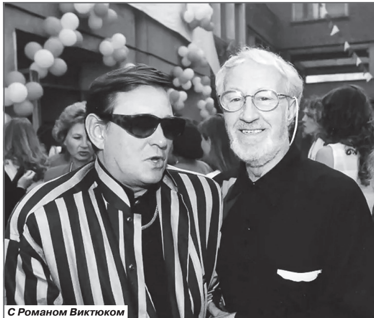
С Романом Виктюком

лей, а главный его зритель, как ни странно, - старший, потому что он может дать оценку, он может «вести» театр.