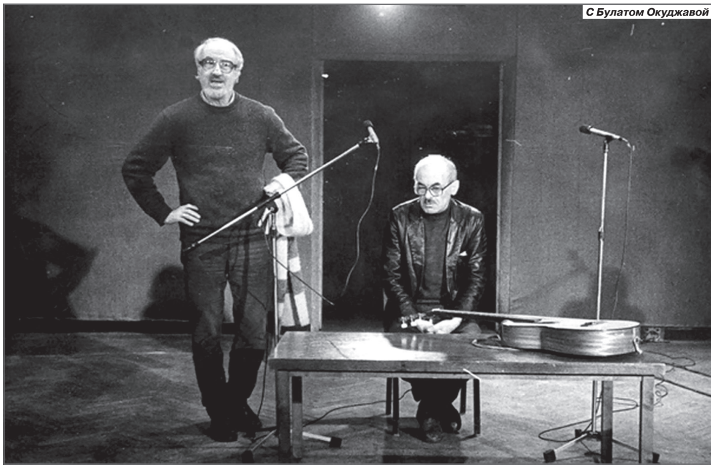
С Булатом Окуджавой