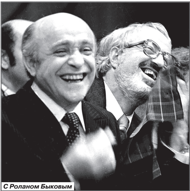
С Роланом Быковым