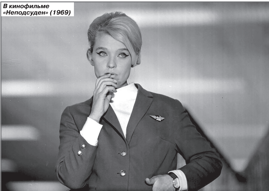
В кинофильме «Неподсуден» (1969)