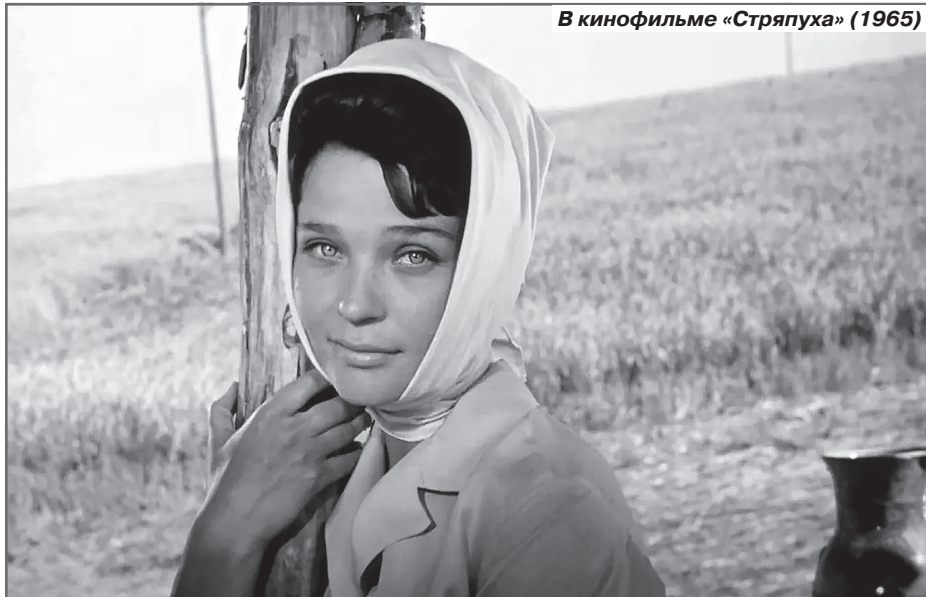
В кинофильме «Стряпуха» (1965)