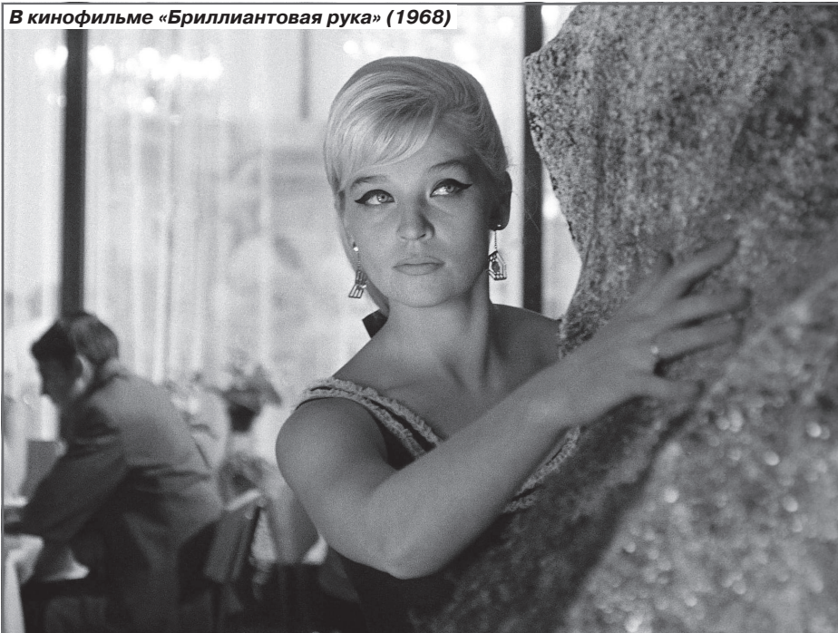
В кинофильме «Бриллиантовая рука» (1968)