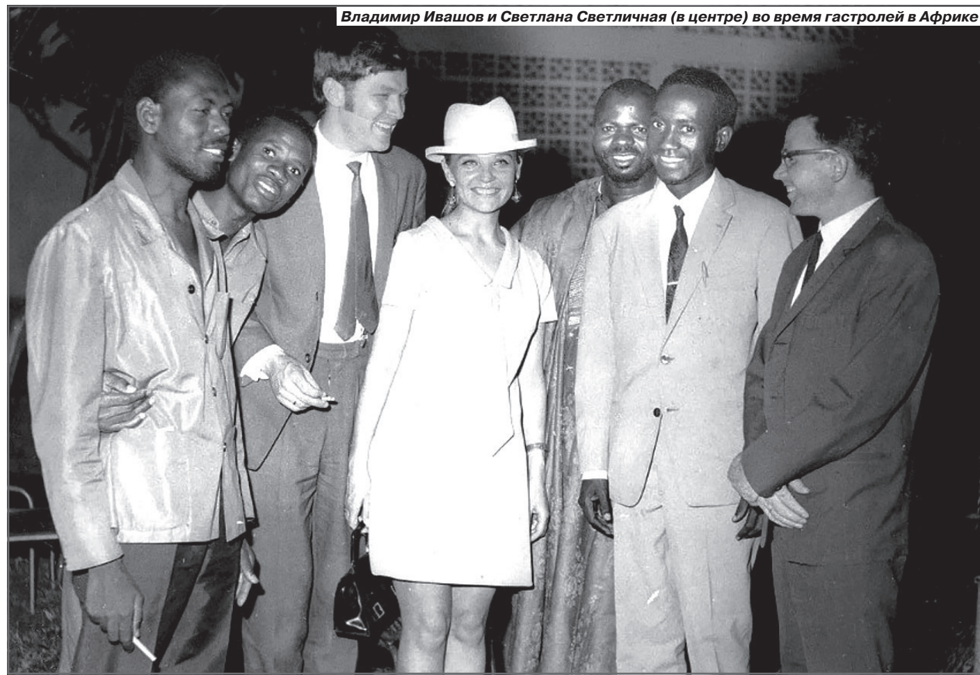
Владимир Ивашов и Светлана Светличная (в центре) во время гастролей в Африке

Прощание с актрисой прошло 20 ноября в Белом зале Дома кино. Похоронена она на Троекуровском кладбище в Москве.