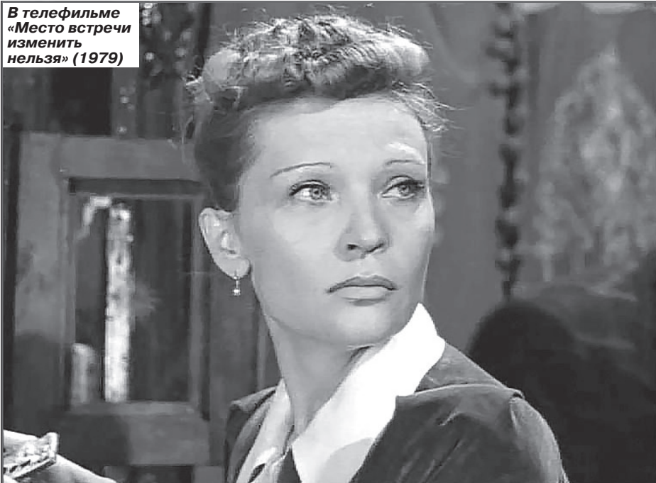
В телефильме «Место встречи изменить нельзя» (1979)