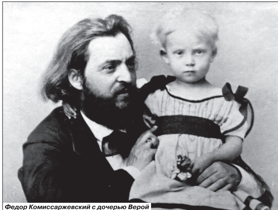
Федор Комиссаржевский с дочерью Верой

Пускай хоть в небе - Вера с нами. Смотри сквозь тучи: там она - Развернутое ветром знамя, Обетованная весна.