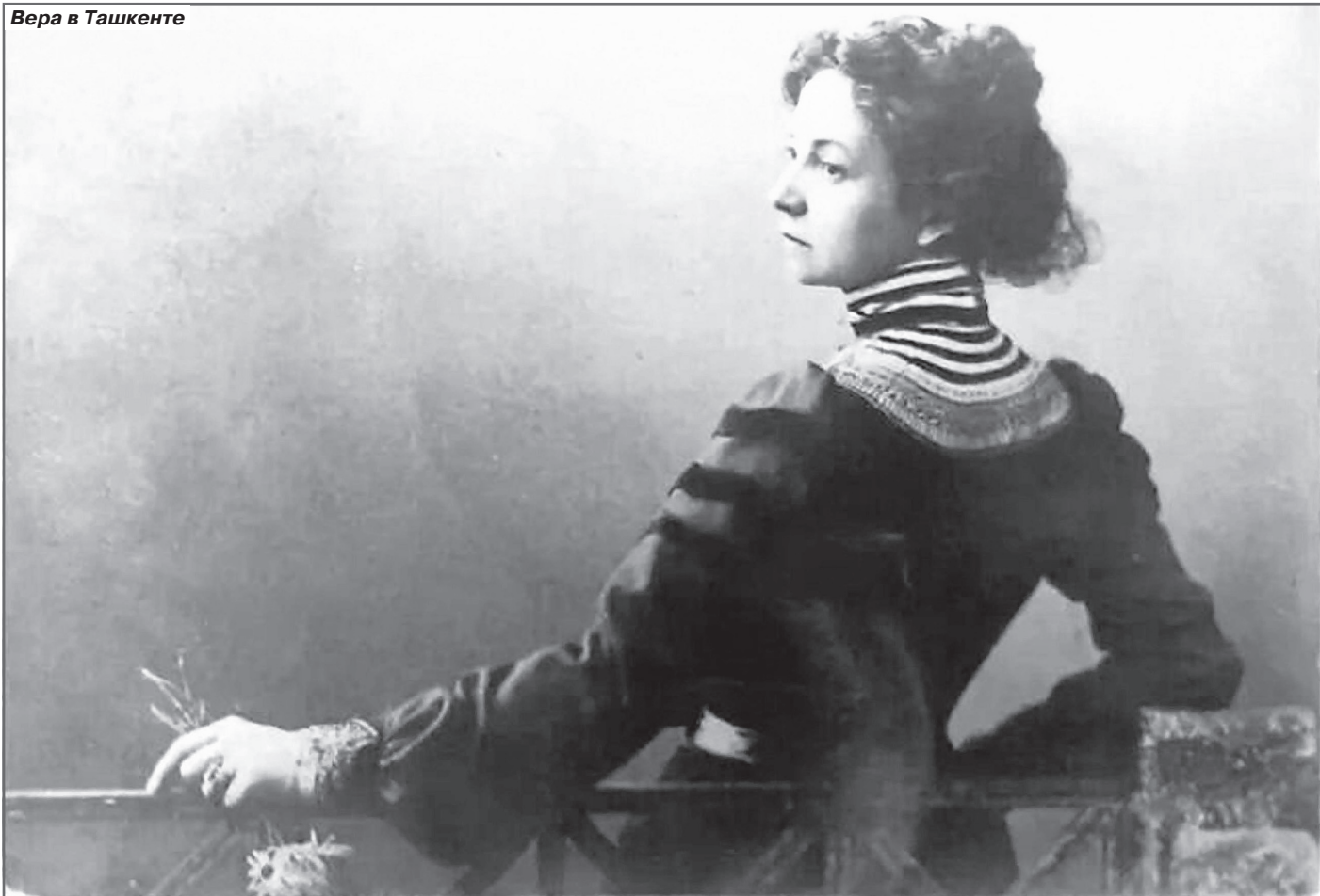
Вера в Ташкенте

Говорили, что она была влюблена в Чехова, и не только как в драматурга. Они вели переписку до самой его смерти, но особой задушевностью она не отличалась. Антон Павлович очень ценил Комиссаржевскую как актрису, но его отталкивала экзальтация, свойственная ей в жизни и в письмах. Письма с головой выдавали ее мятежную, вечно сомневающуюся натуру. Они с трудом поддавались чтению, слова набегали друг на друга, строчки расходились в разные стороны - не всегда можно было определить даже, где начало и конец каждого письма.