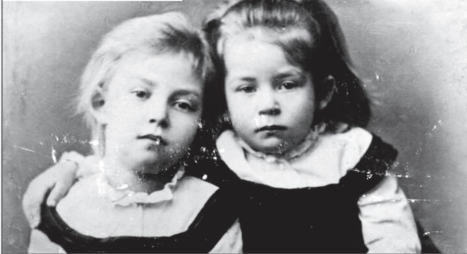
Вера и Надя Комиссаржевские