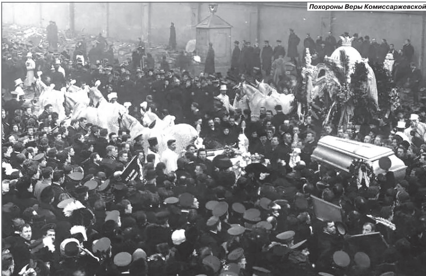
Похороны Веры Комиссаржевской