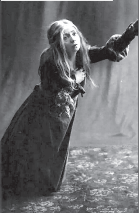
Вера Комиссаржевская в спектакле «Сестра Беатриса»

Тем временем над их головами заносился еще один удар. Отцу нужно было оформить развод и повторно венчаться