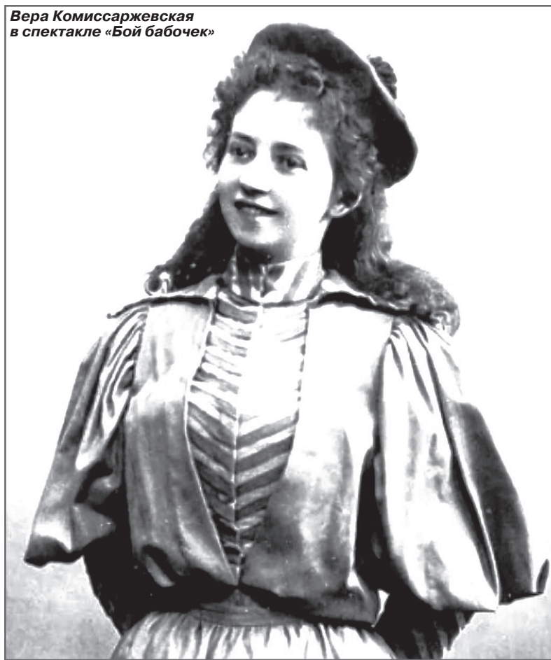
Вера Комиссаржевская в спектакле «Бой бабочек»

со своей княжной, чтобы узаконить ребенка, который у него вот-вот должен был родиться.