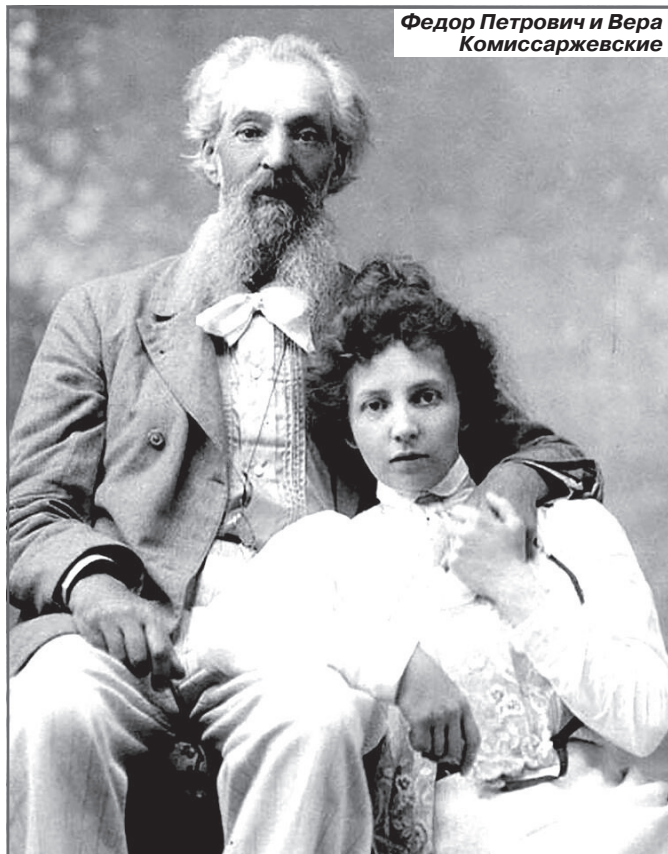
Федор Петрович и Вера Комиссаржевские