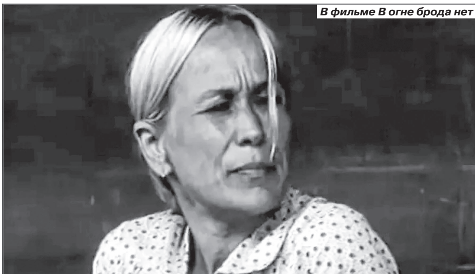
В фильме В огне брода нет

первой в Советском Союзе исполнила песни Эдит Пиаф, ей поступило предложение стать профессиональной эстрадной певицей.