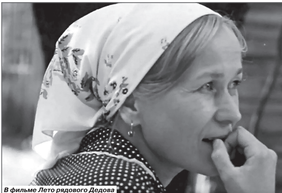
В фильме Лето рядового Дедова