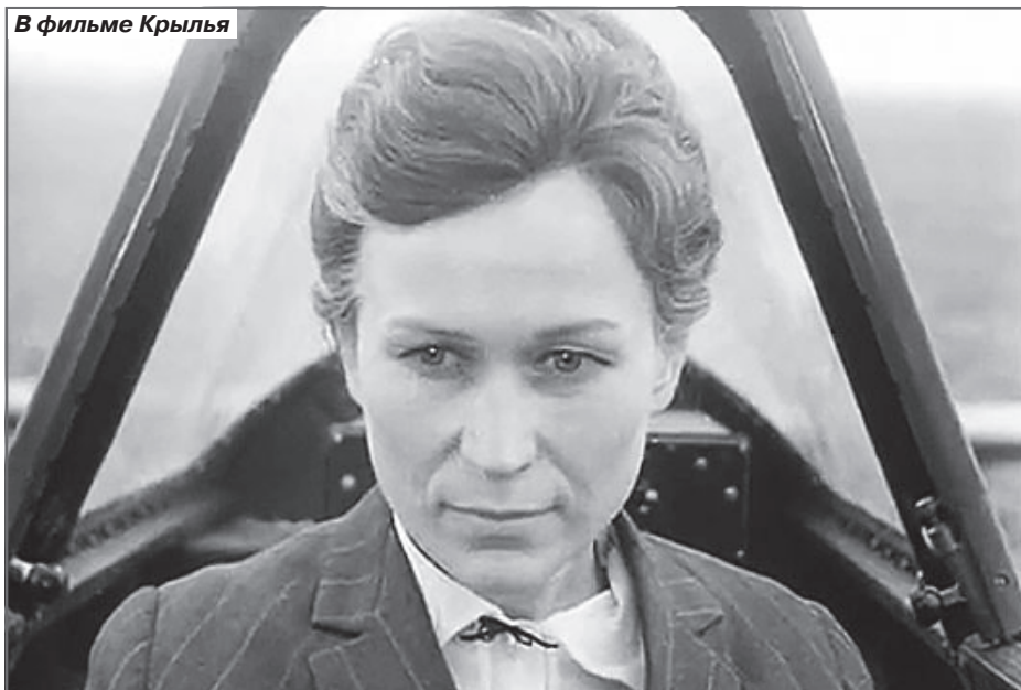
В фильме Крылья