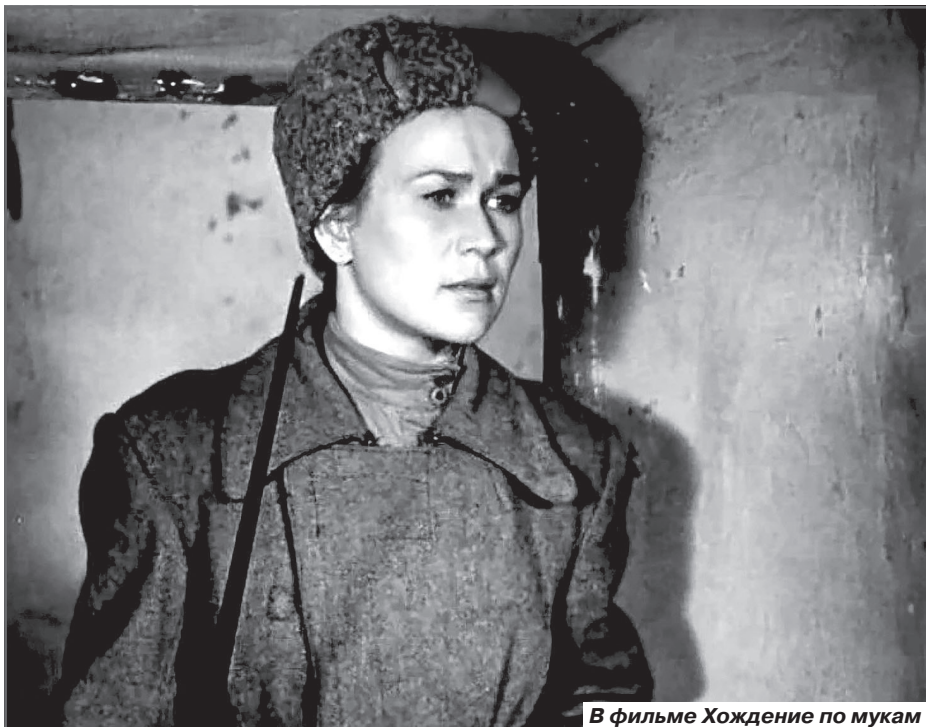
В фильме Хождение по мукам