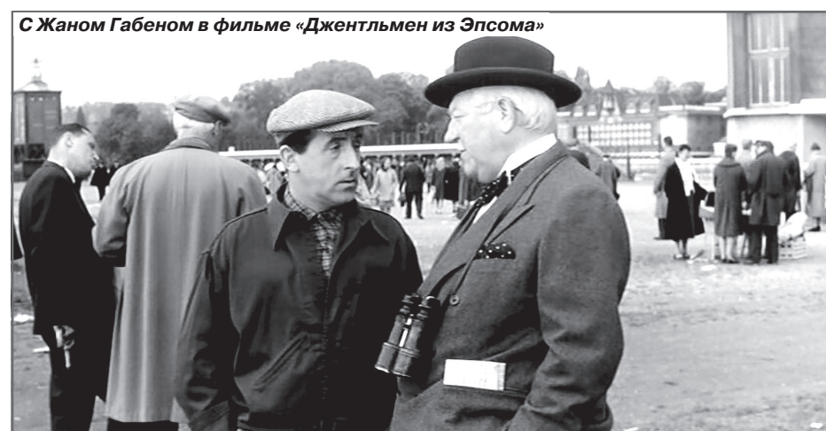
С Жаном Габеном в фильме «Джентльмен из Эпсомы»