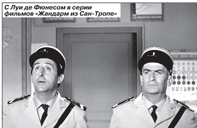
С Луи де Фюнесом в серии фильмов «Жандарм из Сан-Тропе»