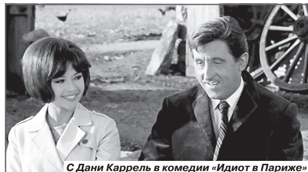
С Дани Каррель в комедии «Идиот в Париже»