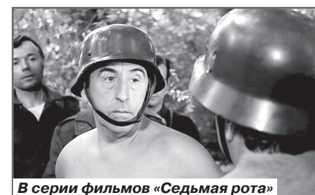
В серии фильмов «Седьмая рота»