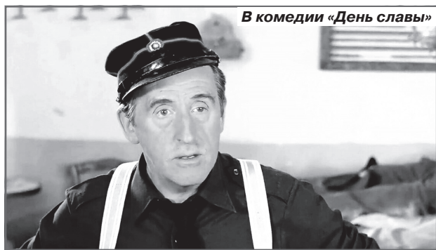
В комедии «День славы»