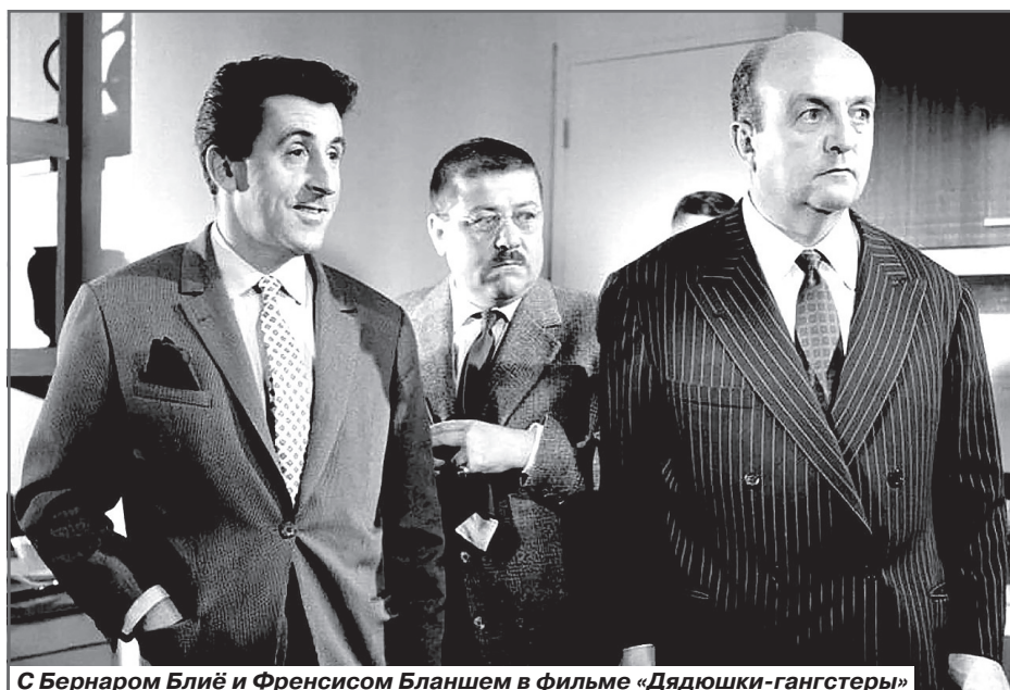
С Бернаром Блӣ и Френсисом Бланшем в фильме «Дядюшки-гангстеры»

После этого звезда Жана Лефевра закатилась. В дальнейшем он много снимался, но успех стал обходить его стороной. В качестве компенсации карьерных неудач, Жану повезло в 1999 году в лотерею, когда он выиграл пятнадцать миллионов франков.