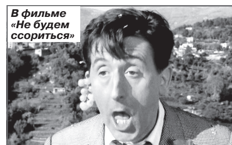
В фильме «Не будем ссориться»