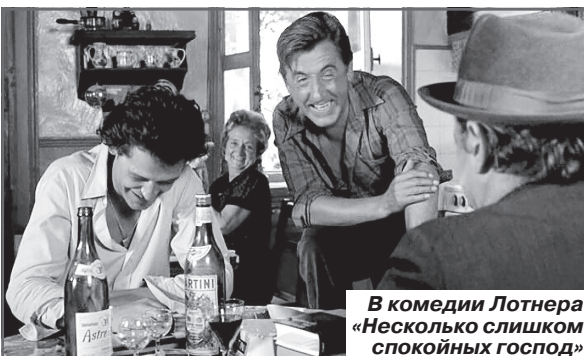
В комедии Лотнера «Несколько слишком спокойных господ»