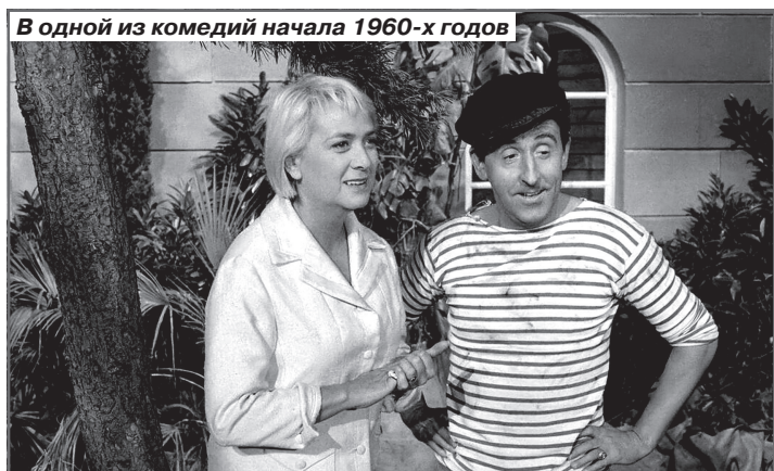
В одной из комедий начала 1960-х годов