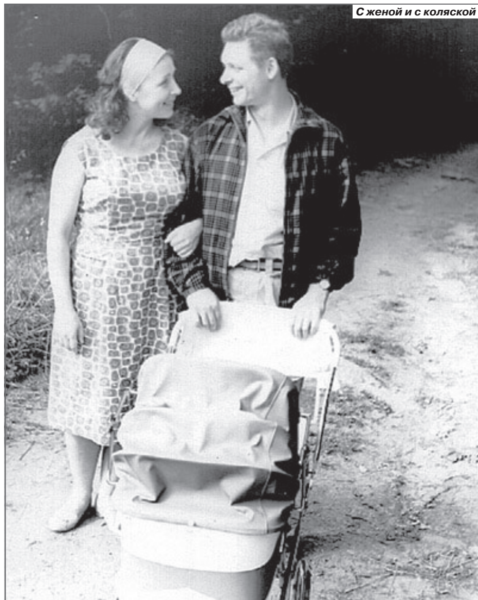
С женой и с коляской