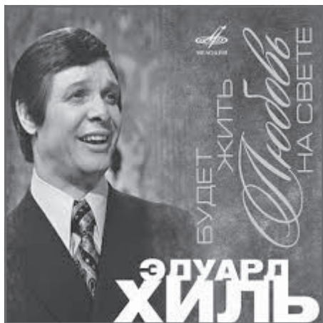
Обложка пластинки «Будет жить любовь на свете»