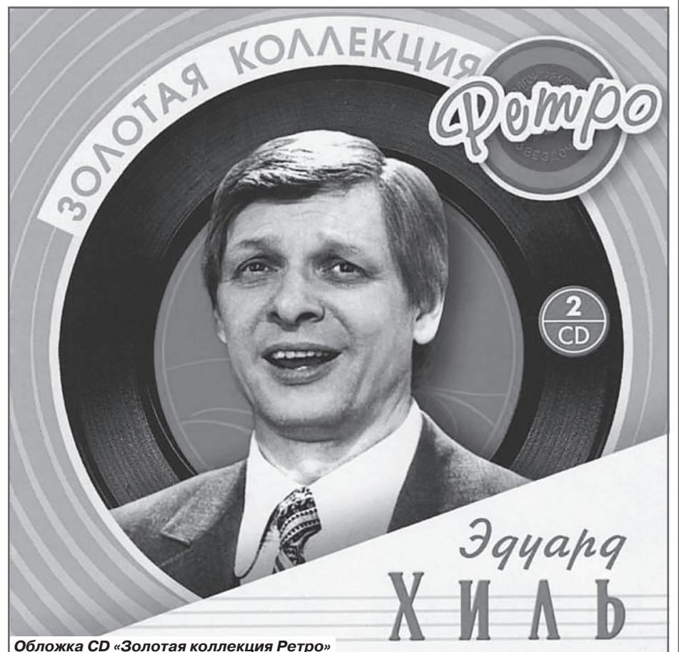
Обложка CD «Золотая коллекция Ретро»

шедшие были. Представляешь, одна даже выстрелила в мою жену с крыши дома напротив, каким-то чудом Зоя уцелела. Другая дама попыталась облить ее кислотой, когда жена выходила из подъезда. Я был вынужден нанять