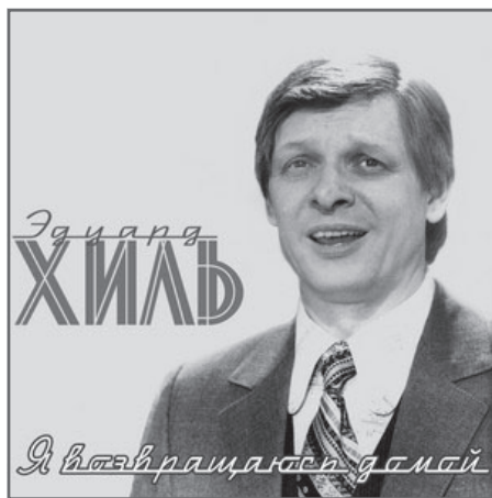
Обложка пластинки «Я возвращаюсь домой»