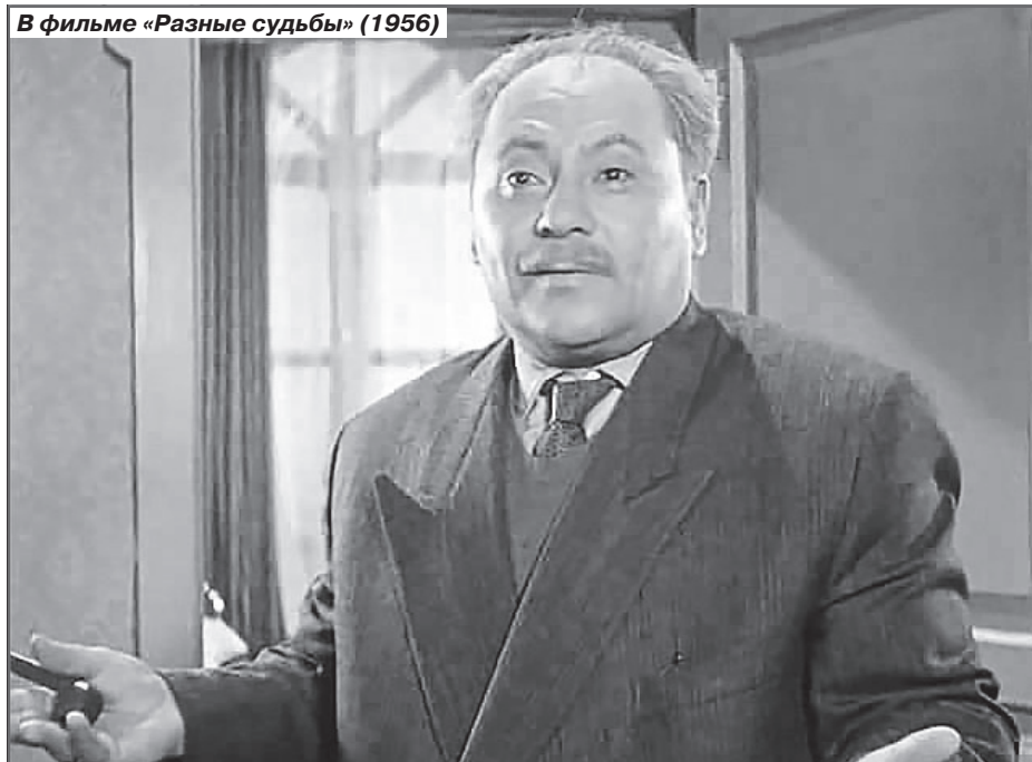
В фильме «Разные судьбы» (1956)