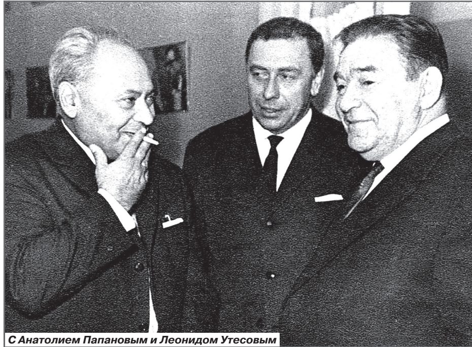
С Анатолием Папановым и Леонидом Утесовым