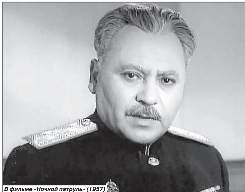
В фильме «Ночной патруль» (1957)