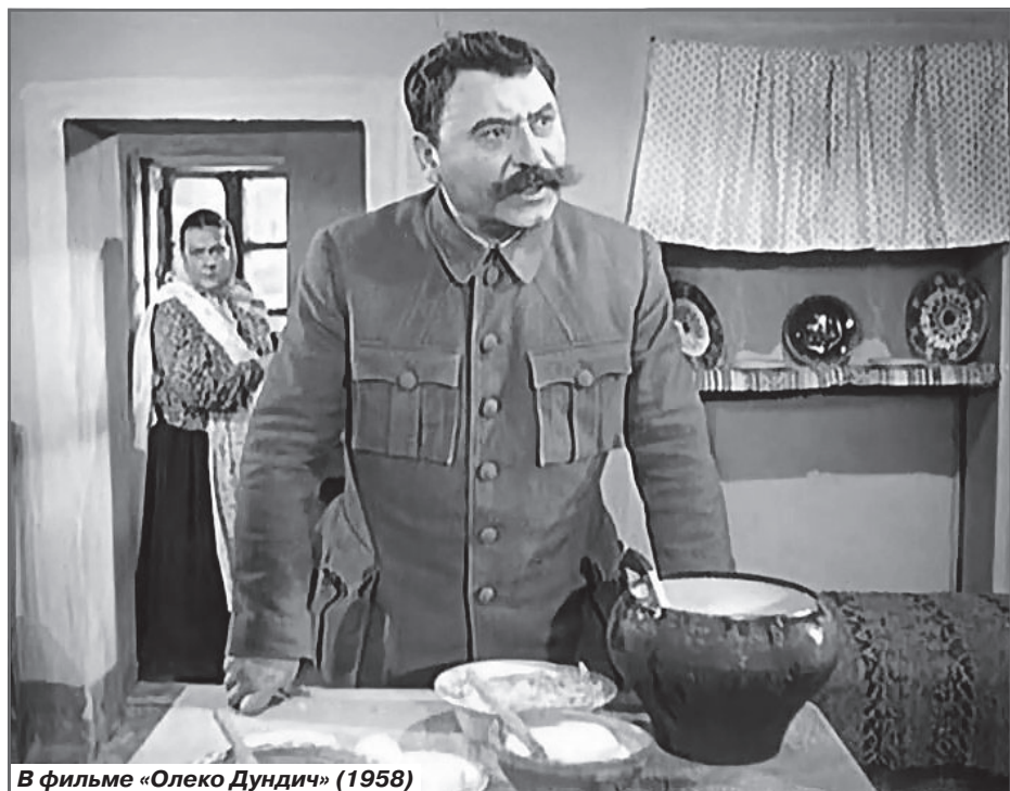
В фильме «Олеко Дундич» (1958)