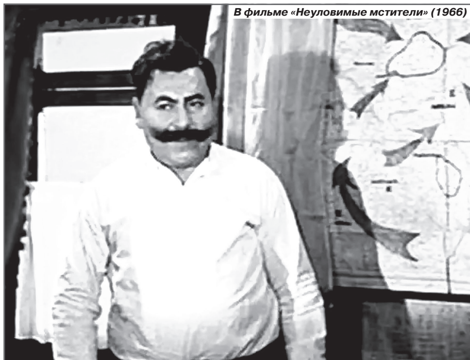
В фильме «Неуловимые мстители» (1966)