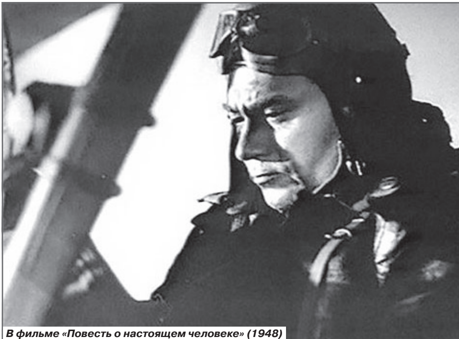
В фильме «Повесть о настоящем человеке» (1948)