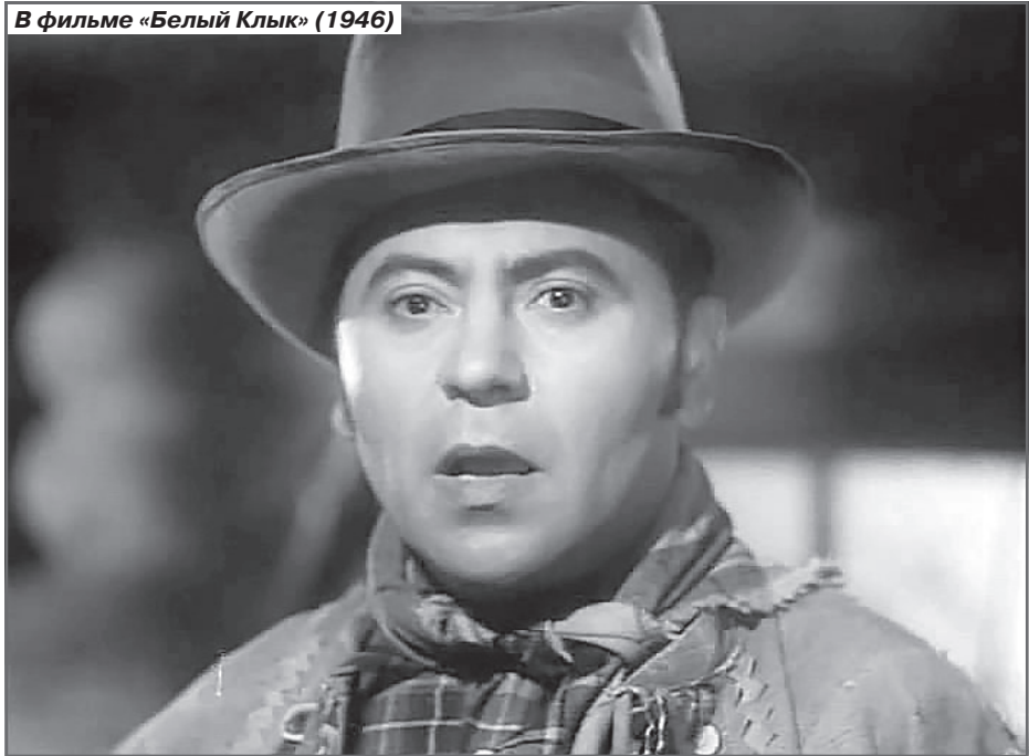
В фильме «Белый Клык» (1946)

Артист умер, но после него осталось множество работ. Именно благодаря им в памяти и в сердцах зрителей надолго останутся роли Льва Свердлина, фильмы, где он бодр и весел.