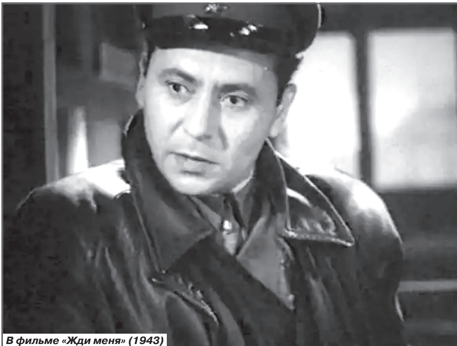
В фильме «Жди меня» (1943)