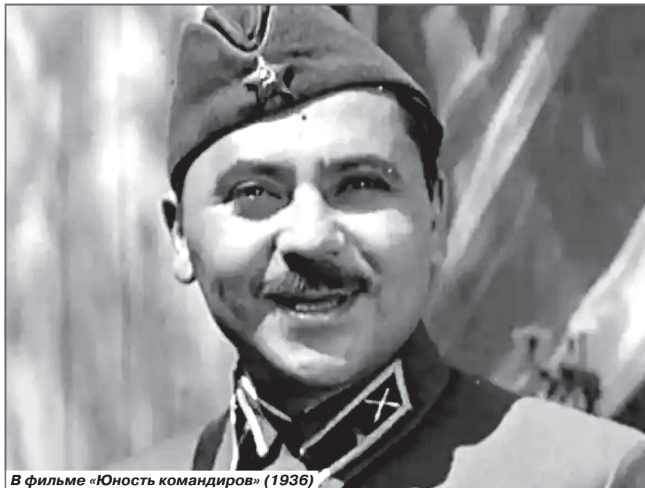
В фильме «Юность командиров» (1936)

После неслыханного успеха Льву предложили играть в других постановках. В двадцать втором году Свердловли ждали новые разноплановые роли.