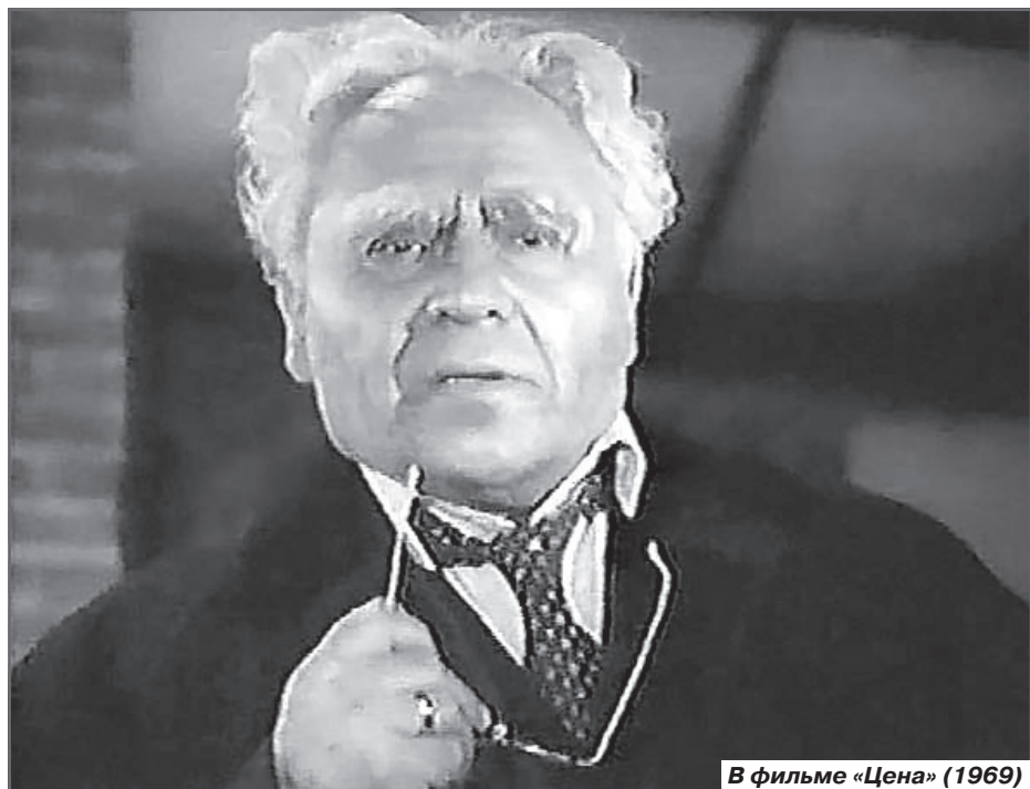
В фильме «Цена» (1969)