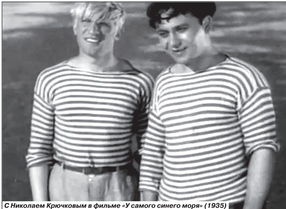
С Николаем Крючковым в фильме «У самого синего моря» (1935)

Несмотря на то, что у парня было невероятно трудное детство, он лелеял в