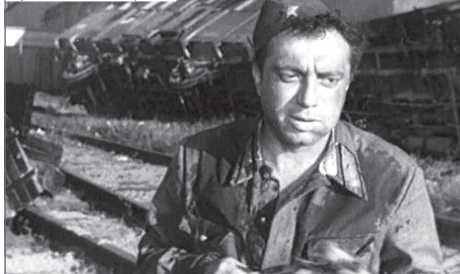
В фильме «Живые и мертвые»

- Я сделал главное - я догнал свой поезд.