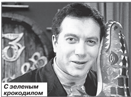
С зеленым крокодилом