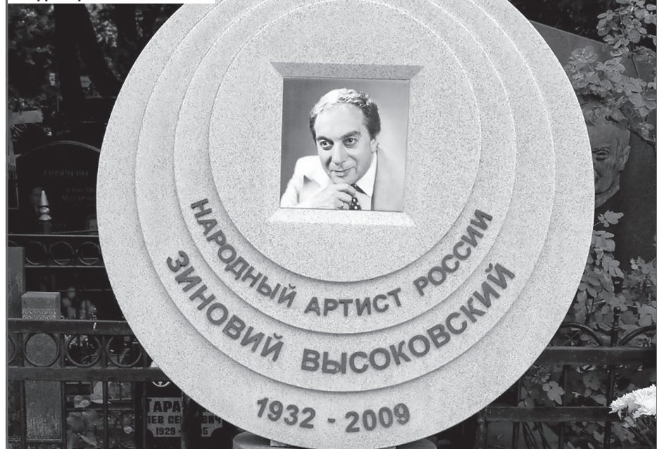
Памятник на могиле пана Зюзи на Ваганьковском кладбище

С первыми космонавтами я очень дружил. Они «завязывали» с Люльком в космосе и «развязывали» со мной на Земле.