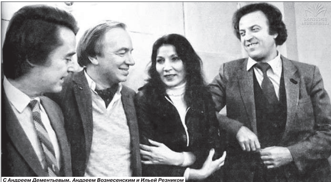
С Андреем Дементьевым, Андреем Вознесенским и Ильей Резником

сомнительных последователей за недвижимостью. Одних только племянников объявилось тринадцать человек.