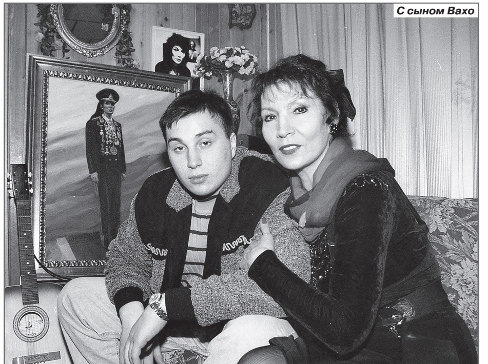
С сыном Вахо