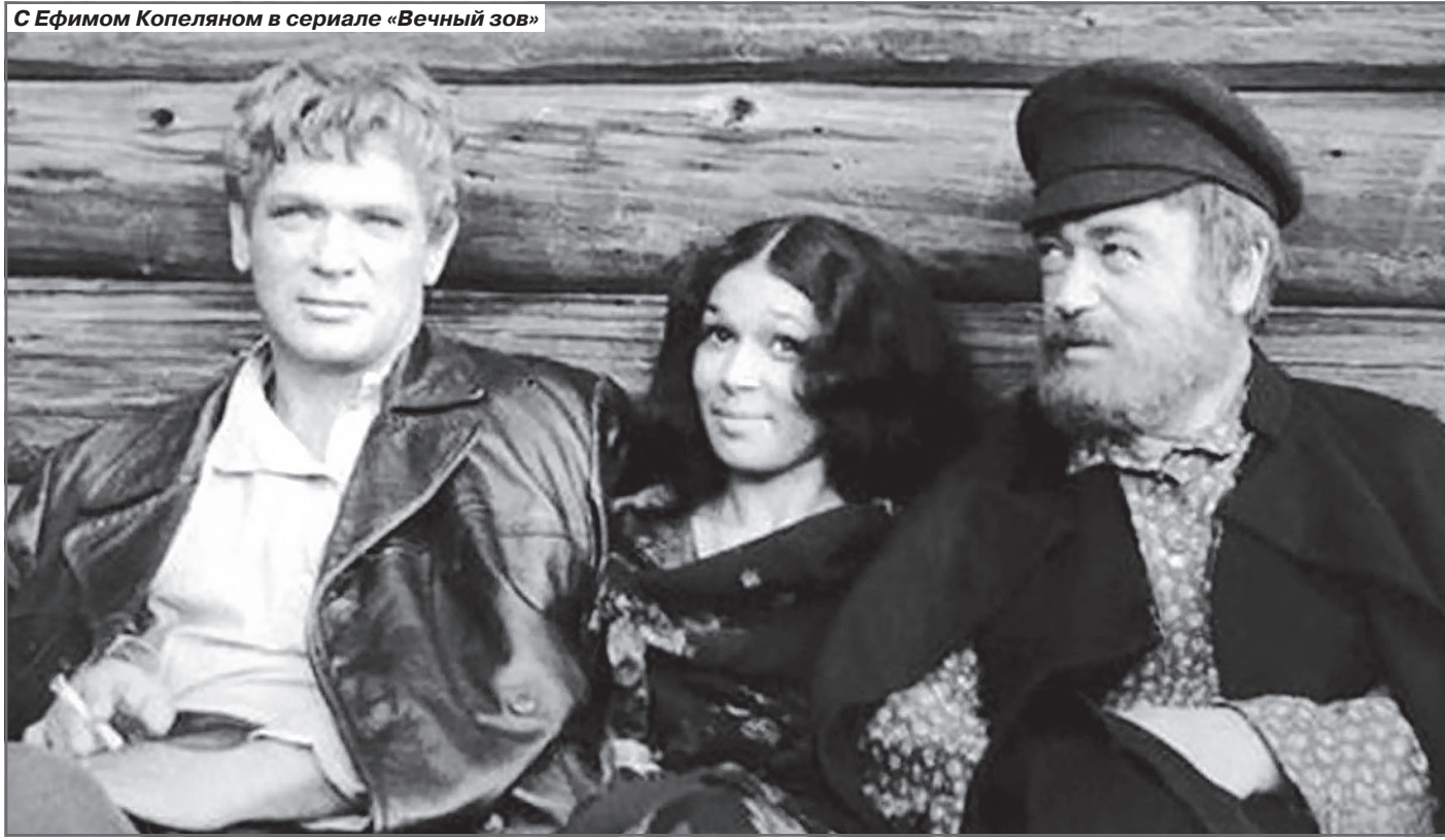
С Ефимом Копеляном в сериале «Вечный зов»