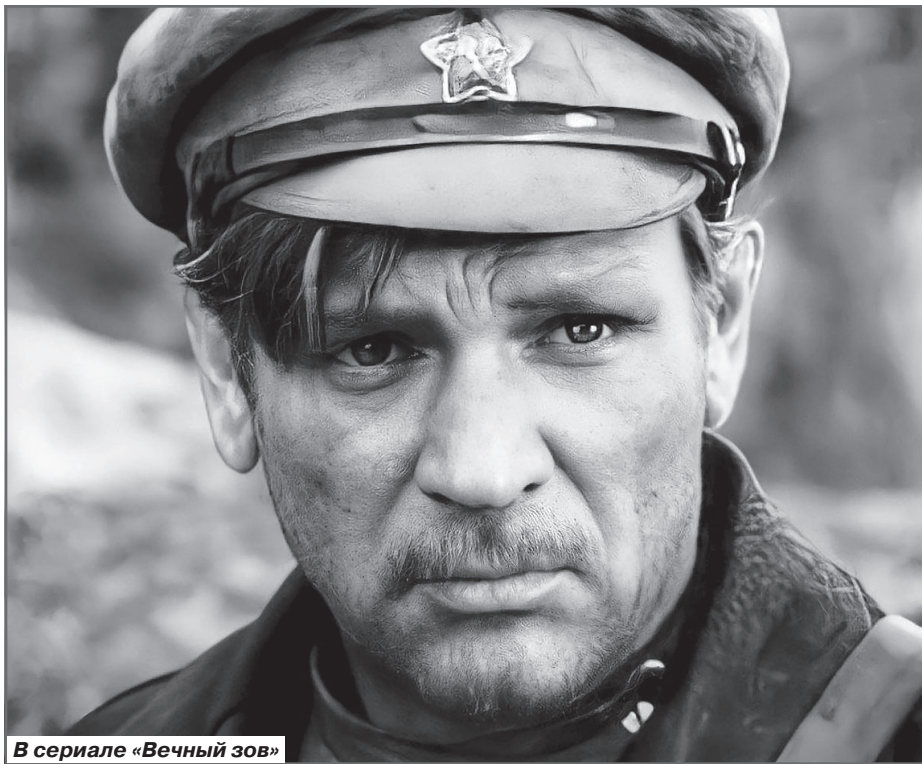
В сериале «Вечный зов»

техником, помощником конструктора - всего не перечислишь.