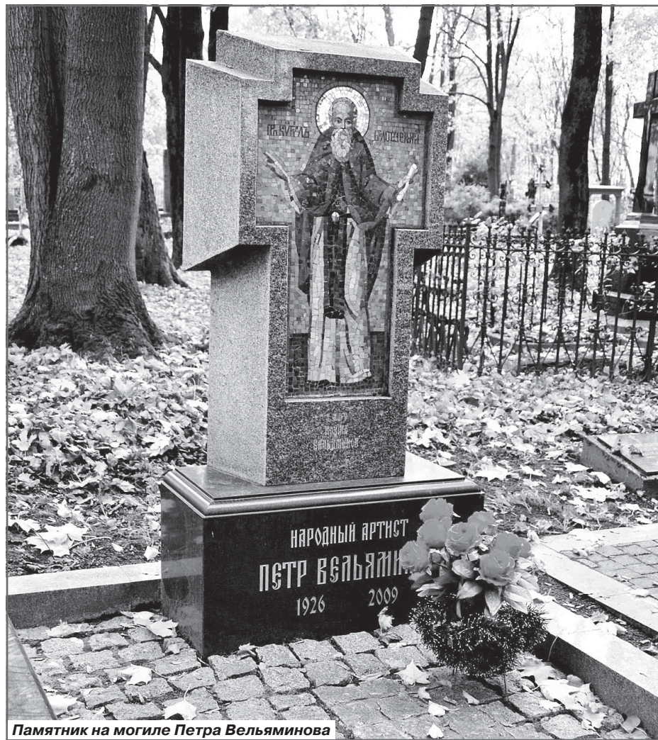
Памятник на могиле Петра Вельяминова