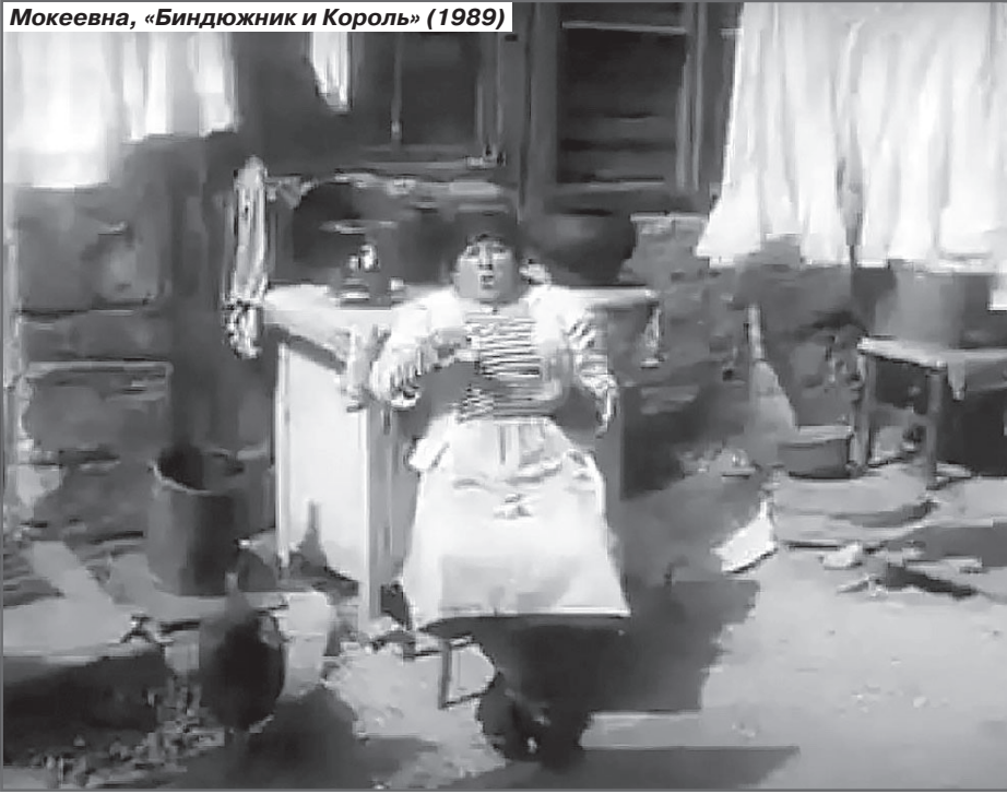
Мокеевна, «Биндюжник и Король» (1989)