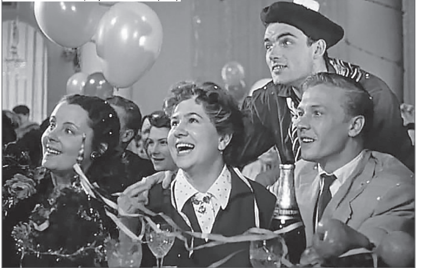
Гостя в зелёном платье, «Карнавальная ночь» (1956)

Основное действие фильма происходит в южном городе, где снимается салонный фильм-мелодрама под названием