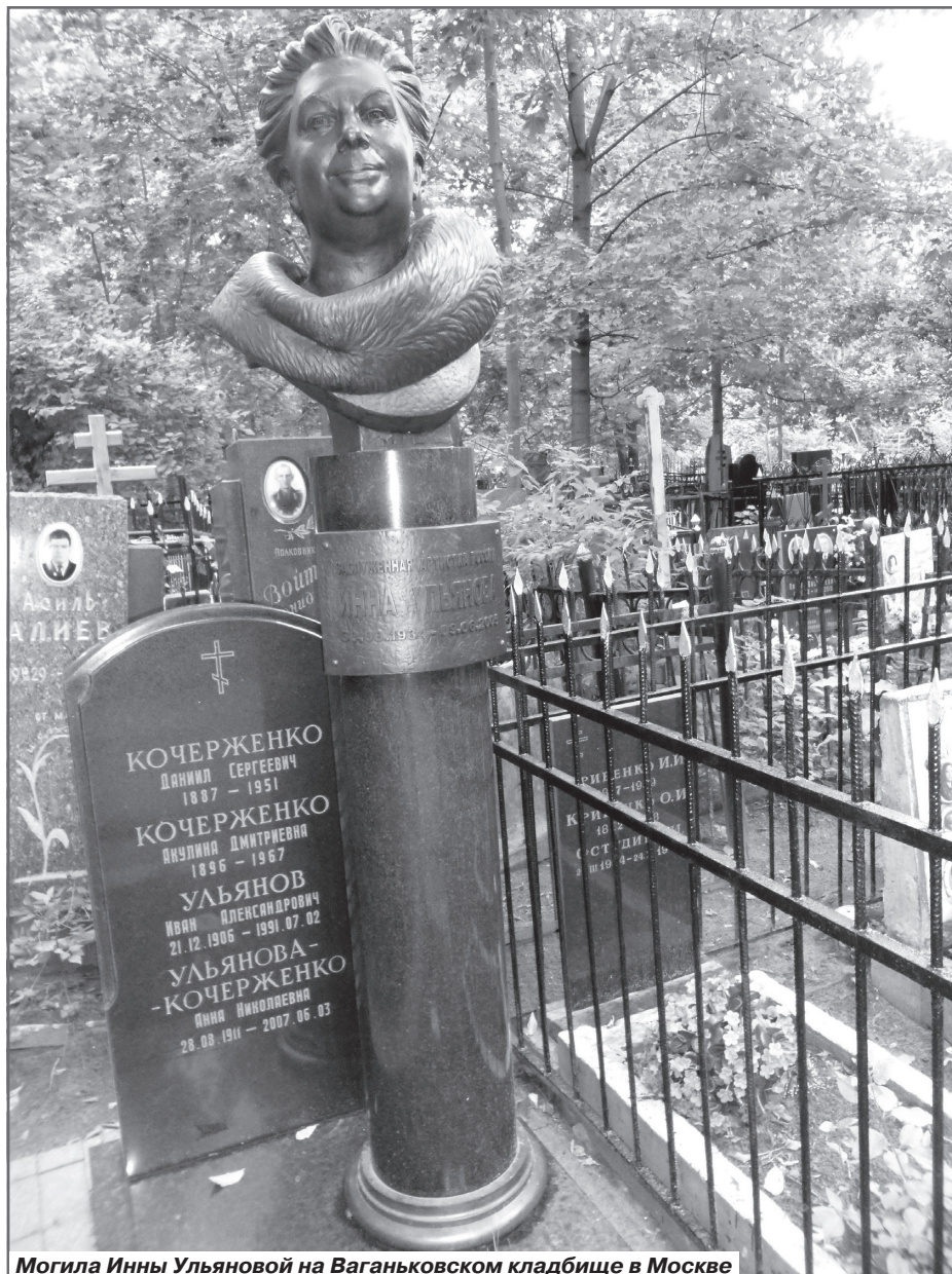
Могилы Инны Ульяновой на Ваганьковском кладбище в Москве