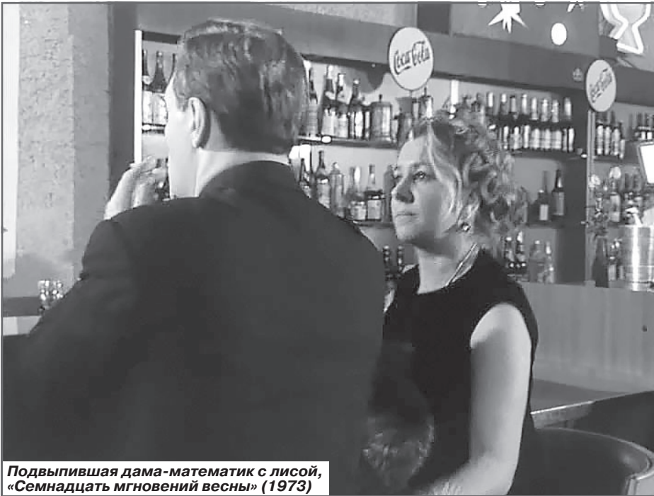
Подвыпившая дама-математик с лисой, «Семнадцать мгновений весны» (1973)