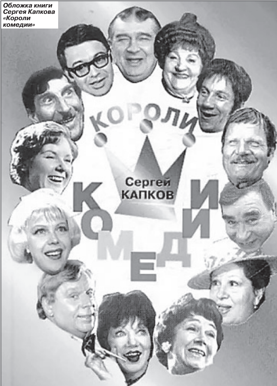
Обложка книги Сергея Капкова «Короли комедии»