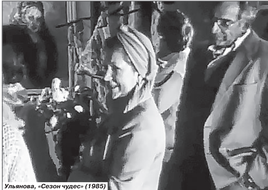
Ульянова, «Сезон чудес» (1985)

Маргарита, обращаясь ко Льву Хоботову: Хоботов, это мелко! От тебя один дискомфорт!