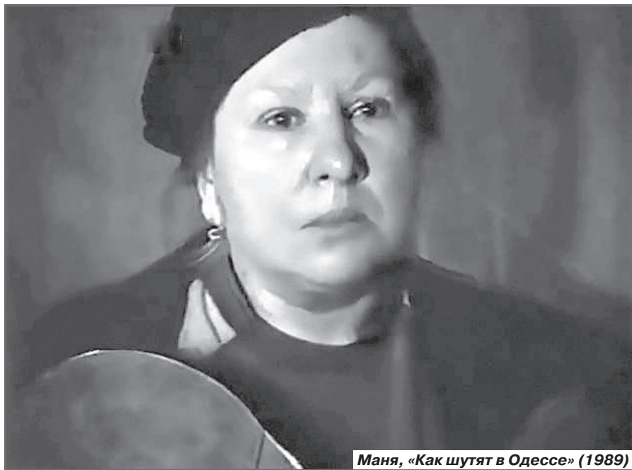
Маня, «Как шутят в Одессе» (1989)