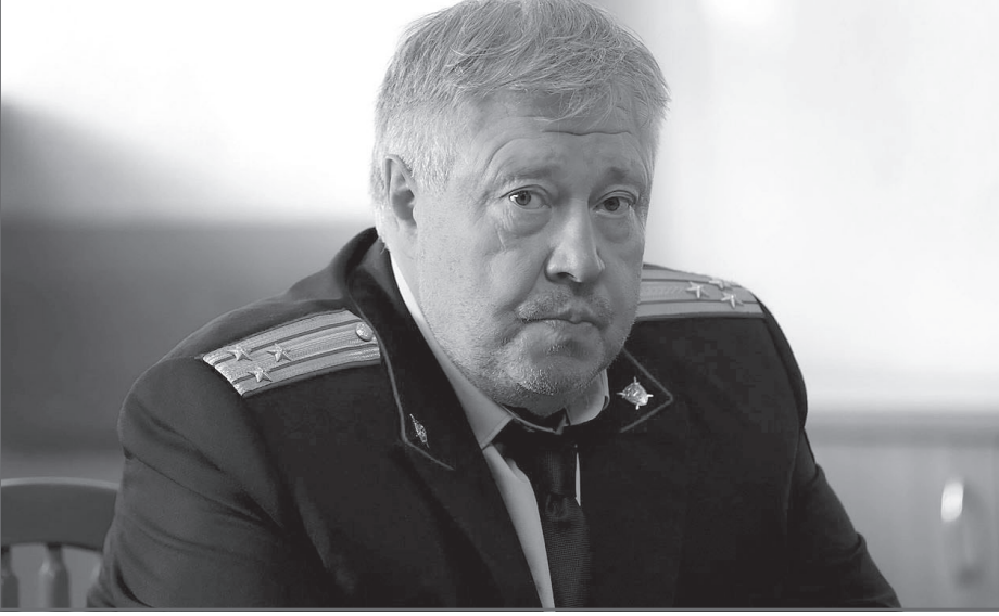
В фильме «Медиум»