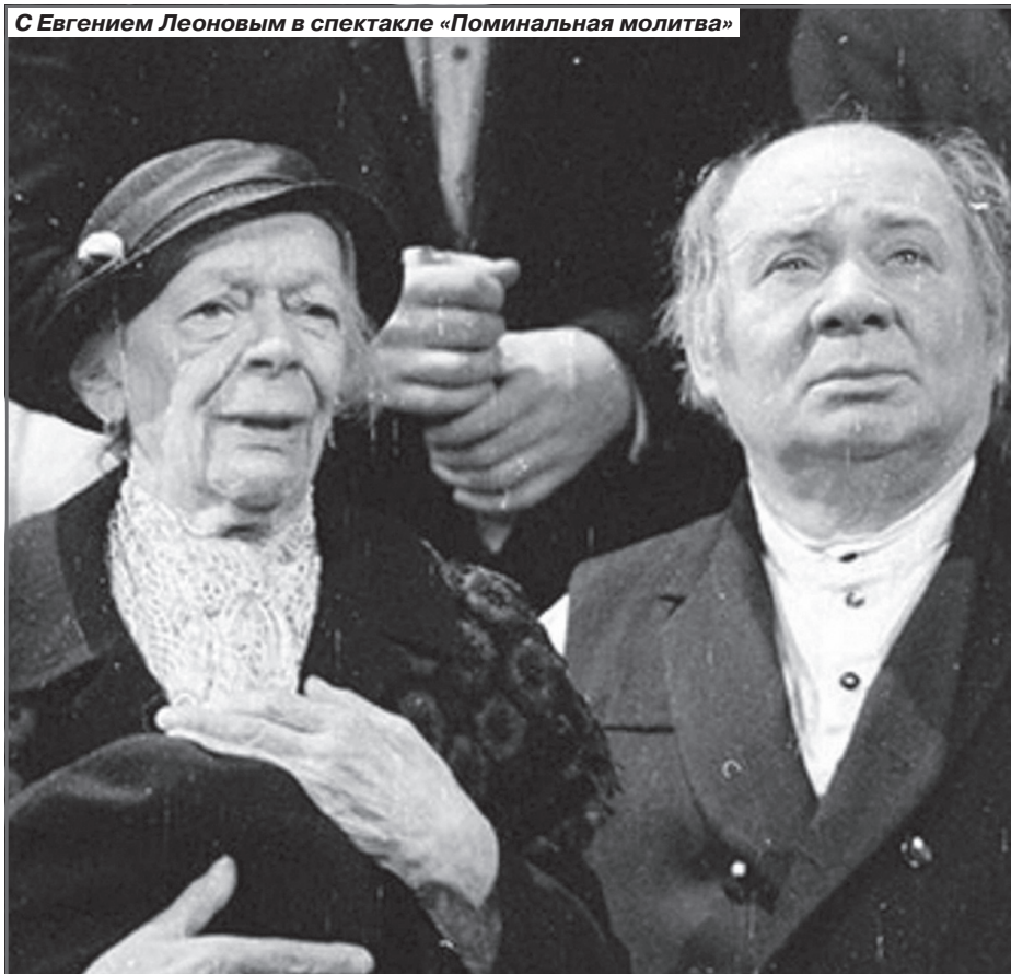
С Евгением Леоновым в спектакле «Поминальная молитва»