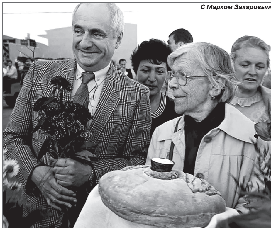
С Марком Захаровым

Я очень любила наблюдать, как она работает: сначала приходила на репетиции