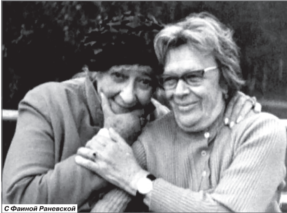
С Фаиной Раневской

- Мой костюм называется «Урожайный», и я прямоиком с сельскохозяйственной выставки!