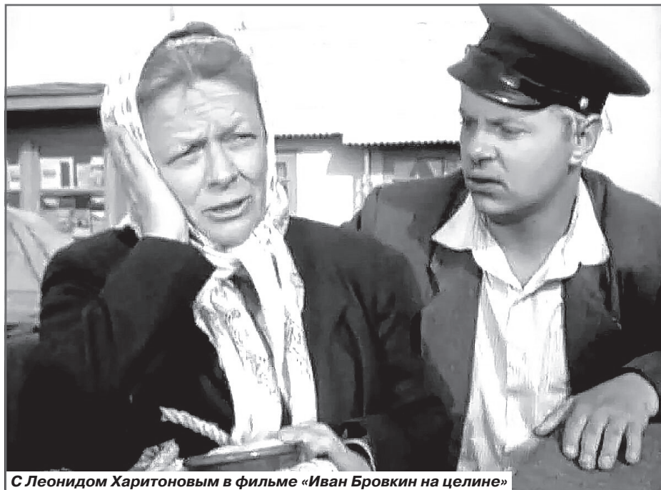
С Леонидом Харитоновым в фильме «Иван Бровкин на целине»