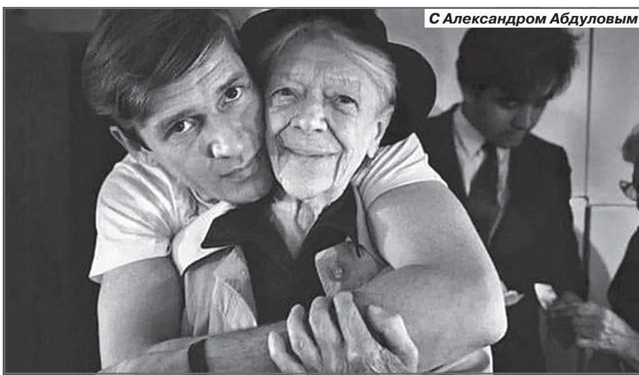
С Александром Абдуловым