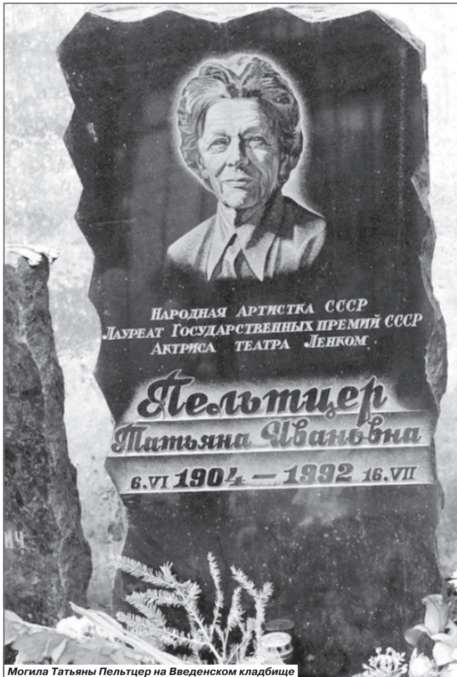
Могила Татьяны Пельтцер на Введенском кладбище

Помню, как мы праздновали 70-летний юбилей Пельтцер: на вечер был запланирован спектакль с ее участием, потом должны были Татьяну Ивановну чествовать, а поздно вечером всей труппой собиравались идти в ресторан.