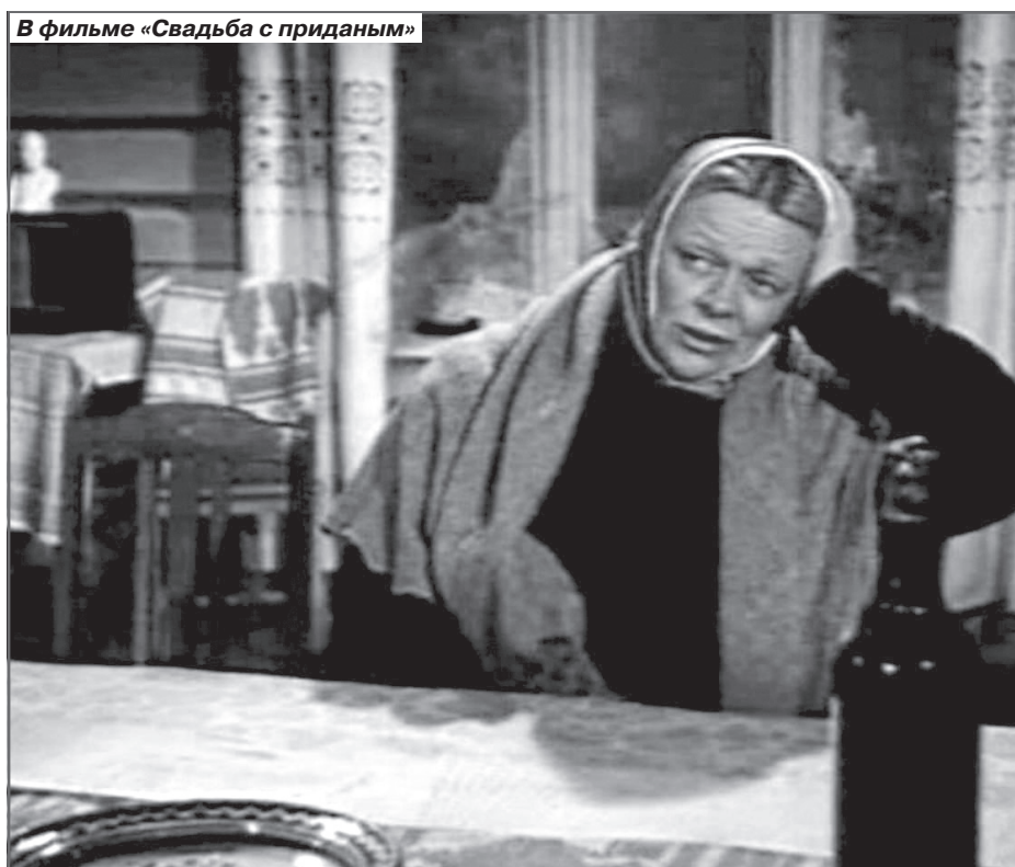
В фильме «Свадьба с приданым»

родившегося в семье мальчика Андрюшу она называла своим сыном.