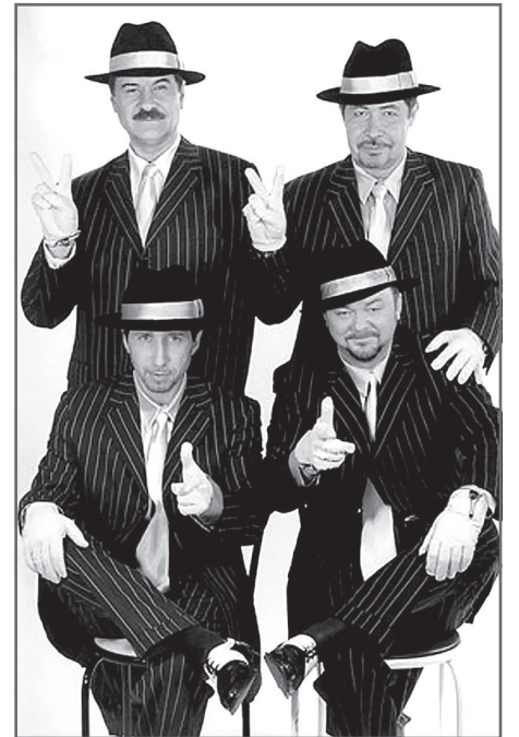
Группа «Доктор Ватсон»

- Точно. И многие отказывались. Но многие и согласились. Ведь дело