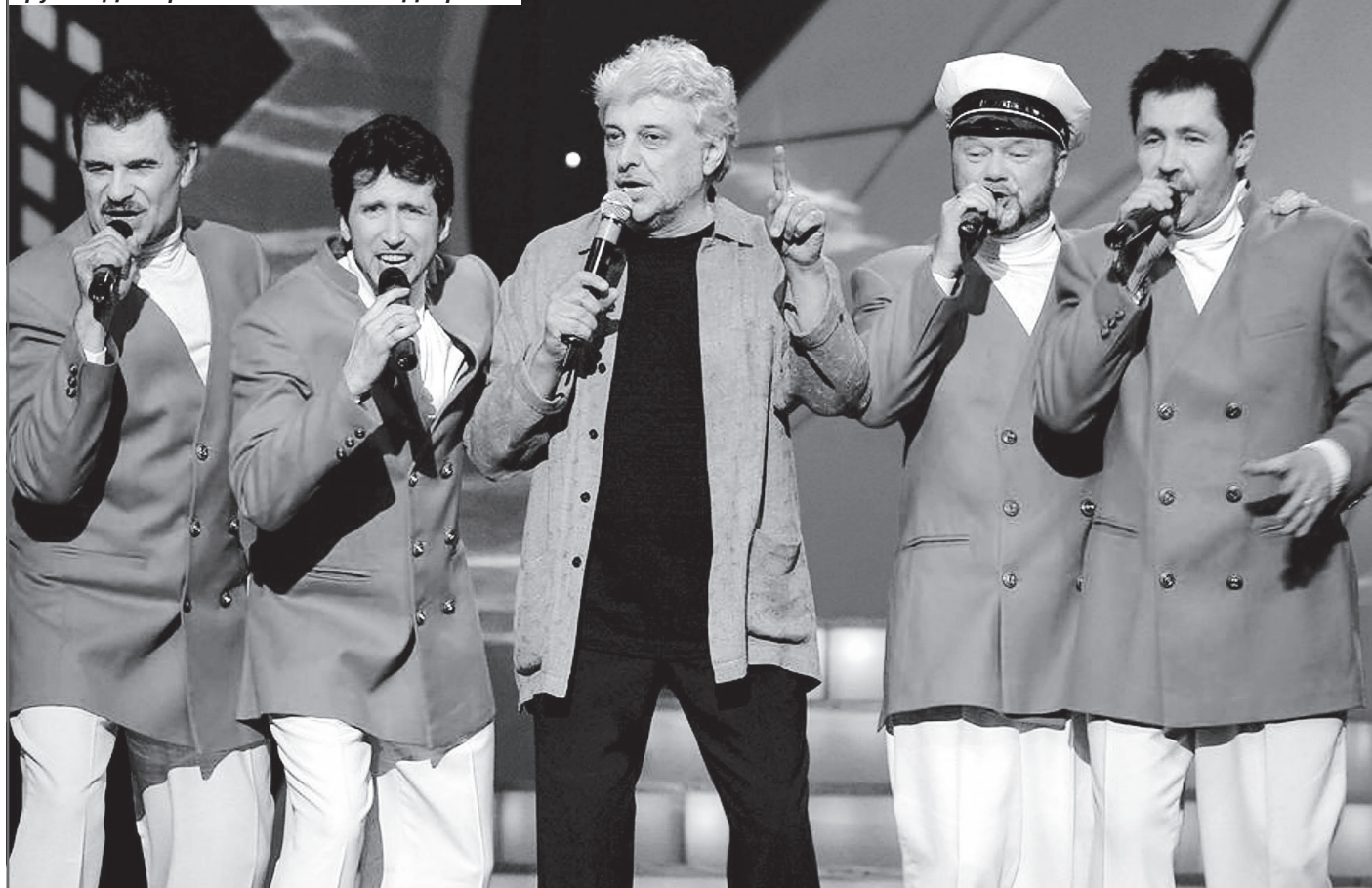
Группа «Доктор Ватсон» и Вячеслав Добрынин