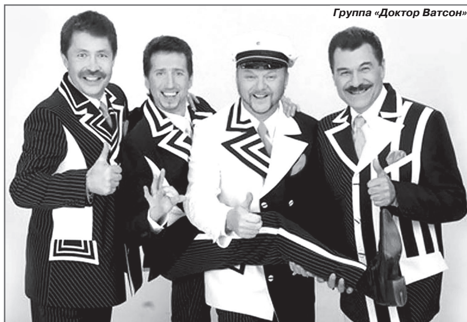
Группа «Доктор Ватсон»