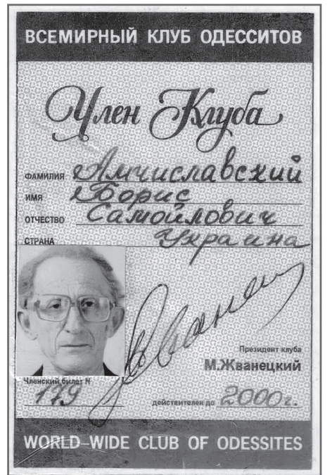
Членский билет Всемирного клуба одесситов