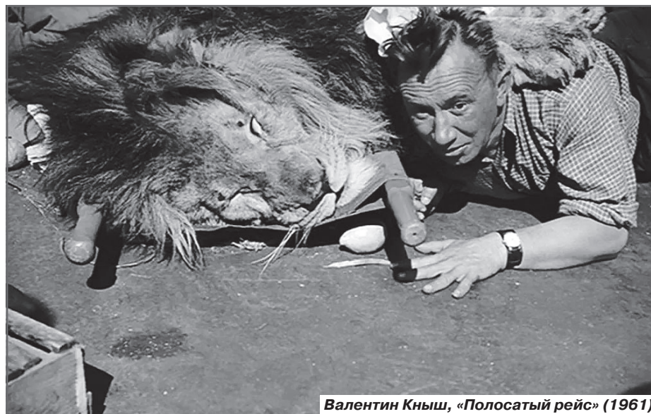
Валентин Кныш, «Полосатый рейс» (1961)