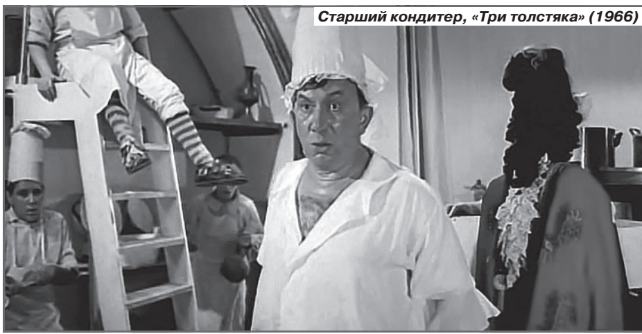
Старший кондитер, «Три толстяка» (1966)