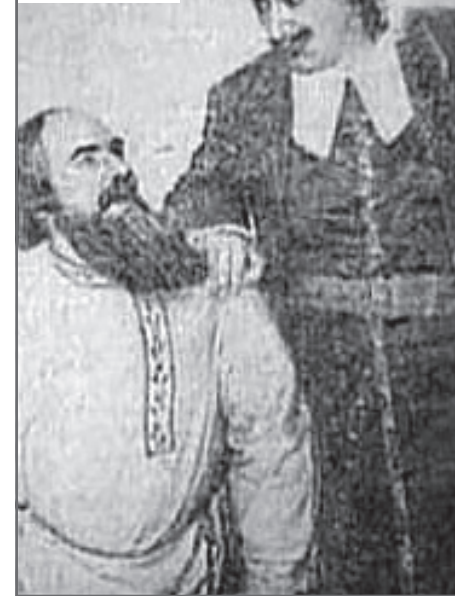
Петр Первый (справа), пьеса-сказка «Табачный капитан»

Будучи неизвестным, актер жил бедно: не было каких-либо значимых ролей в театре, к тому же он ухаживал за боль-