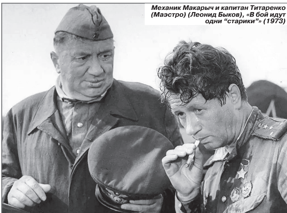
Механик Макарыч и капитан Титаренко (Маэстро) (Леонид Быков), «В бой идут одни «старики»» (1973)