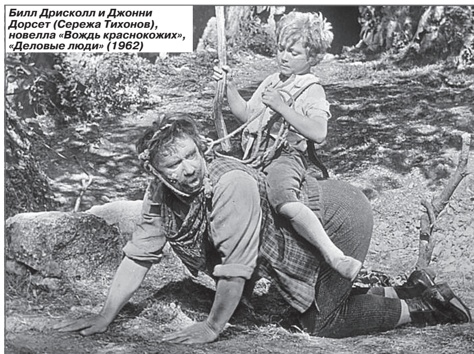
Билл Дрисколл и Джонни Дорсет (Сергея Тихонова), новелла «Вождь краснокожих», «Деловые люди» (1962)

сам придумал ряд опасных эпизодов: в частности, эпизод с радиорубкой, где он держится за хвост тигра; ради этого эпизода Смирнов месяц ходил вокруг клеток, подкармливая животных и завоевывая их расположение.