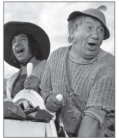
Грустный разбойник (Фрунзик Мкртчян) и Веселый разбойник, «Айболит-66» (1966)

Фильм посвящен подвигу советских разведчиков, действующих в оккупированной Одессе в годы Великой Отечественной войны. В основе повести и фильма лежат реальные события.