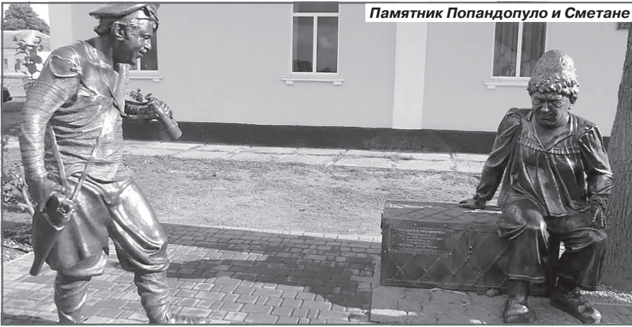
Памятник Попандопуло и Сметане