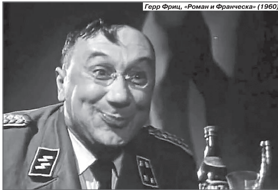
Герр Фриц, «Роман и Франческа» (1960)