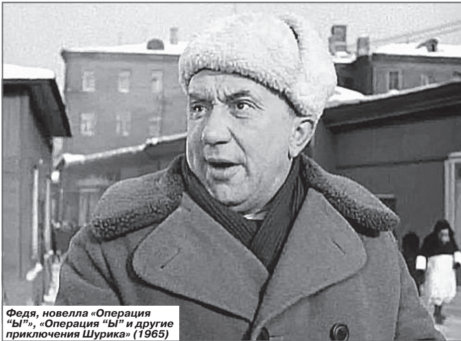
Федя, новелла «Операция «Ы»», «Операция «Ы» и другие приключения Шурика» (1965)