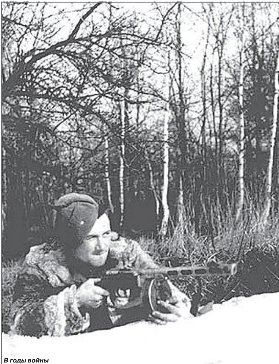
В годы войны