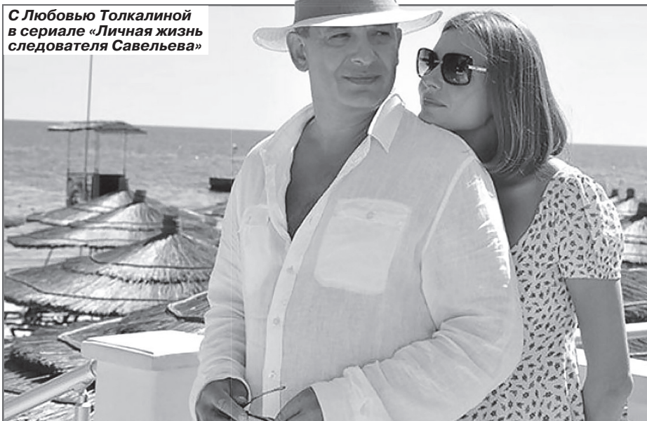
С Любовью Толкалиной в сериале «Личная жизнь следователя Савельева»

му сочувствуешь и понимаешь мотивацию его поступков! Ты играешь в спектакле по пьесе современного французского драматурга Бернара Вербера «Наши друзья человеки». Кто был инициатором того, что роль Рауля поручат именно тебе?