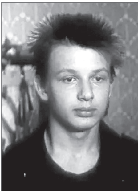
В фильме «Дорогая Елена Сергеевна»

Дима Марьянов вытащил «счастливый билет» в ранней юности: уже в 14 лет он снялся в фильме «Выше радуги». Правда, его роль озвучивал Дима Харатьян, а пел - Володя Пресняков, но это не помешало Марьянову впоследствии стать профессиональным артистом. Интересно, что в своё время аналогичная история произошла и с Натальей Варлей: в фильме «Кавказская пленница» роль Нины озвучивала Надежда Румянцева, а за «спортсменку, комсомолку и просто красавицу» пела Аида Ведущева.