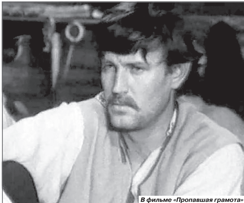
В фильме «Пропавшая грамота»

вей. Жили трудно, голодно, да ещё под немецкими оккупантами - самая яркая картинка из детства Толи была совсем безрадостной: