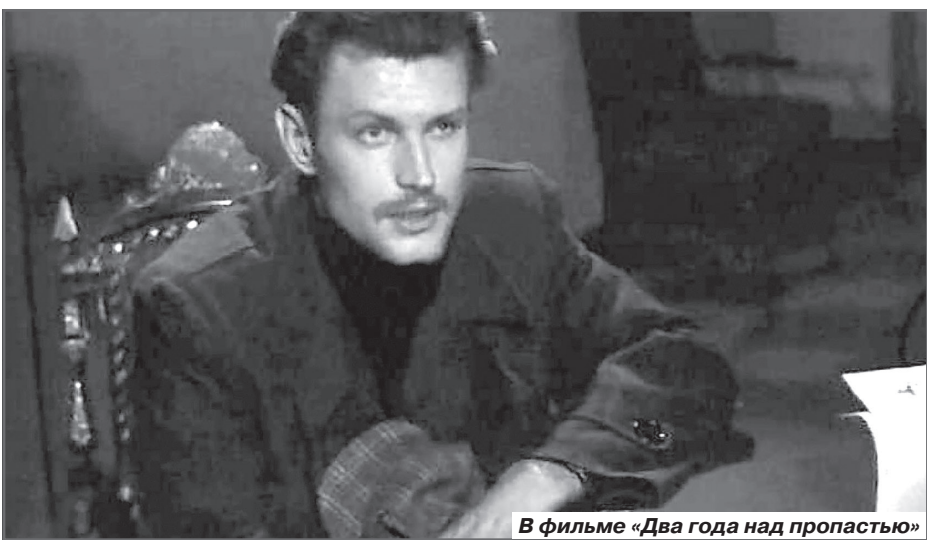
В фильме «Два года над пропастью»

Они оказались правы и в то же время ошиблись: Барчук оказался актером универсальным, которому, казалось бы, под силу справиться с любым образом.