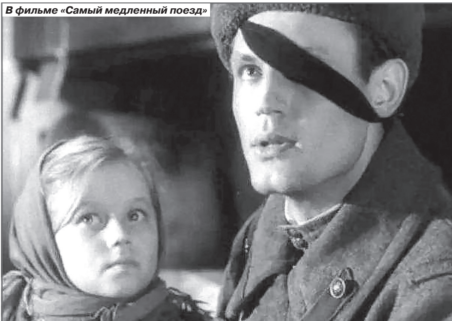
В фильме «Самый медленный поезд»