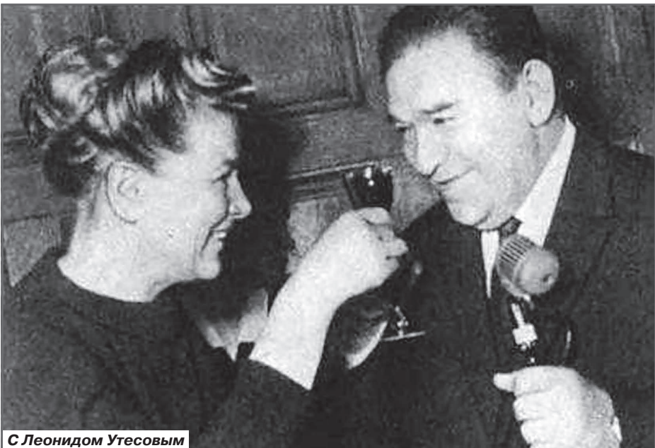
С Леонидом Утесовым