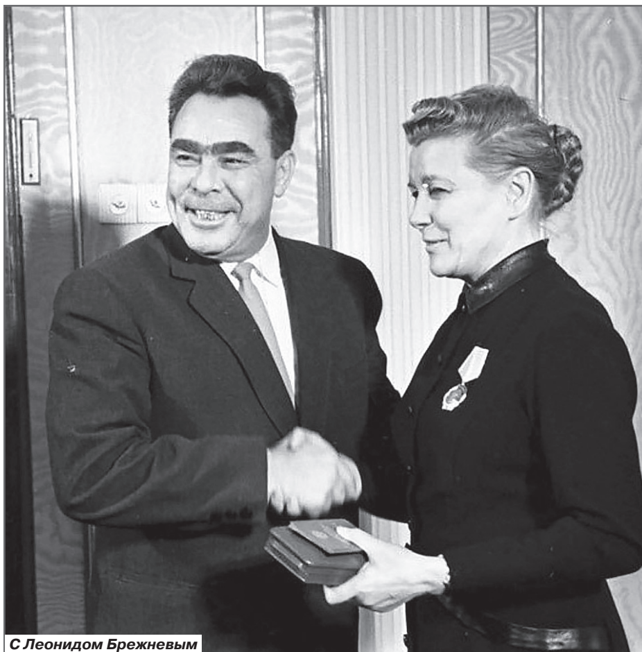
С Леонидом Брежневым