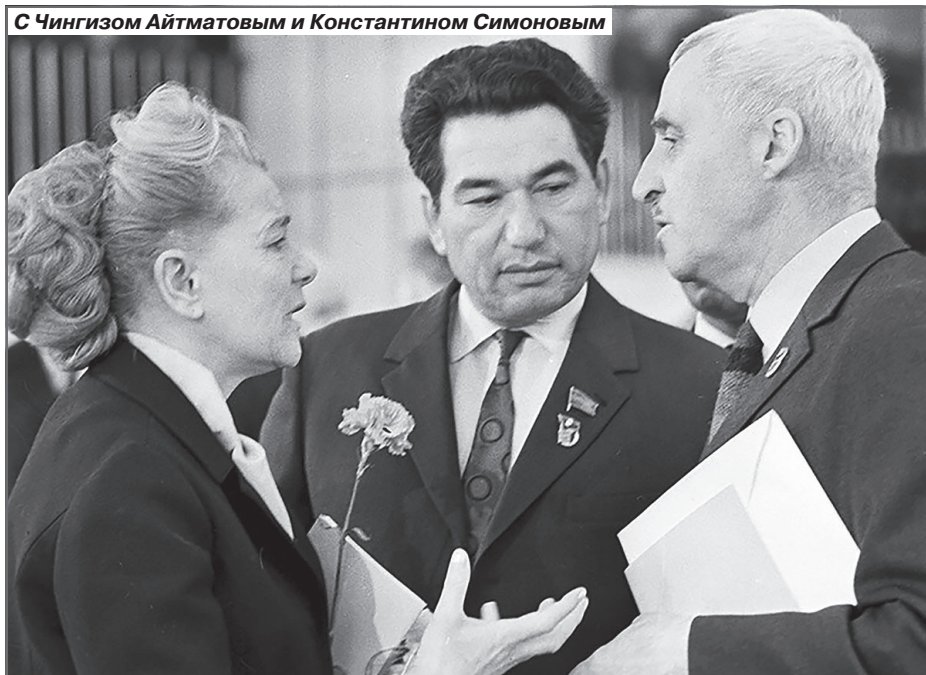
С Чингизом Айтматовым и Константином Симоновым