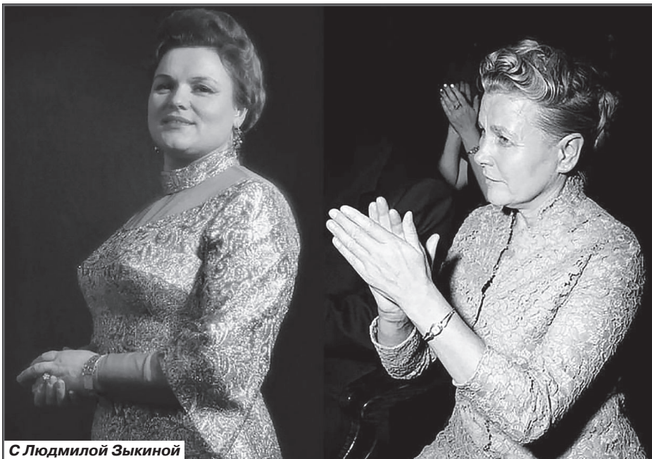
С Людмилой Зыкиной