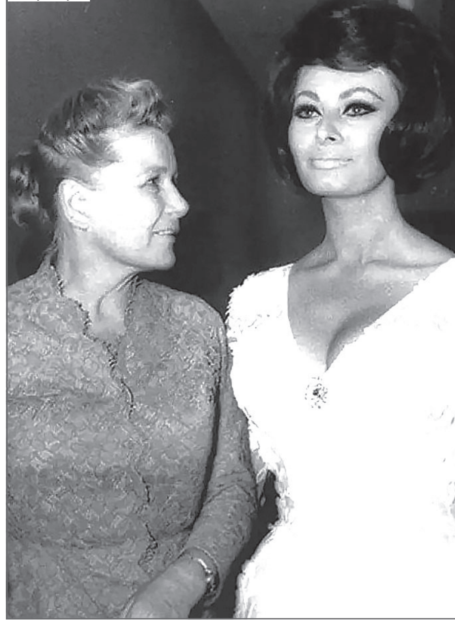
С Софи Лорен

режиссеру или артисту. А за «ошибки» отвечать ей.