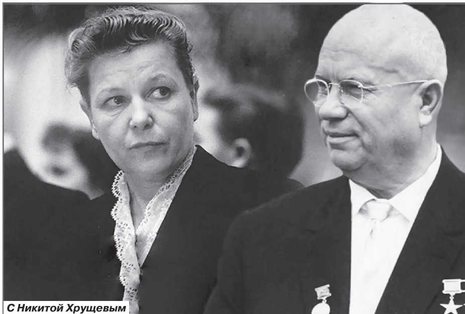
С Никитой Хрущевым