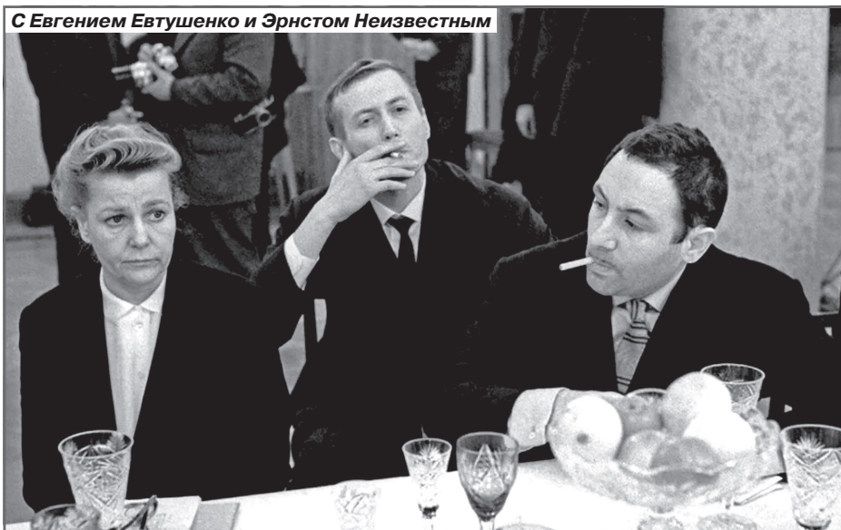
С Евгением Евтушенко и Эрнстом Неизвестным