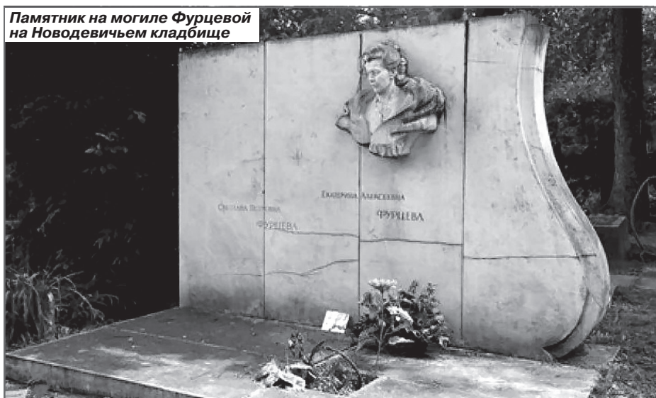
Памятник на могиле Фурцевой на Новодевичьем кладбище

Ни по возрасту, ни по настроению она вовсе не собиралась уходить. Наверное, даже представить не могла себя на пенсионном покое. Но, похоже, ее министерские дни были сочны. И рассчитывать на милосердие товарищей по партии ей не приходилось. В политическом мире нет настоящих человеческих отношений, здесь идет беспощадная борьба за власть или за иллюзию власти.