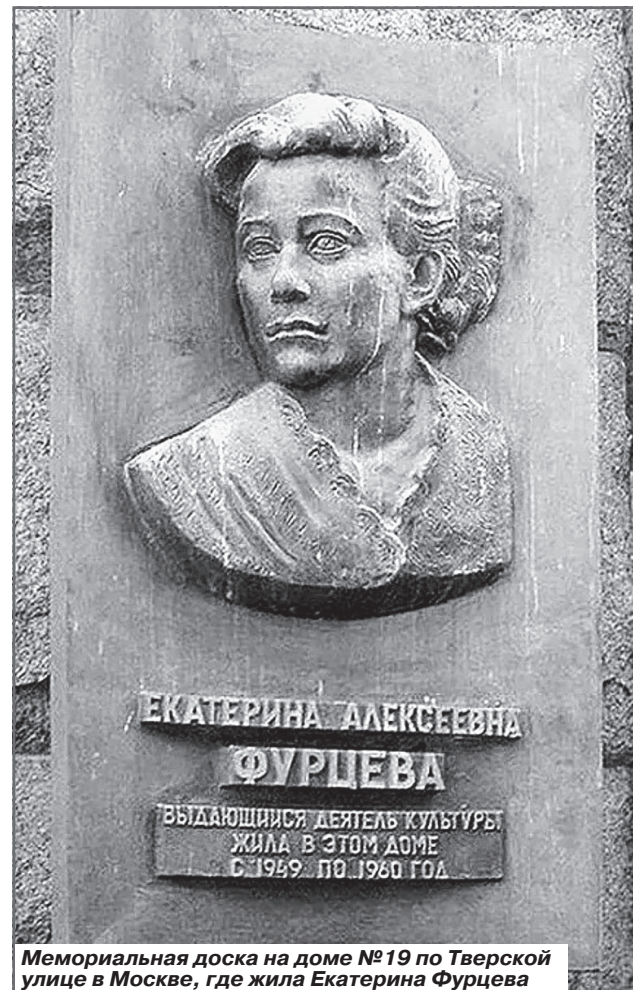
Мемориальная доска на доме №19 по Тверской улице в Москве, где жила Екатерина Фурцева