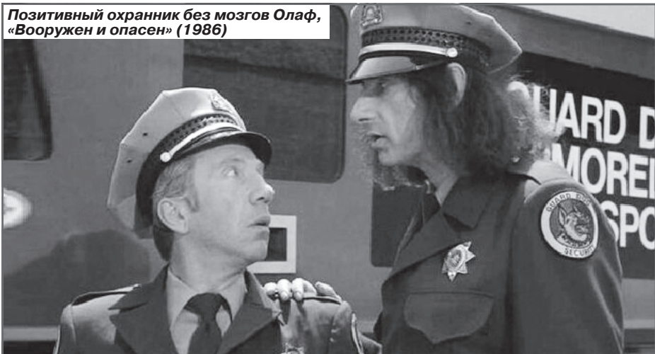
Позитивный охранник без мозгов Олаф, «Вооружен и опасен» (1986)