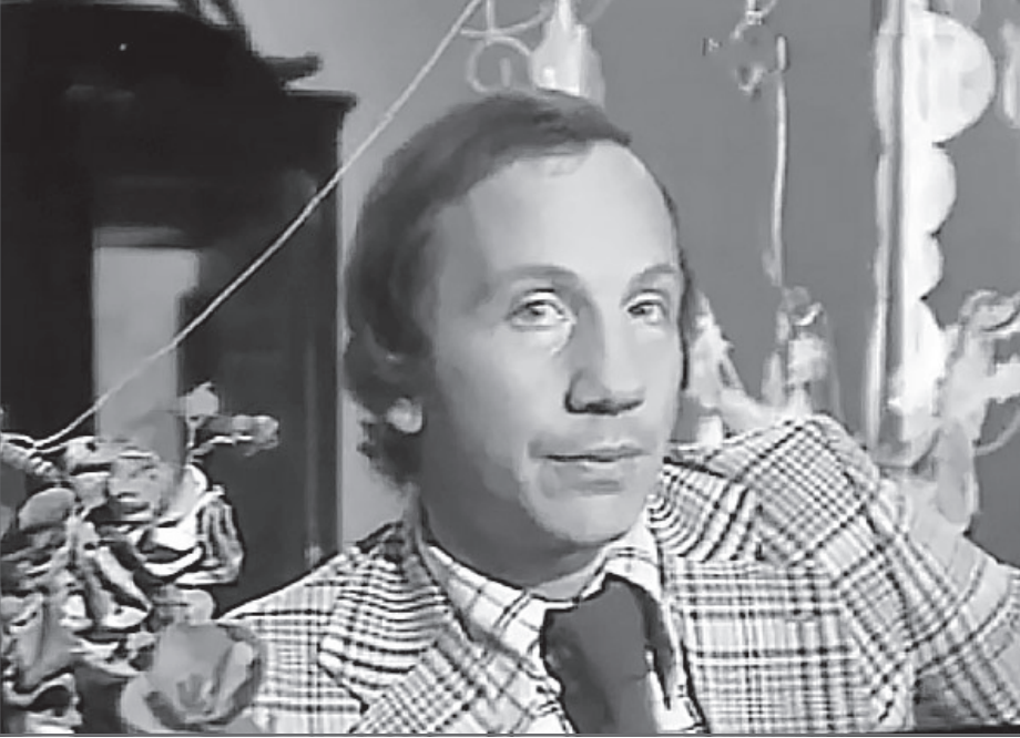
Савелий Крамаров, «Бенефис Савелия Крамарова» (1974)