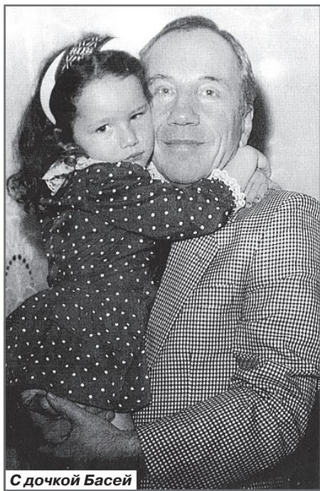
С дочкой Басей