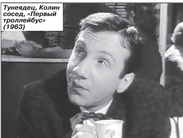
Туняец, Колин сосед, «Первый троллейбус» (1963)