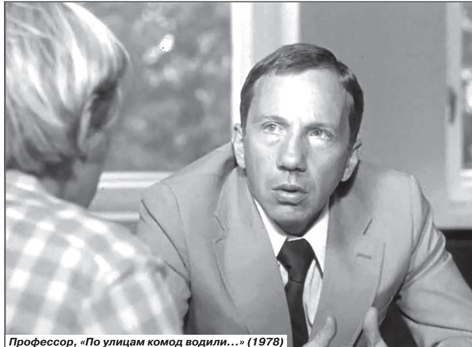
Профессор, «По улицам комод водили...» (1978)

В четвертой новелле «Ограбление... по-советски» образ милиционера - ре-