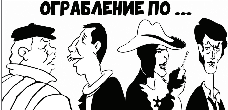
Заставка к мультифильму «Ограбление по...» (1978). Крамаров второй слева

И хотя голливудский дебют можно считать удачным, все-таки Савелий испытывал проблемы со знанием языка. Ведь чтобы сделать в Голливуде по-настоящему значимую карьеру, требовалось знание английского.