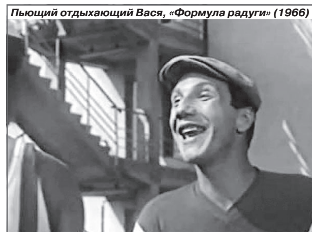
Пьющий отдыхающий Вася, «Формула радуги» (1966)

*** В отечественном кино Савелий Крамаров стал настоящей звездой. Дурашливая внешность и помогала, и мешала. Стоило появиться на экране его физиономии - и зритель готов был смеяться.