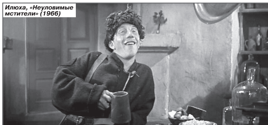
Илюха, «Неуловимые мстители» (1966)