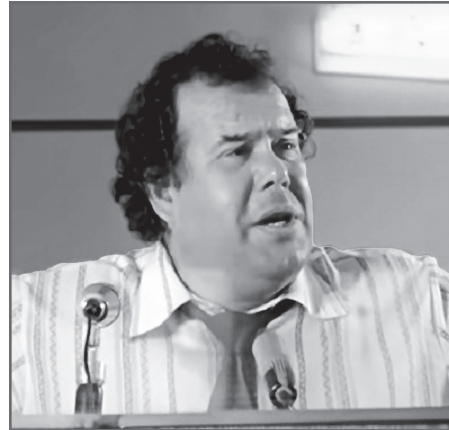
В фильме «Роковые яйца»