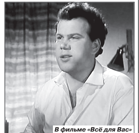
В фильме «Всё для Вас»

Мать актера умерла в 1993 году. Он пере-