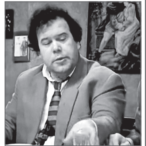
В фильме «Не может быть!»