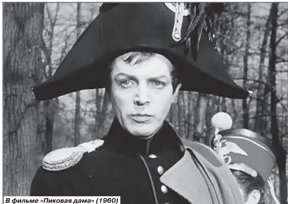
В фильме «Пиковая дама» (1960)

- Отец был профессиональным военным с 15 лет. Выпускник Петербургской Николаевской кавалерийской школы -