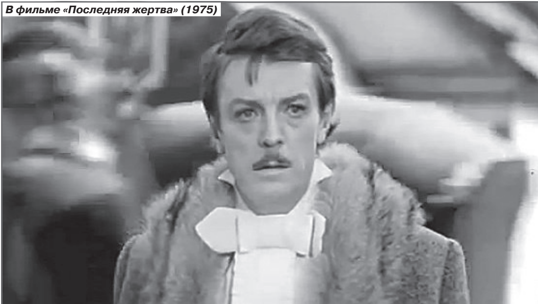
В фильме «Последняя жертва» (1975)