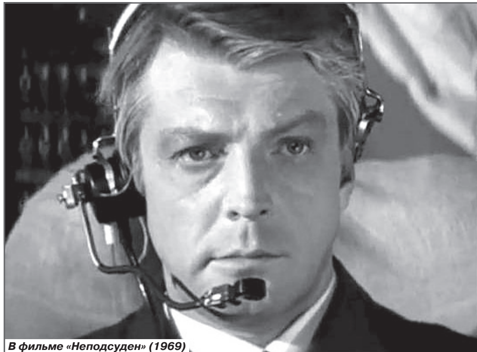
В фильме «Неподсуден» (1969)