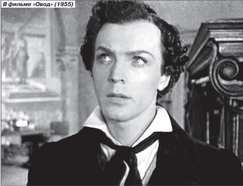
В фильме «Овод» (1955)

На Крымском Валу в мои мальчишеские годы стоял громадный деревянный стадион. Сколько мы на том стадионе пропадали, болея за наш «Спартак»