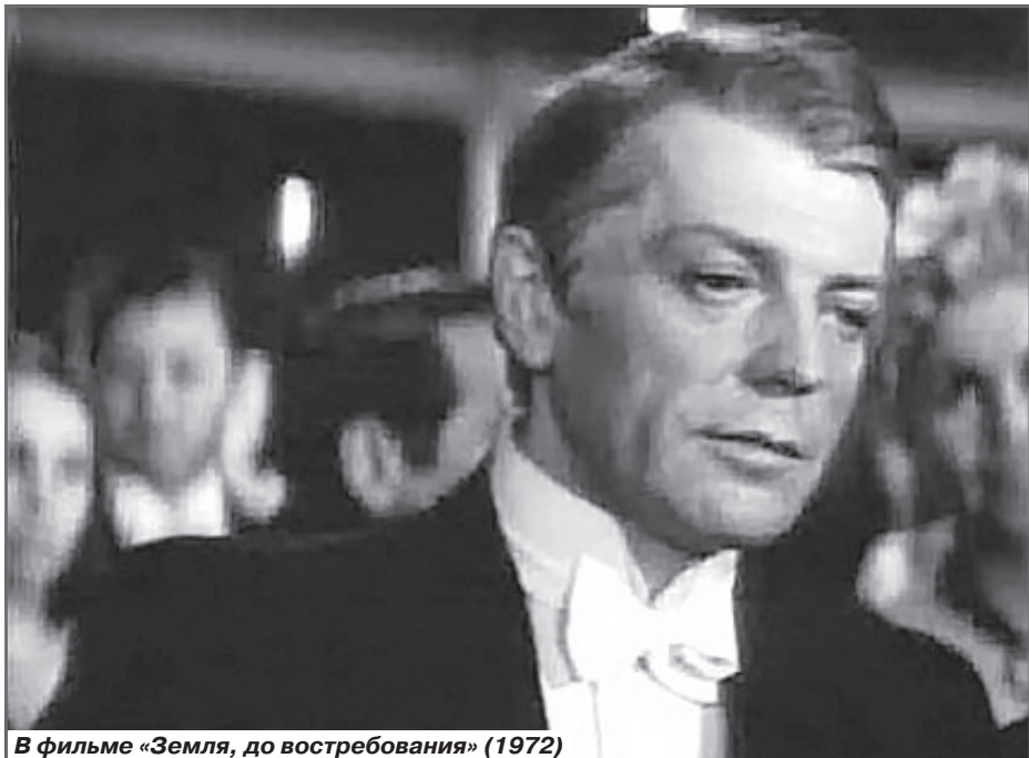
В фильме «Земля, до востребования» (1972)

- В 1988-ом и вернули. Так что если и был приказ, запрещающий меня снимать, то негласный. Поэтому, если внимательно посмотреть мою фильмографию того периода, то видно, что режиссёры снимали меня активно и охотно.