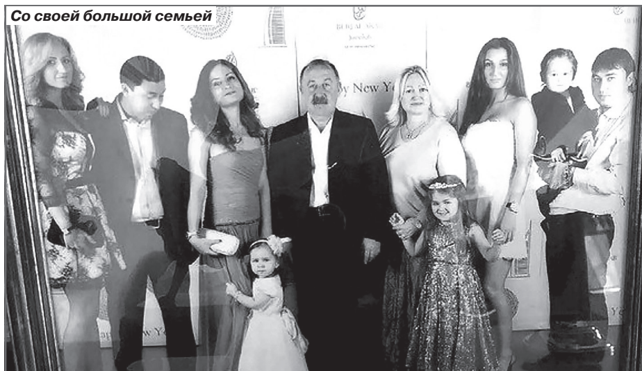
Со своей большой семьей