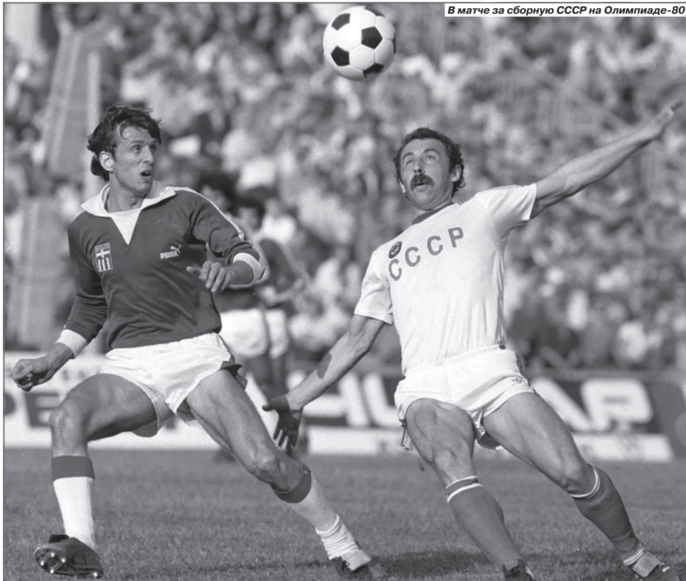
В матче за сборную СССР на Олимпиаде-80

Это был удар по команде. За два-три дня до начала чемпионата, на собрании тогдашний председатель Центрального совета «Динамо» объявил о том, что