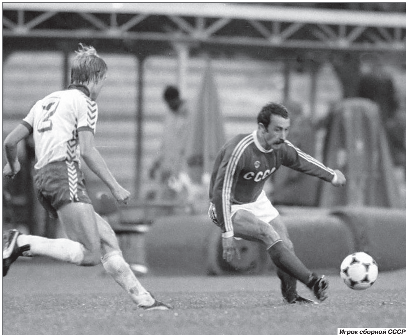
Игрок сборной СССР

- Вспомни выступление за олимпийскую сборную.