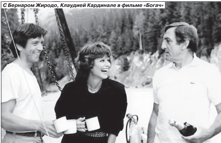
С Бернаром Жиродо, Клаудией Кардинале в фильме «Богач»