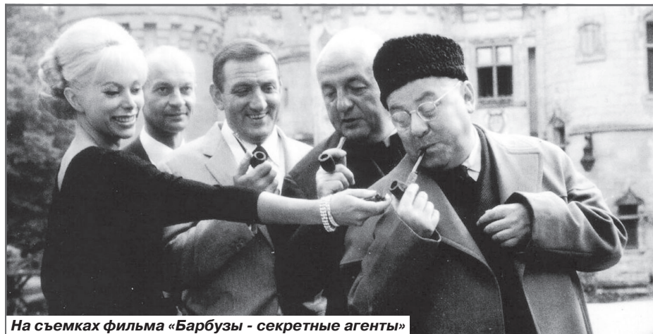
На съемках фильма «Барбузы - секретные агенты»