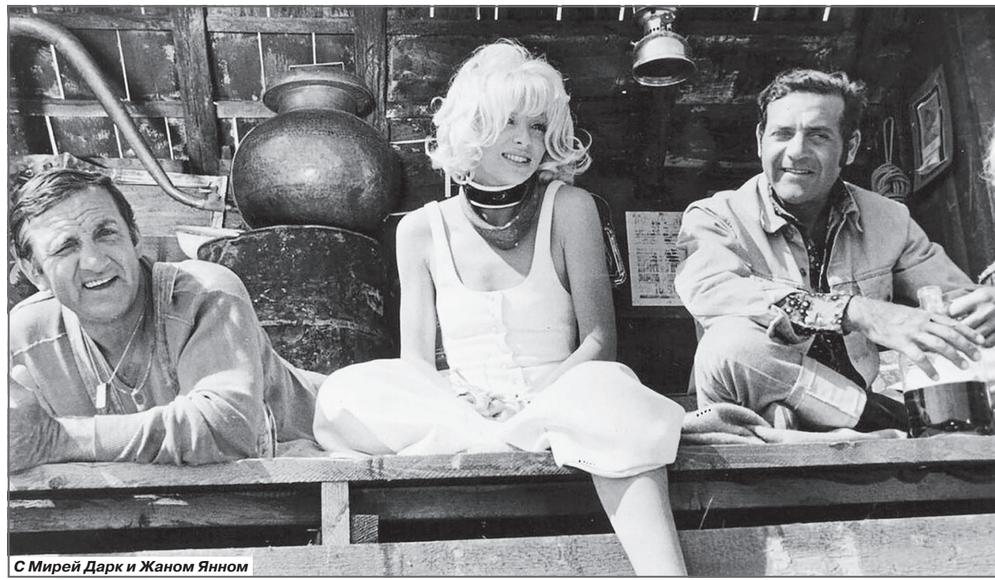
С Мирей Дарк и Жаном Янном

А те, кто хочет подробностей жизни артиста, пусть лезут в Интернет.