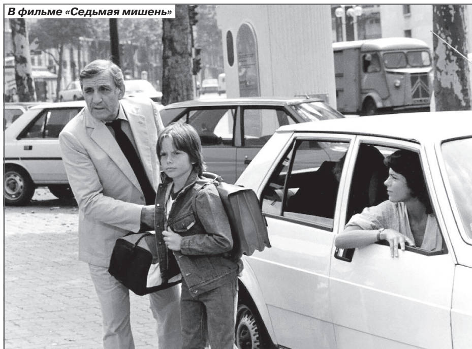
В фильме «Седьмая мишень»