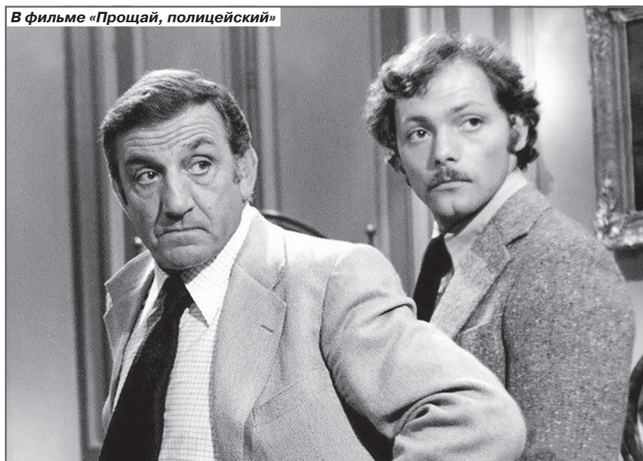
В фильме «Прощай, полицейский»