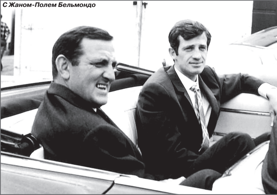
С Жаном-Полем Бельмондо