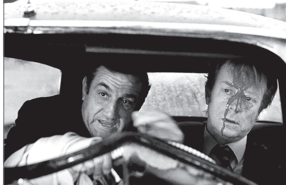
В фильме «Молчаливый»

В «Зануде» Вентура сыграл героя, в чью шкуру через несколько лет влезет Жерар Депардьё, когда объединится с Пьером Ришаром - традиционным исполнителем роли французского Иванушки-дурачка - Франсуа Пиньона (Перрена). В «Зануде» в роли Пиньона друг Лино - Жак Брель, и его персонаж действительно настолько занудлив, что портит весь фильм.