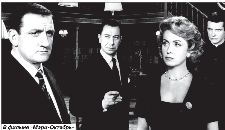
В фильме «Мари-Октябрь»