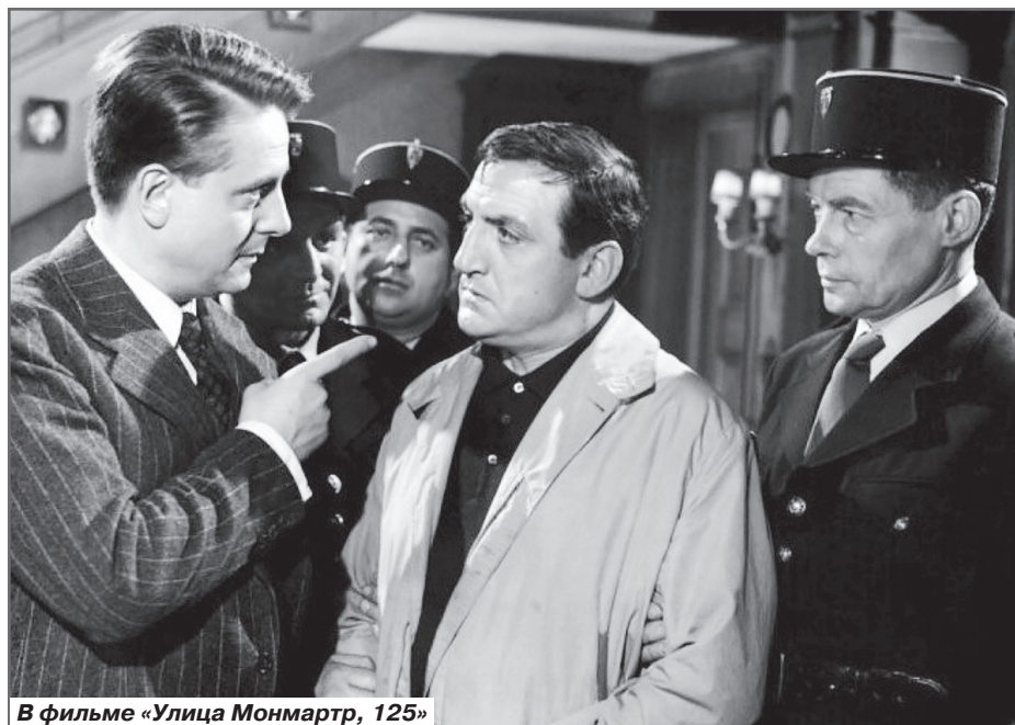
В фильме «Улица Монмартр, 125»

Следующая картина Вентуры - мелодрама Клода Пиното «Пощечина» (1974) вновь стала коммерчески успешной, но мне трудно понять, что французов привлекло в этой картине. По крайней мере, для мужской аудитории в этой истории нет ничего увлекательного: герой Лино весь фильм разбирается со своими женщинами - бывшей женой, подругой и истеричкой дочерью.