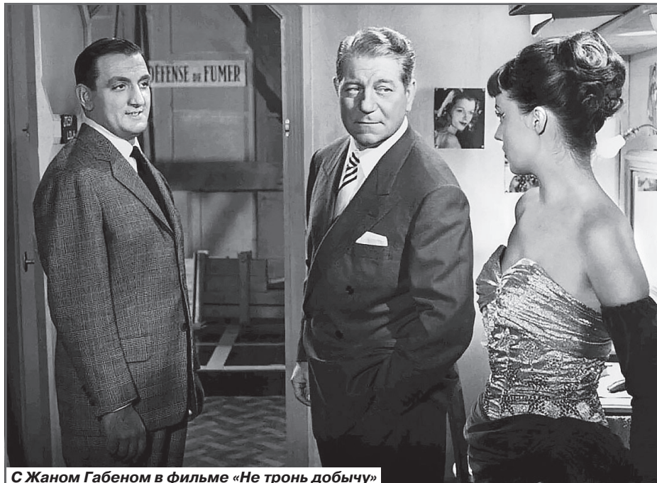
С Жаном Габеном в фильме «Не тронь добычу»

Уже в следующем году вышли 8 картин с участием Вентуры, и почти во всех ему достались главные роли. Роли весьма разнообразные: владельца ресторана - в «Зверь выпущен», бывшего подпольщика - в детективе «Мари-Октябрь»,