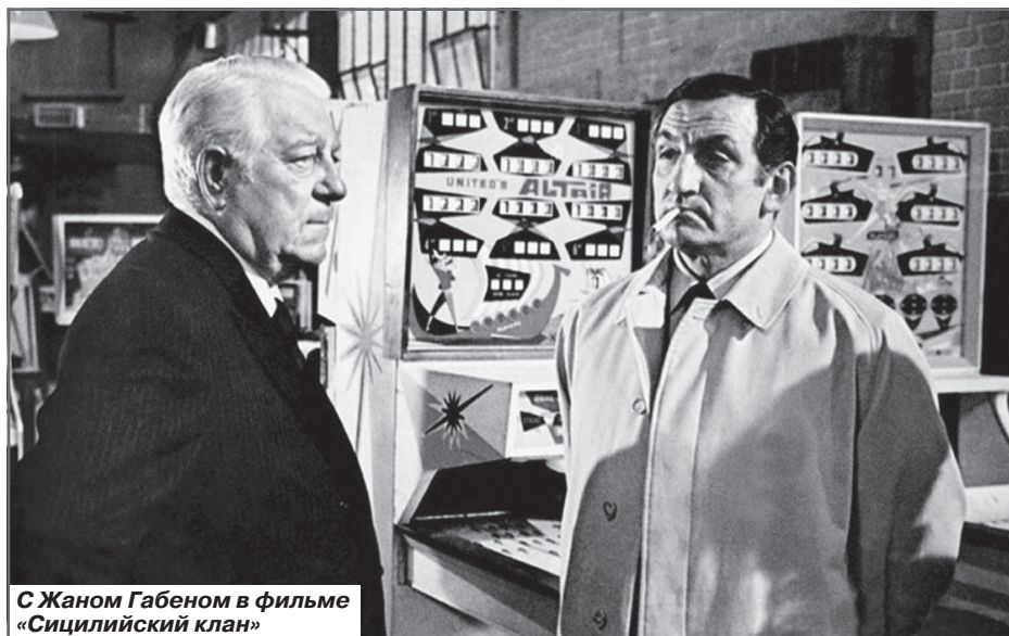
С Жаном Габеном в фильме «Сицилийский клан»