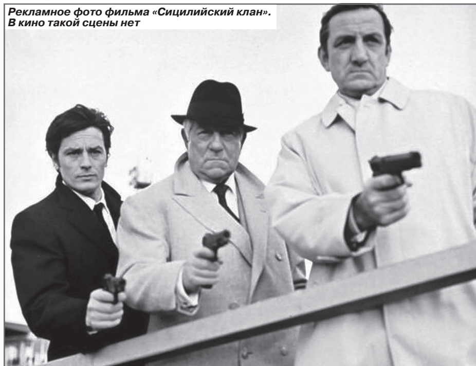
Рекламное фото фильма «Сицилийский клан». В кино такой сцены нет

Он активно снимался во второй половине 50-х, но долгое время не получал главных ролей. Прорыв произошел в фильме «Привет вам от Гориллы» (1958), где Лино сыграл секретного агента. Фильм не стал кассовым рекордсменом, но показал вполне достойный результат в прокате (2,8 млн зрителей). К сожалению, сейчас он безнадежно устарел, как почти все картины родом из 50-х, в которых можно встретить Вентуру.