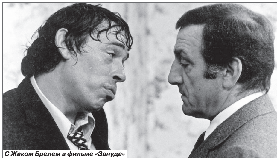
С Жаком Брелем в фильме «Зануда»