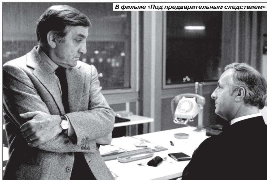
В фильме «Под предварительным следствием»