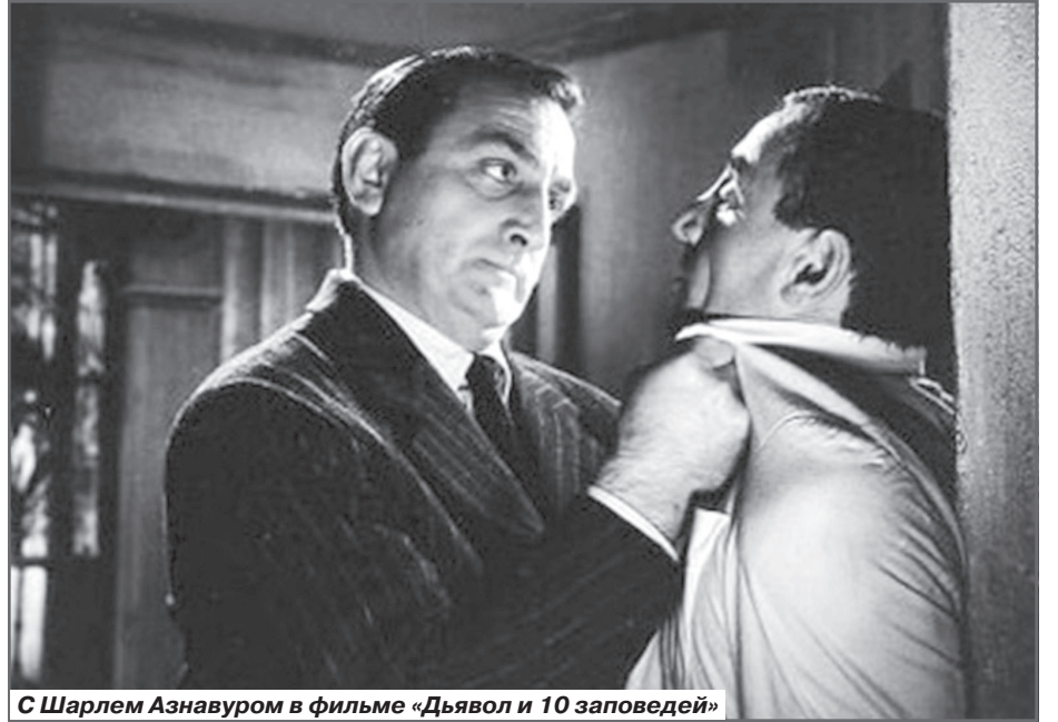
С Шарлем Азнавуром в фильме «Дьявол и 10 заповедей»