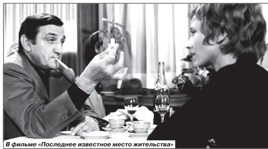
В фильме «Последнее известное место жительства»