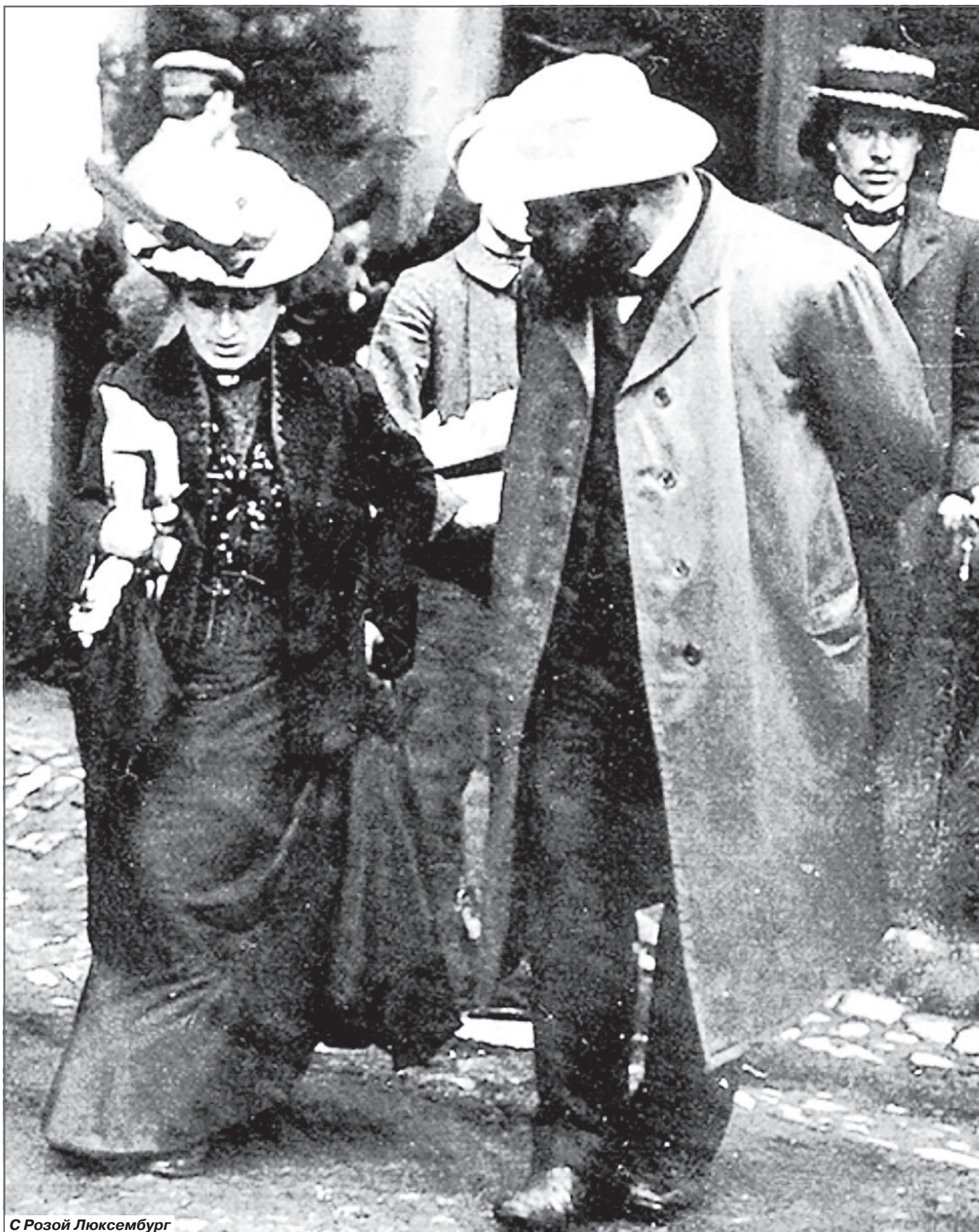
С Розой Люксембург

В любом случае Парвусу удалось стать международным человеком-загадкой еще при жизни и остаться им для нынешних исследователей. Со стопроцентной достоверностью раскрыть все обстоятельства биографии «демона революции» до сих пор не представляется возможным.