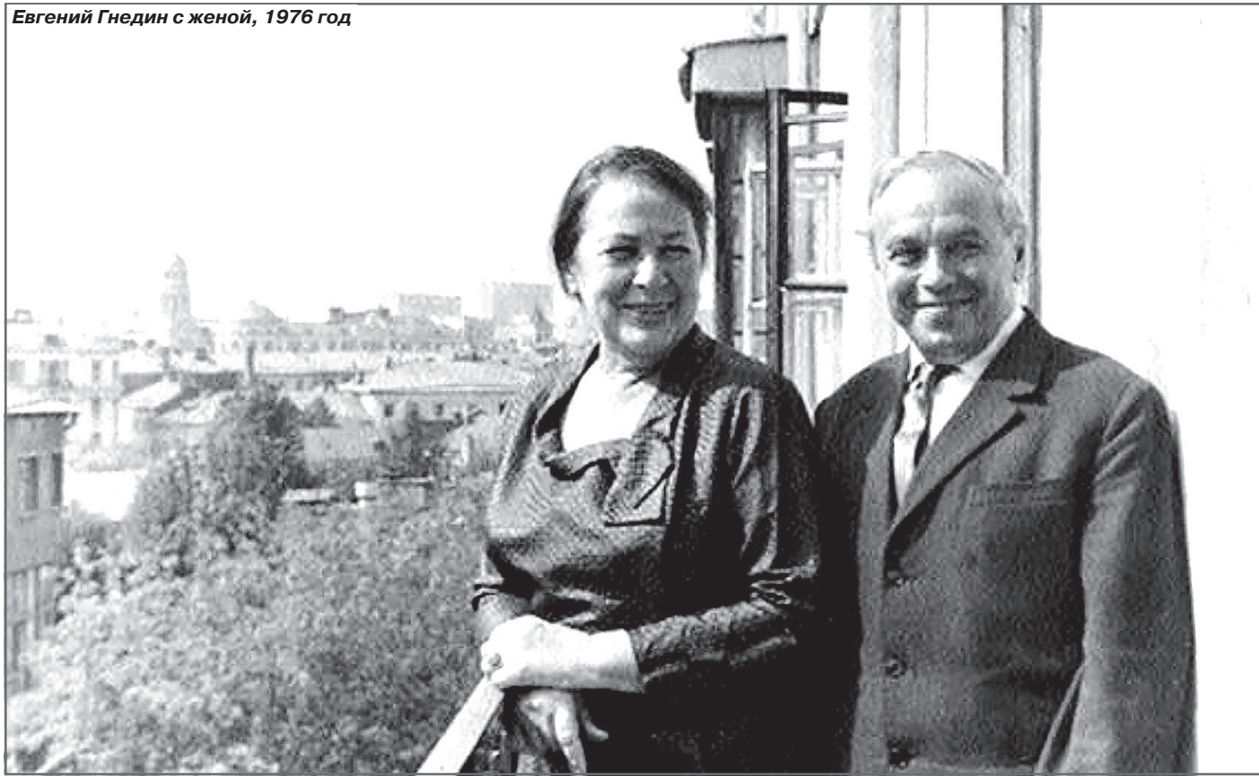
Евгений Гнедин с женой, 1976 год