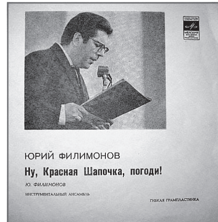
Обложка пластинки «Ну, Красная Шапочка, погоди!»