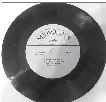
Пластинка «Ну, Красная Шапочка, погоди!»

Много озвучивал мультфильмы. Его голосом говорят герои мультфильмов «Тараканница», «Акционеры», «Кто поедет на выставку?», «Два весёлых гуся», «Рассказы старого моряка. Необычайное путешествие» и других.