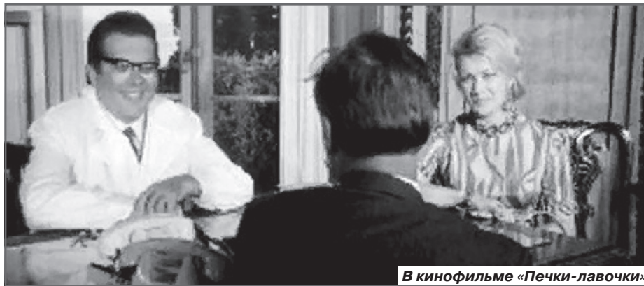
В кинофильме «Печки-лавочки»

Их забывают независимо от уровня таланта, если в биографии нет сексуально-алкогольных скандалов.