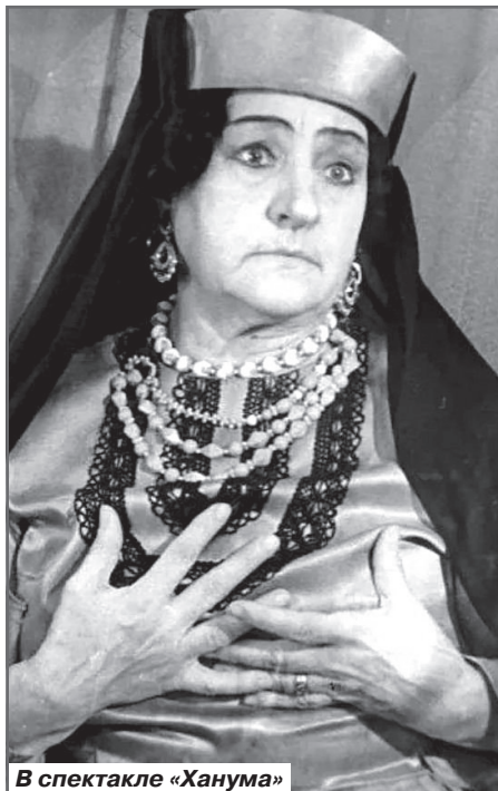
В спектакле «Ханума»