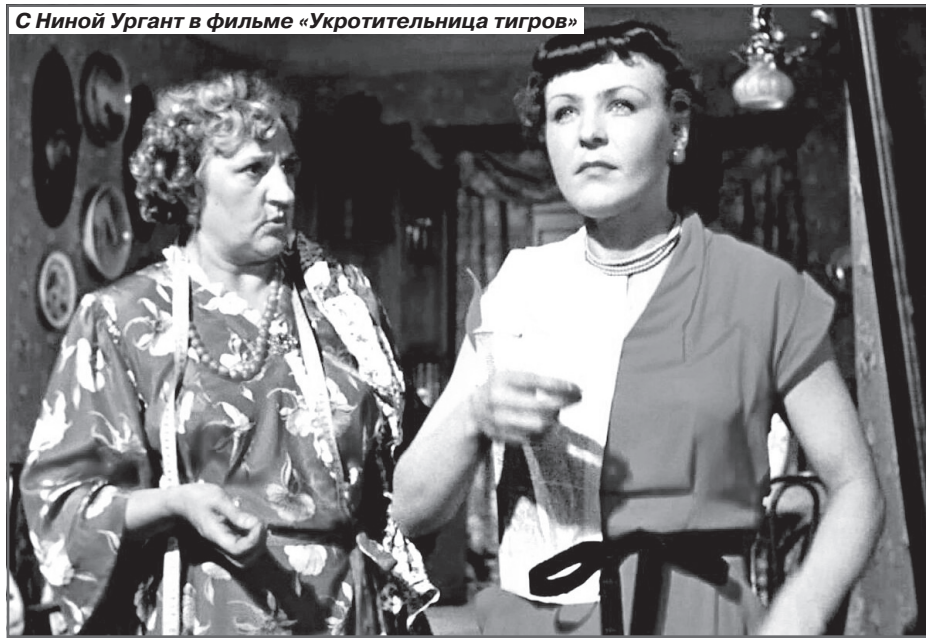
С Ниной Ургант в фильме «Укротительница тигров»