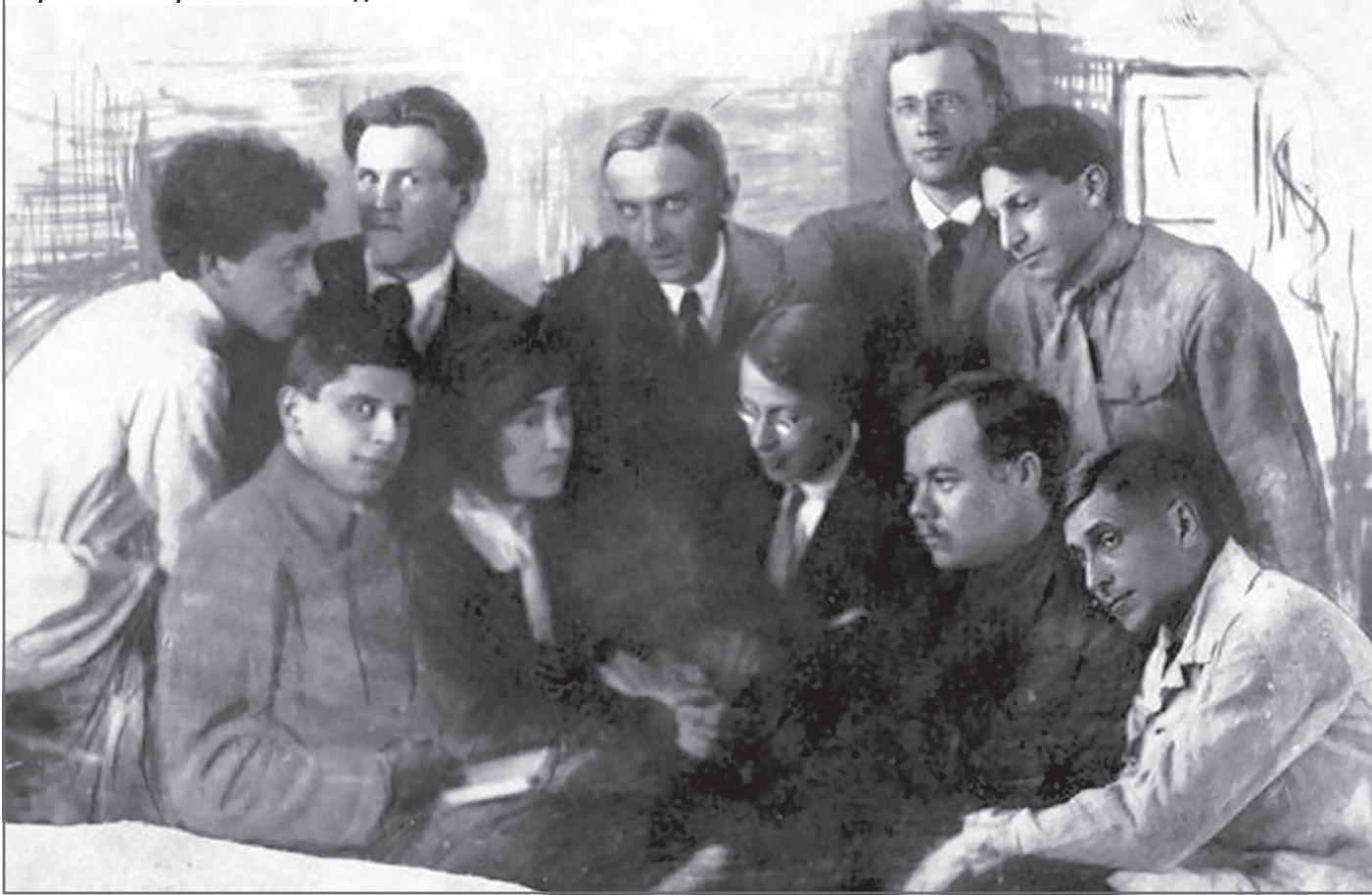
Серапионовы братья. 1920-е годы