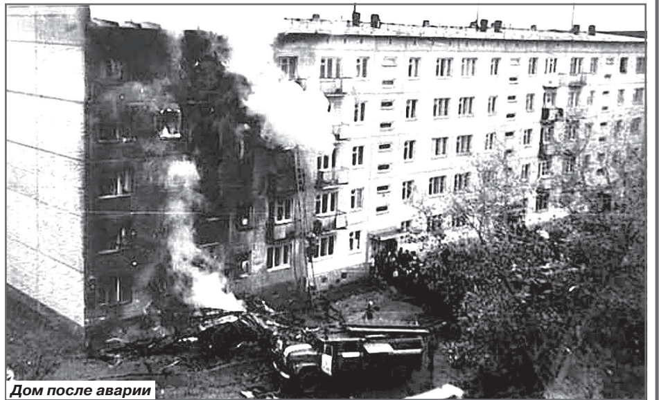
Дом после аварии