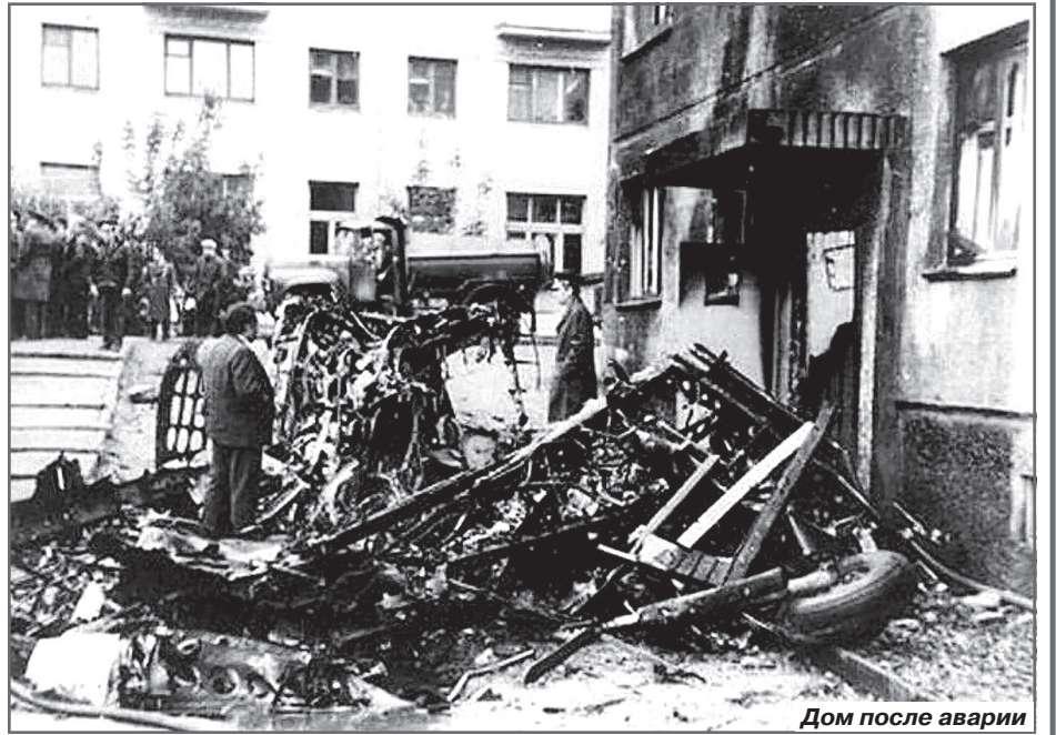
Дом после аварии