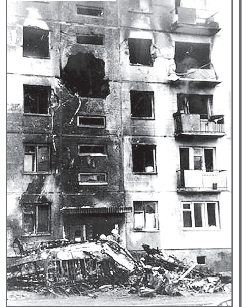
Дом после аварии

Нижние панели имеют рисунок в виде волн, а новые верхние панели остались без рисунка.