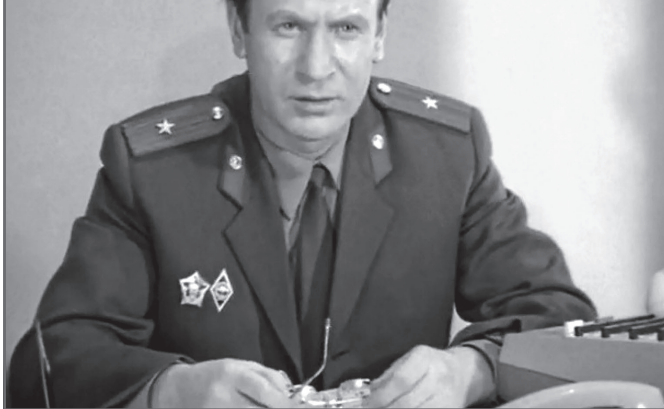
В фильме «Сержант милиции», 1974 год