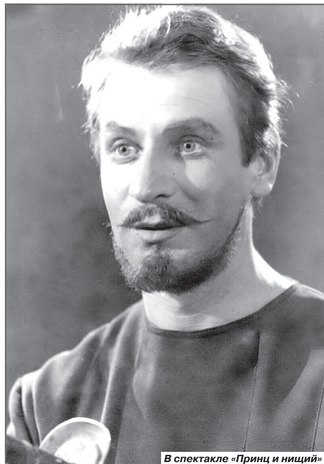
В спектакле «Принц и нищий»