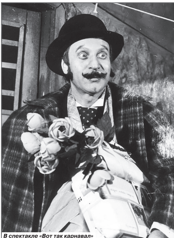
В спектакле «Вот так карнавал»

настолько не понимать, что для меня один свет в окошке - театр.