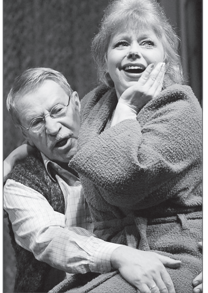
В спектакле «Утоли мои печали»