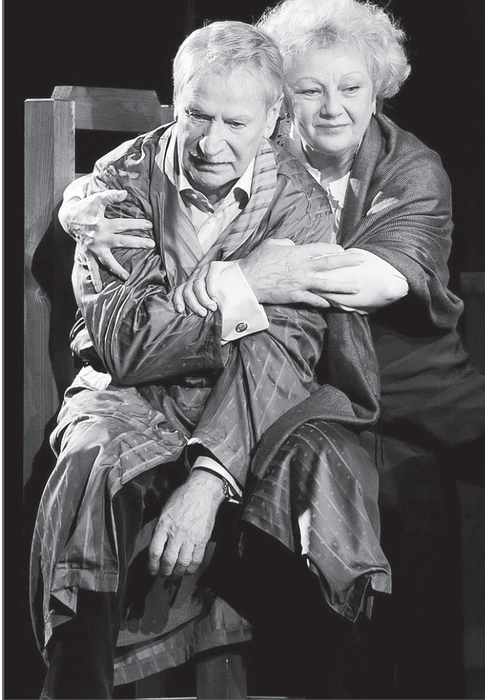
В спектакле «Эрос»