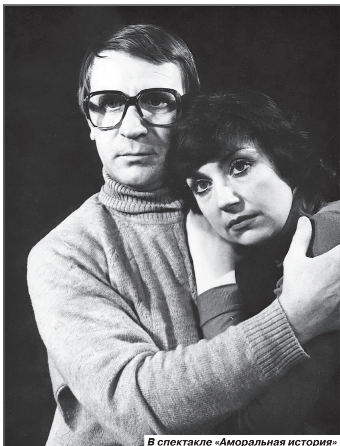
В спектакле «Аморальная история»