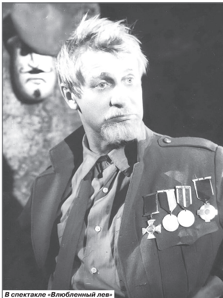
В спектакле «Влюбленный лев»