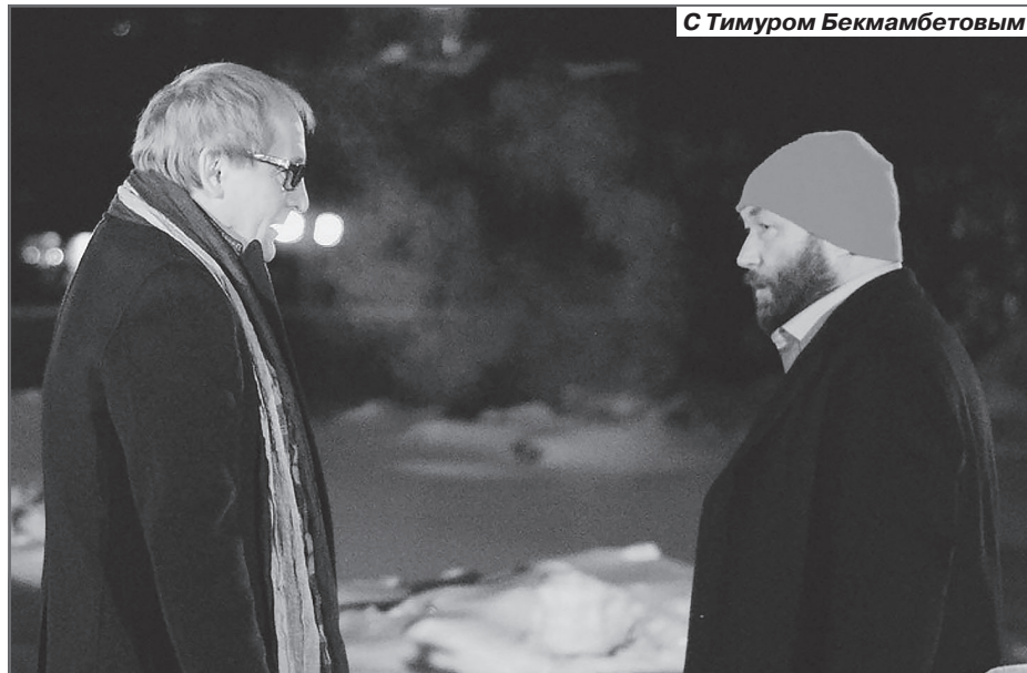
С Тимуром Бекмамбетовым

А почему это плохо? Я не считаю, что это плохо. Просто это не входит в разряд вашего хорошо. Была такая сложность: он все равно персонаж знаковый. Вот как Гесер - хороший, Завулон - плохой. Мне этого плохого нужно было сделать понятным, телесным. То есть этот знак, этот скелет насытить какой-то жизнью. Стали фантазировать, как бы это могло быть. Я, например, придумал собаку. По-моему, ее нет в произведении. Собака, которая все время рядом со мной. Потом думал, кем бы мог быть мой герой, если они живут по две тысячи и более лет. И Гесер, и Завулон, кем бы они могли быть в прошлой жизни? Чтобы не уноситься в средние века, я придумал... Допустим, он моего возраста, чуть постарше, вот кем он был десять или двадцать, или тридцать лет назад, то, что у нас еще в памяти. В какие-то советские времена. Вот и придумал, что, если Гесер был каким-нибудь секретарем райкома, то Завулон в той ситуации был непременно диссидентом или космополитом, или