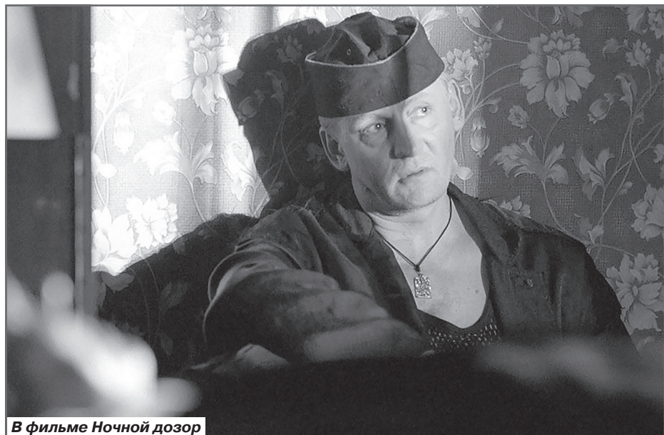
В фильме Ночной дозор

Хорошо, когда у тебя есть не поклонники, а почитатели. Это два совершенно разных смысла. Есть люди, которые воспринимают тебя идолом или сопо-