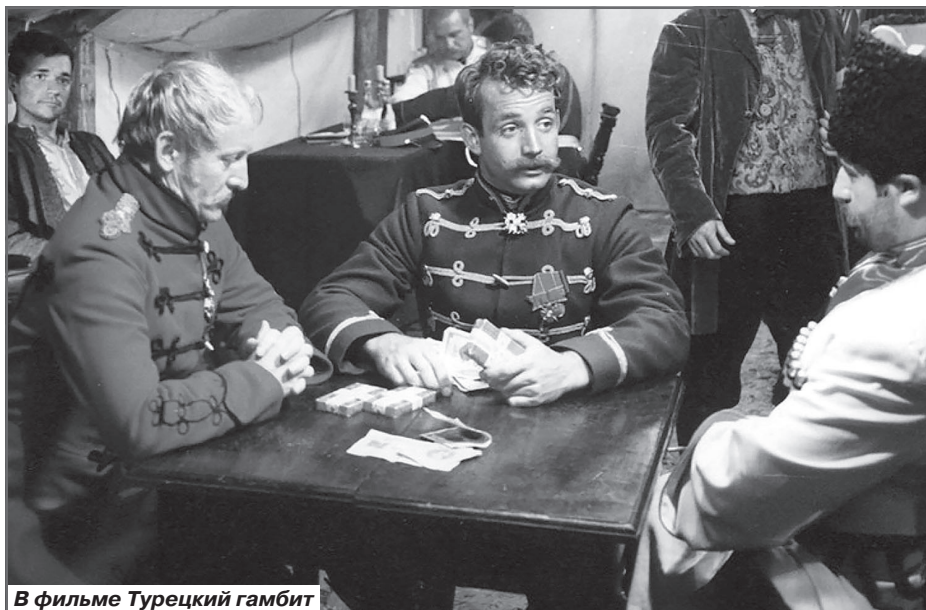
В фильме Турецкий гамбит