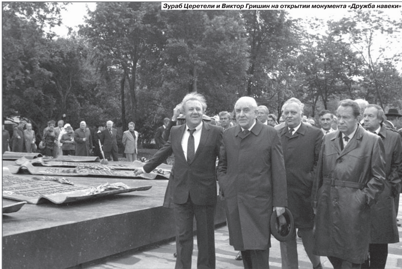
Зураб Церетели и Виктор Гришин на открытии монумента «Дружба навеки»