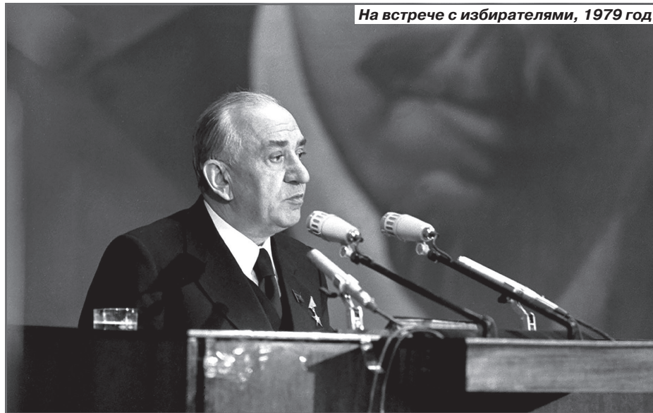
На встрече с избирателями, 1979 год

- Он был лучшим руководителем этого города, - считает последний первый секретарь Мосгоркома КПСС Юрий Прокофьев.