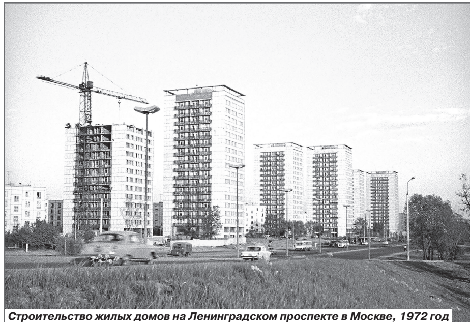
Строительство жилых домов на Ленинградском проспекте в Москве, 1972 год