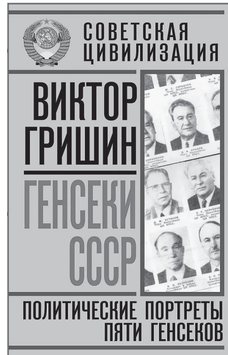
Обложка книги «Генсеки СССР»

В феврале 1986-го Гришина исключили и из Политбюро в связи с уходом на пенсию.