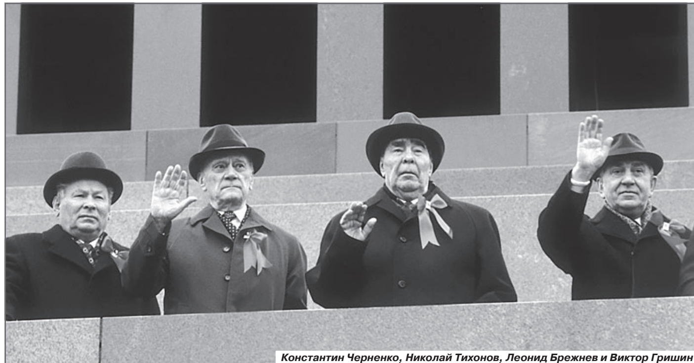
Константин Черненко, Николай Тихонов, Леонид Брежнев и Виктор Гришин