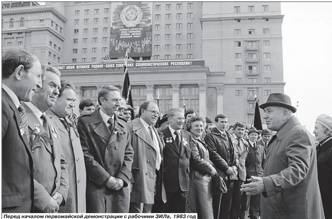
Перед началом Первомайской демонстрации с рабочими ЗИЛа, 1983 год