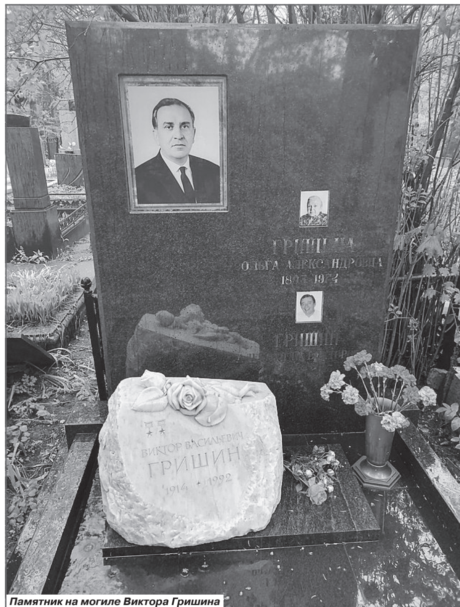
Памятник на могиле Виктора Гришина