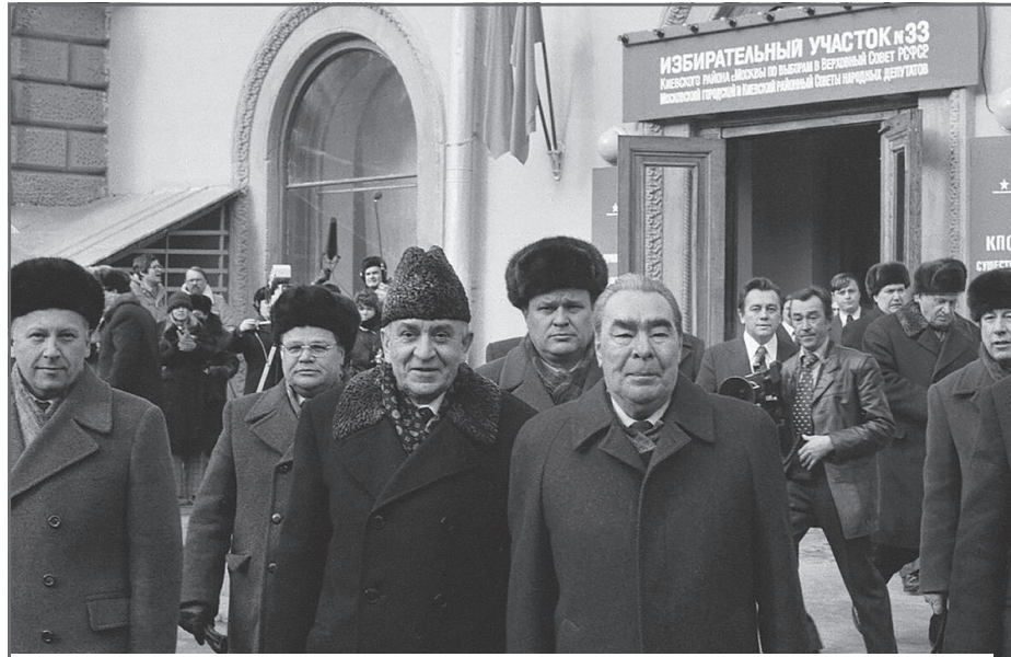
Виктор Гришин и Леонид Брежнев во время выборов в Верховный Совет РСФСР

С другой стороны, первый секретарь МГК наотрез отказался открывать в Москве лицеи, считая, что ни к чему хорошему эта идея не приведет.