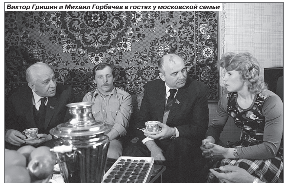
Виктор Гришин и Михаил Горбачев в гостях у московской семьи