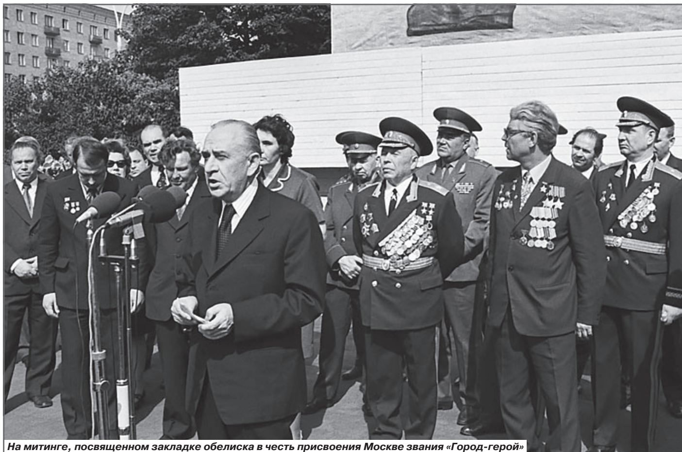
На митинге, посвященном закладке обелиска в честь присвоения Москве звания «Город-герой»

В 1967 году обострился конфликт Леонида Брежнева с первым секретарем Московского горкома КПСС Николаем Егорычевым, который примыкал к так называемым комсомольцам - сторонникам претендовавшего на высшую власть в стране Александра Шелепина. Егорычев восстановил Триумфальную арку на Кутузовском проспекте и возвел Мо-