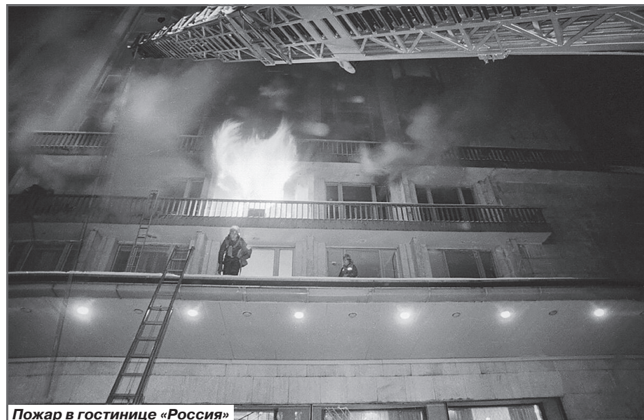
Пожар в гостинице «Россия»

- Забеспокоился, наверняка там не все чисто.