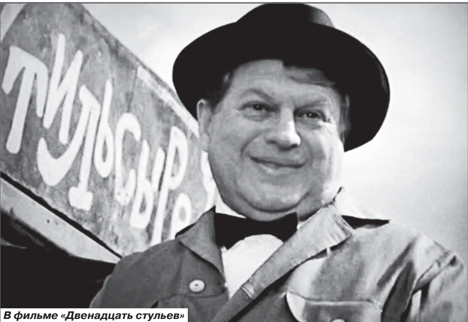
В фильме «Двенадцать стульев»