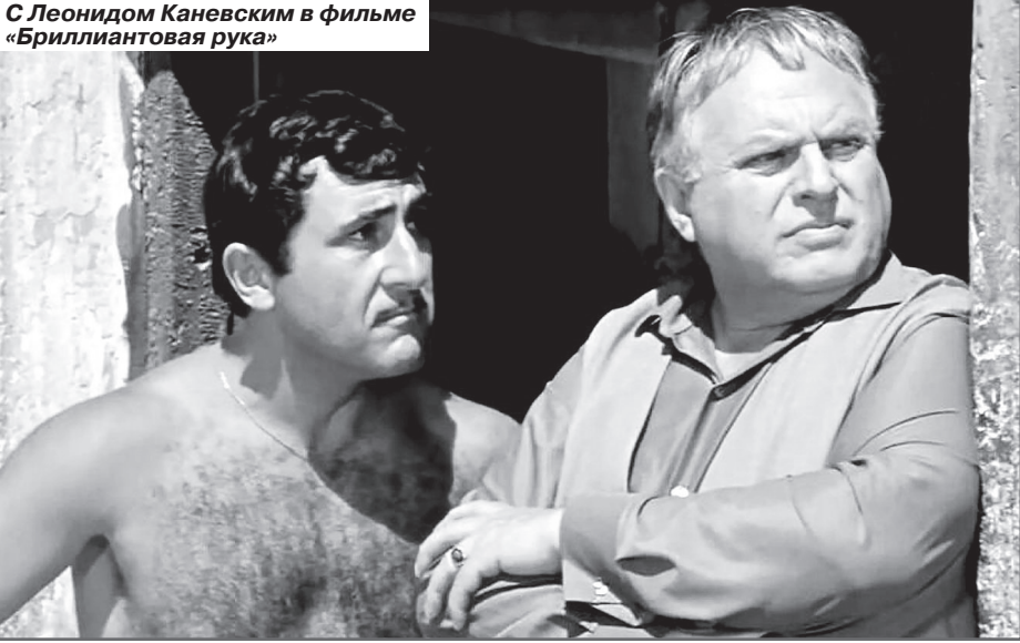
С Леонидом Каневским в фильме «Бриллиантовая рука»