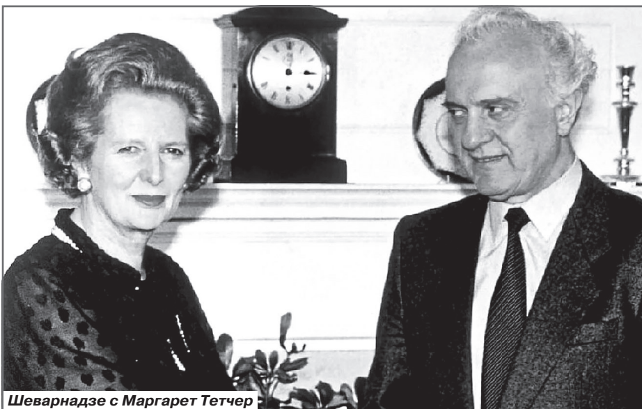
Шеварнадзе с Маргарет Тетчер

И покладистый Василий Павлович на Никиту Сергеевича затаил обиду.