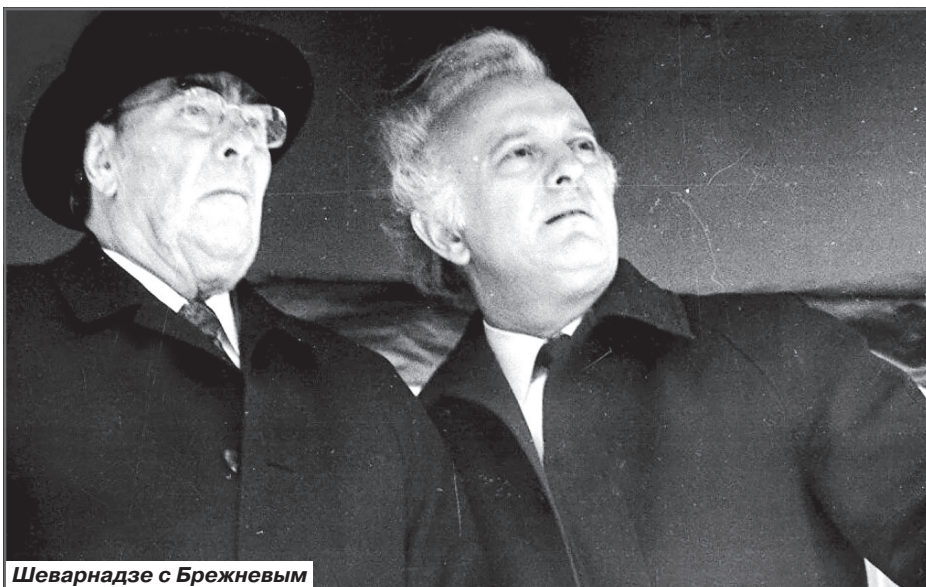
Шеварнадзе с Брежневым