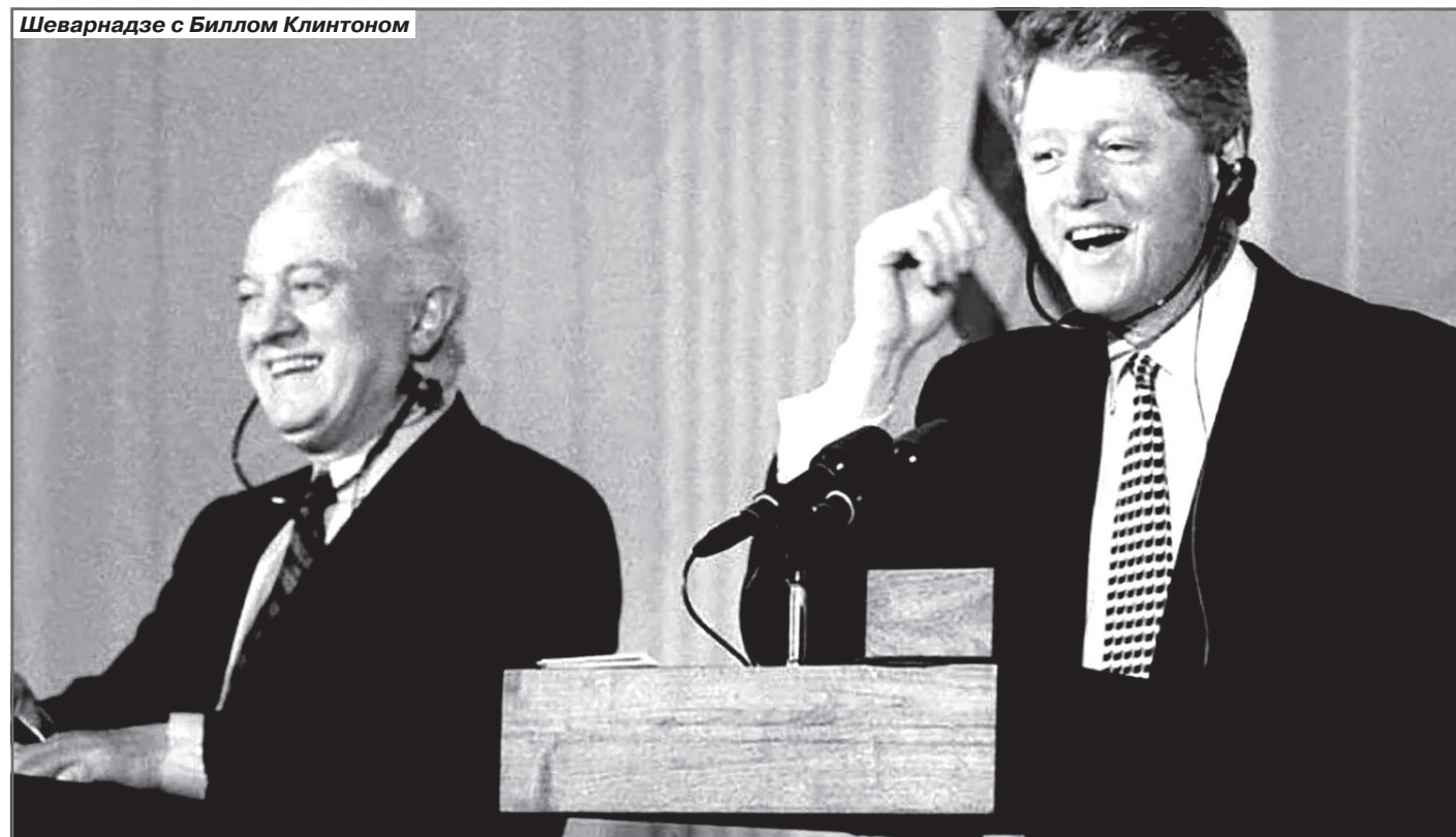
Шеварнадзе с Биллом Клинтон

А Эдуард Шеварнадзе повторил судьбу Василия Мжаванадзе. Из кресла президента Эдуарда Амвросиевича выбросил его ученик Михаил Саакашвили, обвинив его в коррупции. Это событие произошло в ноябре 2003-го года. Просто бумеранг, сделав круг, прилетел к тому, кто его запустил.