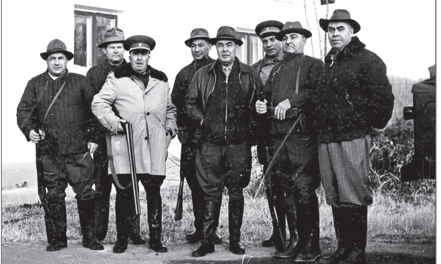
Леонид Брежнев (в центре) и Василий Мжаванадзе (второй справа) на охоте

Сначала Мжаванадзе был предан Хрущеву. На XX-м съезде КПСС Никита Сергеевич выступил с докладом о культе личности Сталина. Народ Грузии возмутился, и организовали демонстрацию в поддержку доброго имени Иосифа Сталина. На демонстрацию вышли фронтовики, к ним присоединились студенты. Было написано письмо о том, что надо сместить Хрущева, а назначить Вячеслава Молотова. Демонстрация была подавлена, жертвами подавления стали двести человек.