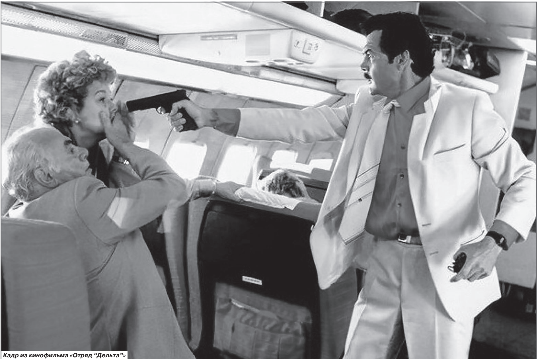
Кадр из кинофильма «Отряд "Дельта"»