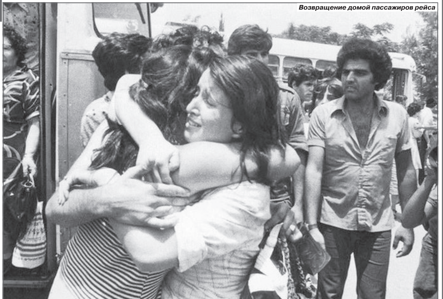
Возвращение домой пассажиров рейса

Условия заключения у них были комфортными - постаралась литовская диаспора, которая была целиком на стороне террористов. Им разрешались неограниченные встречи с журналистами, передачи в размере 300 долларов, а содержались они каждый в отдельной камере, которая больше напоминала скромную квартиру, чем место заключения.