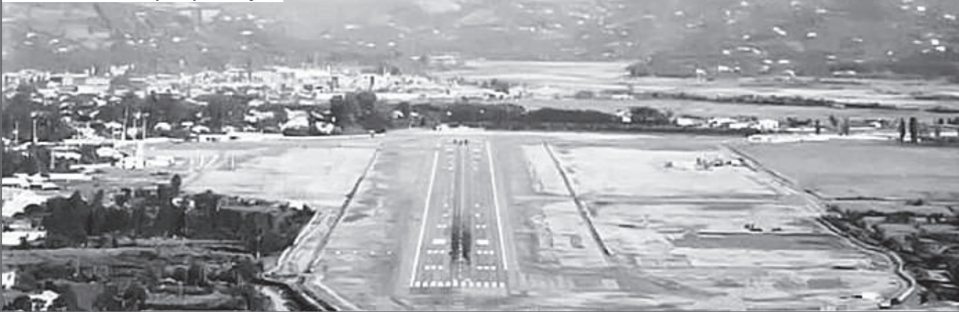
Взлетная полоса аэропорта Батуми

План побега он разрабатывал второпях. Через знакомых поменял рубли на долла-