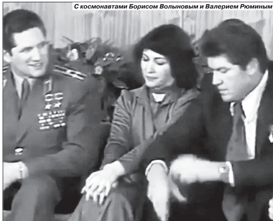
С космонавтами Борисом Волиновым и Валерием Рюминым