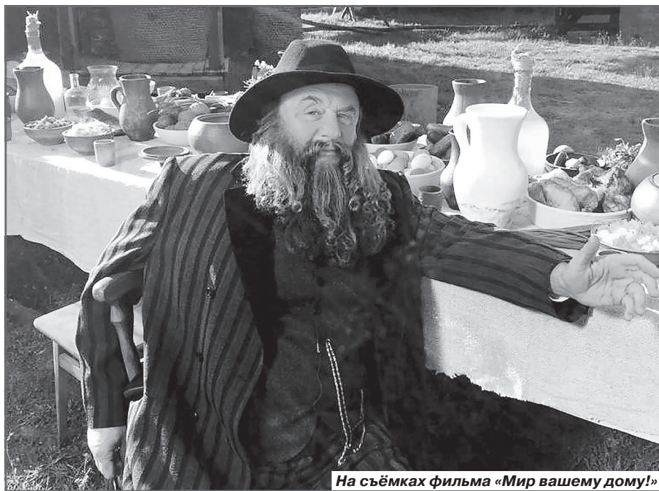
На съёмках фильма «Мир вашему дому!»