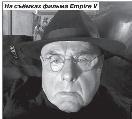
На съёмках фильма Empire V