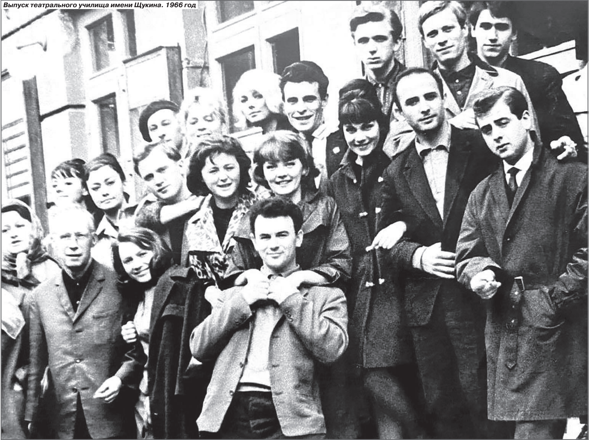
Выпуск театрального училища имени Щукина. 1966 год