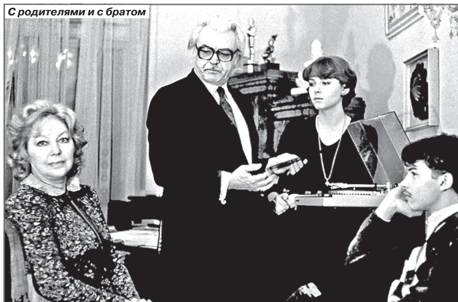
С родителями и с братом