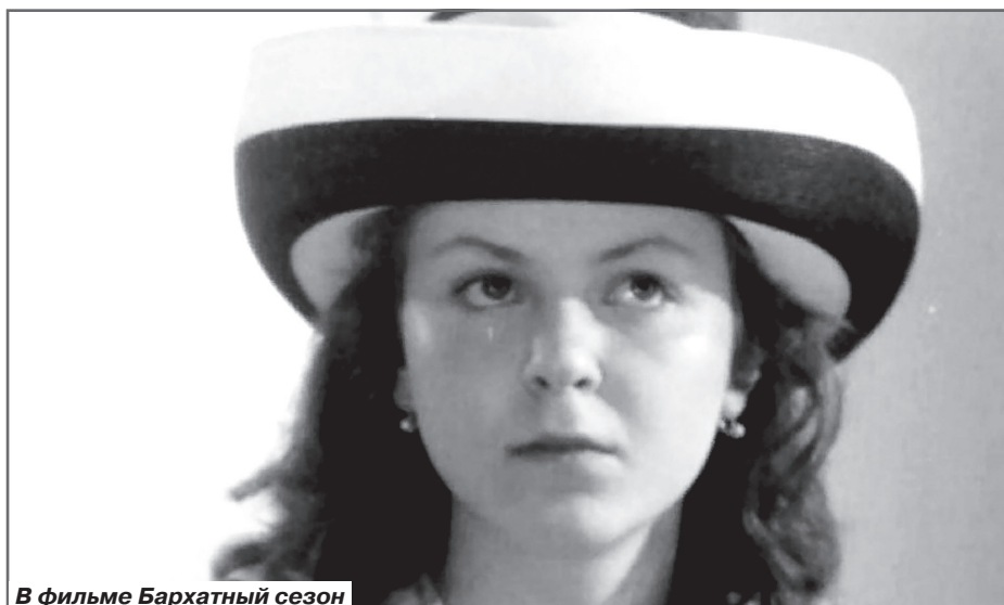
В фильме Бархатный сезон

смотря на то, что актерская карьера Алены уверенно шла вверх, она, бросив все, уехала за супругом. Правда, когда отец Сергей Бондарчук начал работать над своей новой картиной «Тихий Дон», Алена стала регулярно летать на съемки в Москву.