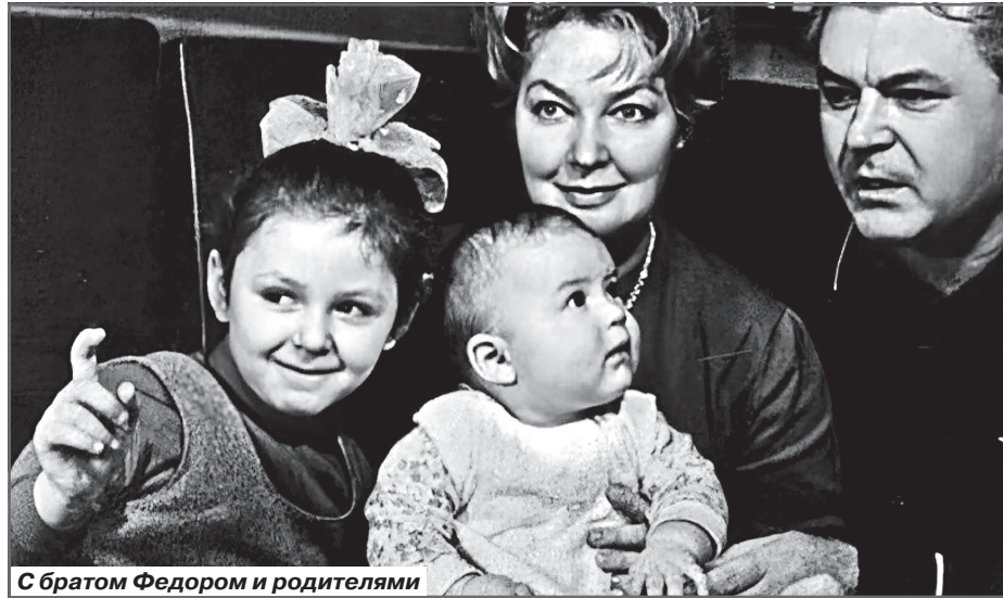
С братом Федором и родителями

В 1992 году на экраны вышел многосерийный фильм Сергея Бондарчука «Тихий Дон» с Аленой в главной роли. После него о дочери прославленного режиссера заговорили как еще об одном талантливом представителе кинематографической династии.