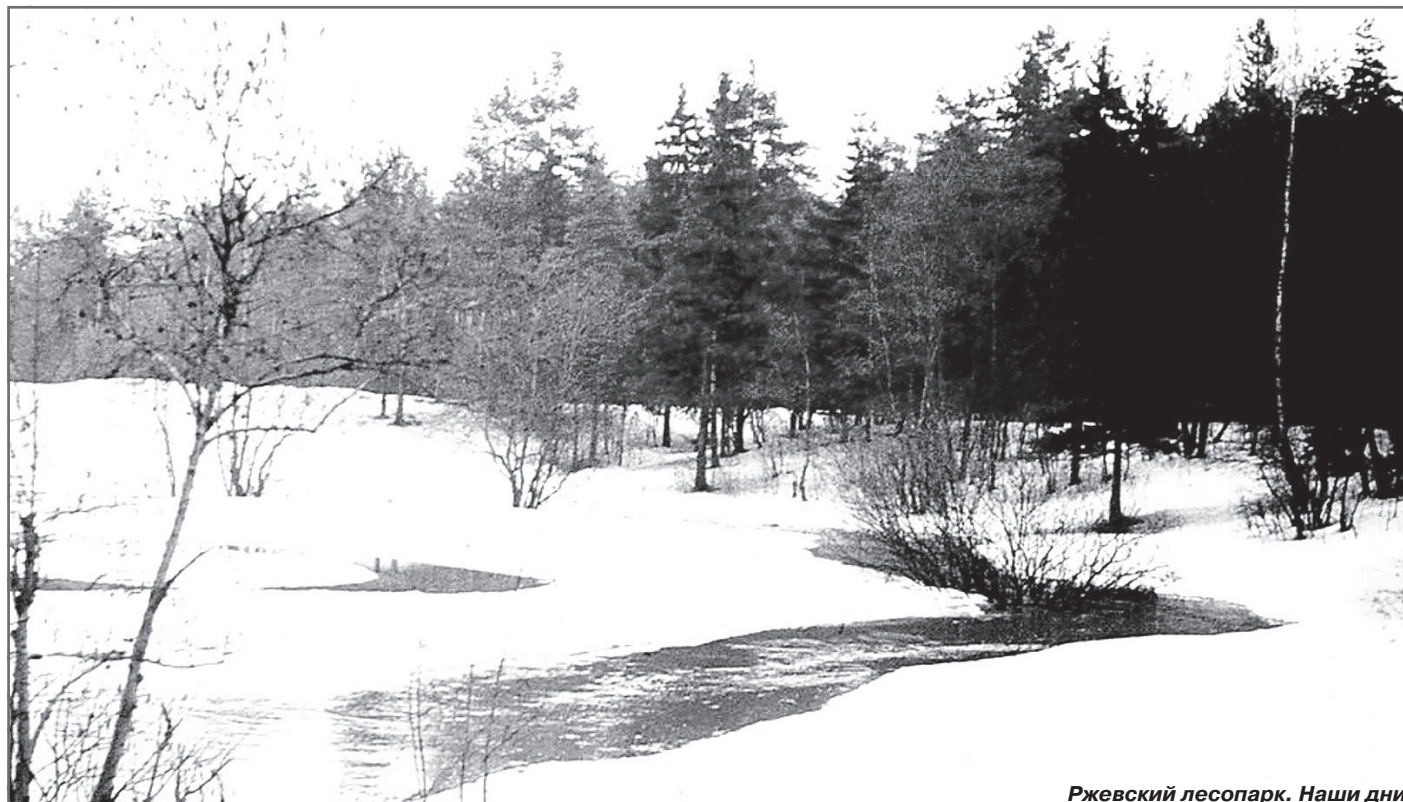
Ржевский лесопарк. Наши дни