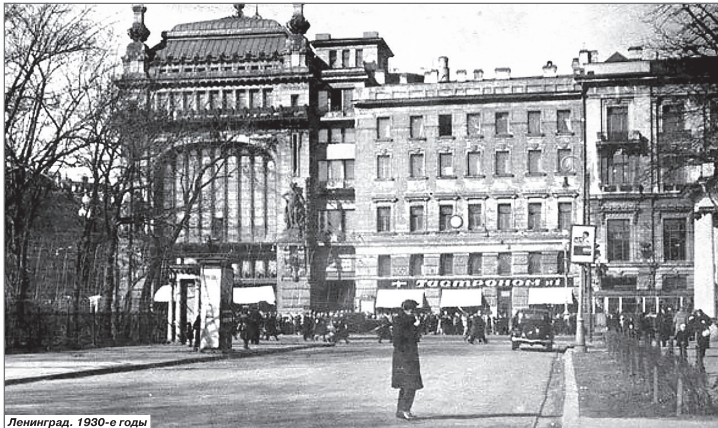
Ленинград. 1930-е годы