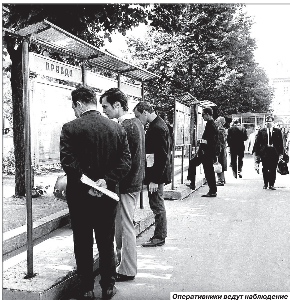
Оперативники ведут наблюдение