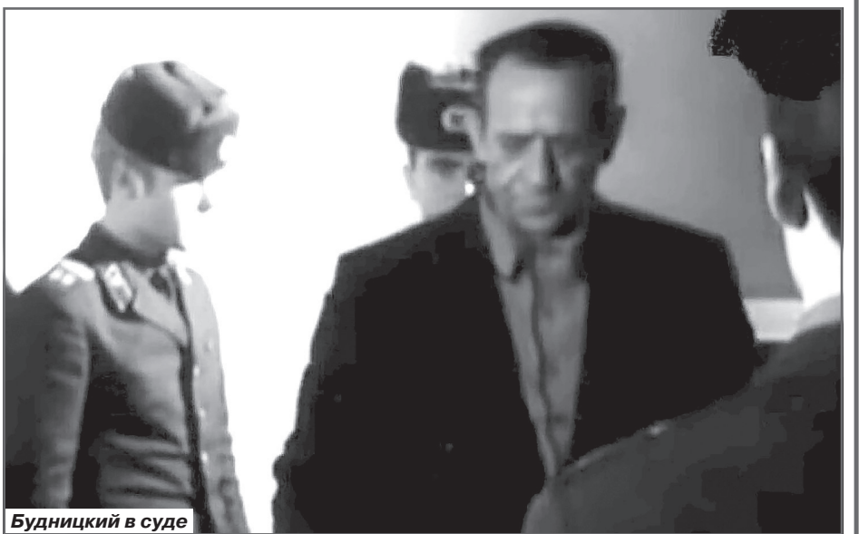
Будницкий в суде