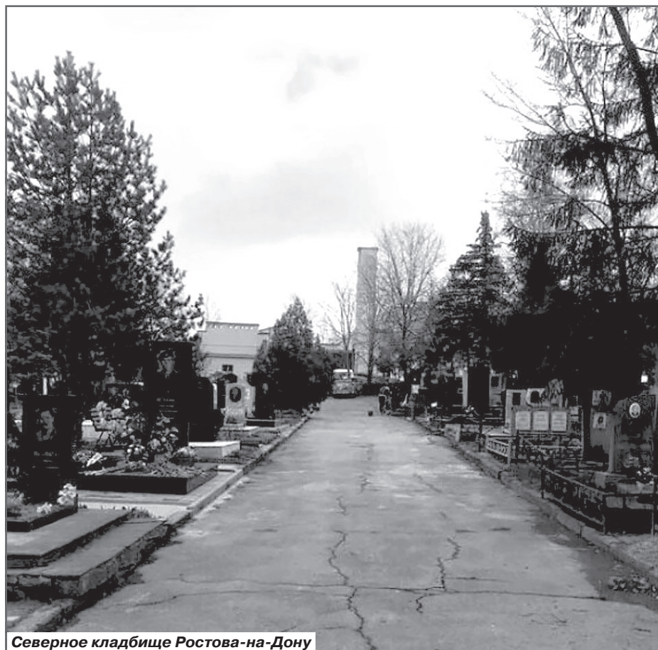
Северное кладбище Ростова-на-Дону

Через три года он скончался в местах не столь отдаленных. Его тело перевезли в Ростов, и похоронили с почестями на Центральной аллее Северного кладбища.