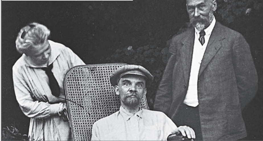
Некоторые фотографии Ленина вообще нельзя было показывать народу