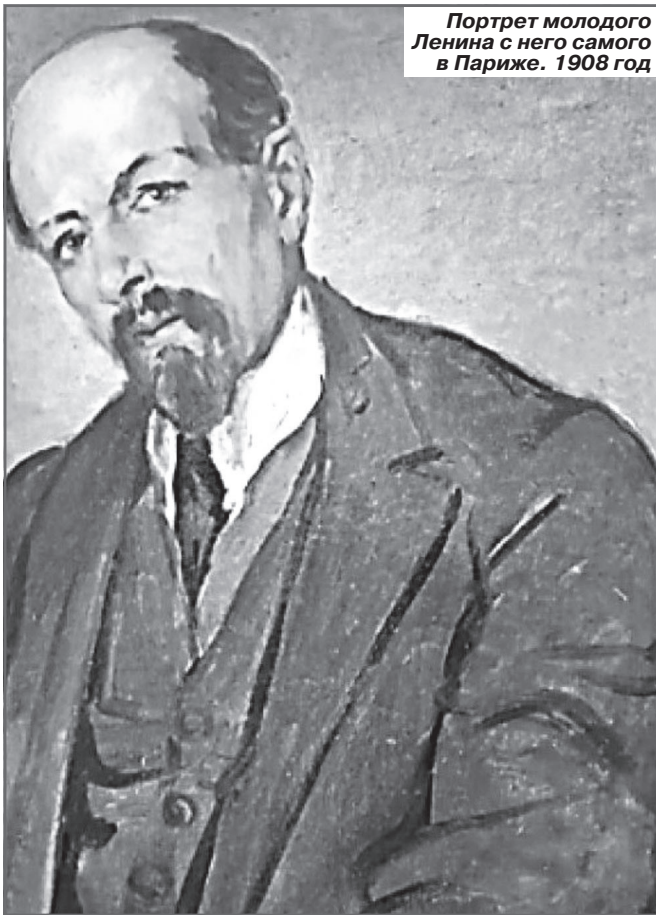
Портрет молодого Ленина с него самого в Париже. 1908 год

Иосиф Славкин мирно скончался в 1974 году, проживая по-тихому накопленные богатства от своей удалой смелости.