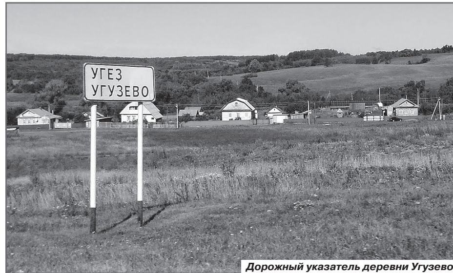
Дорожный указатель деревни Угузево