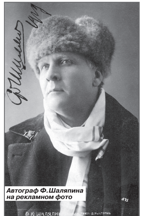
Автограф Ф. Шаляпина на рекламном фото