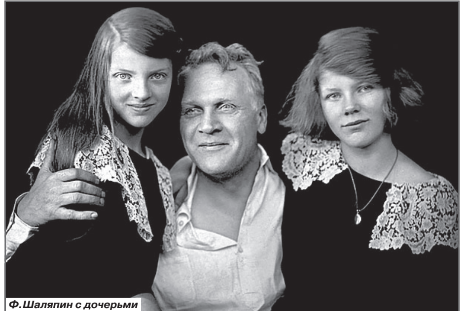
Ф. Шаляпин с дочерьми